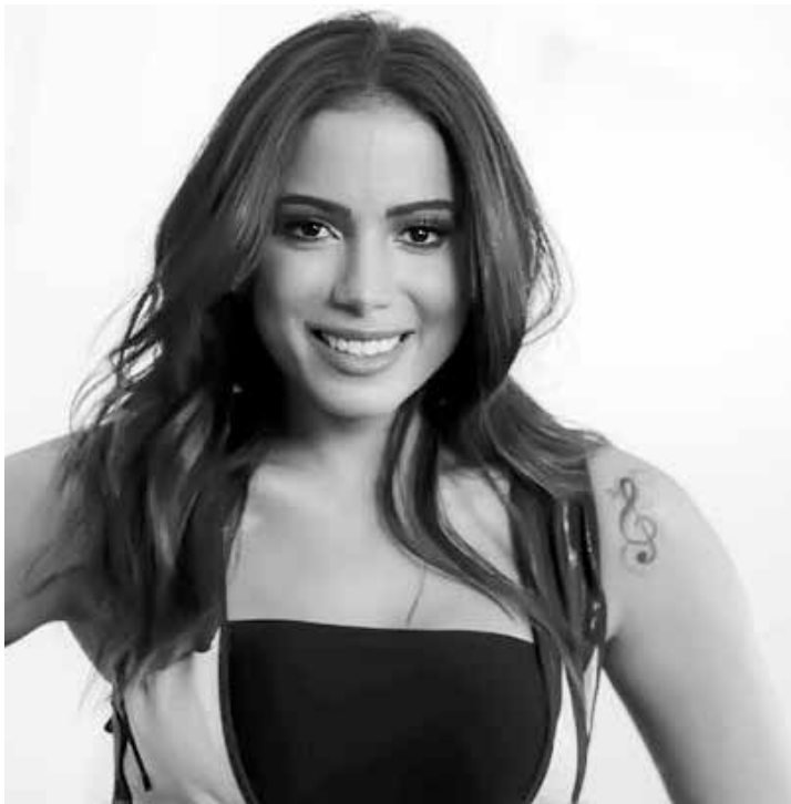
Organizadores do evento não gostam do estilo das musicas da Cantora