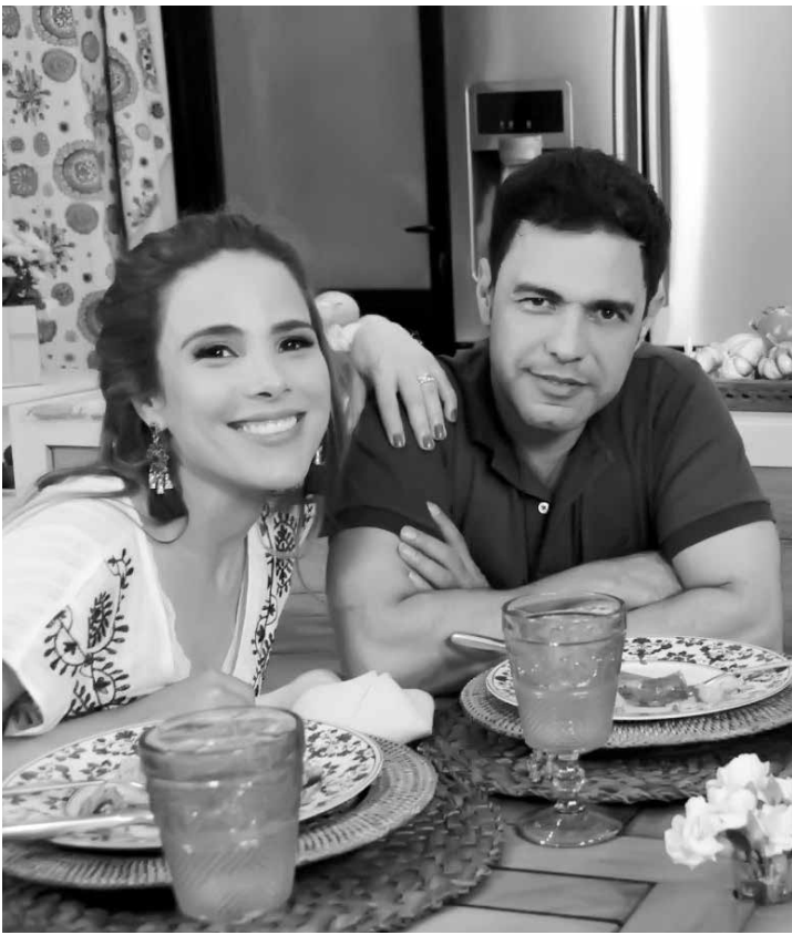
Cantora acrescentou: ‘Mas como todo pai e filha, a gente discorda de opiniões’

Após a polêmica, a filha de Zilu opta, agora, por não opinar entre os desentendimentos entre a mãe e a madrasta. “Não quero entrar em detalhes, mas não tenho nenhum sentimento a não ser gratidão e amor incondicional pelo meu pai. Não quero me expor. Antes eu falava o que sentia e