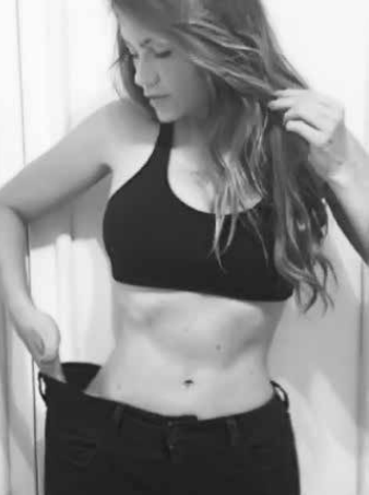
“Perdi quase todas as minhas roupas”

grada. “Em dez anos de rainha de bateria, cometi todos os erros que você pode imaginar. Já fui sem comer, já fui depois de comer arroz, feijão e bife, bati um pratão e passei mal. Até percebi uma coisa: durante a semana, tem que beber muito líquido, principalmente nesse calorão. Já fiz loucuras, mas esse ano é só uma alimentação leve, bem nutritiva”.