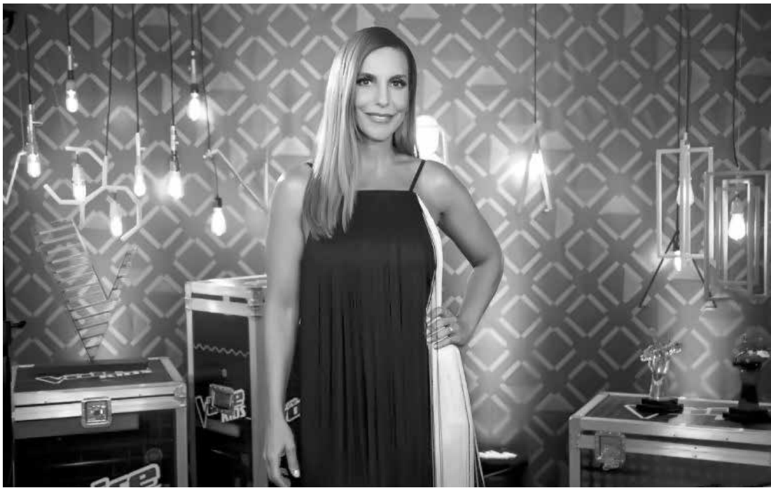
Muitos fãs comentaram que a cantora estava mais magra no programa

pretende comprar o look, terá de desembolsar R$ 12 mil reais. A obra é da grife Mugler e vem todo trabalhado na técnica do “illusion dress”, que causa uma certa ilusão em quem o vê.