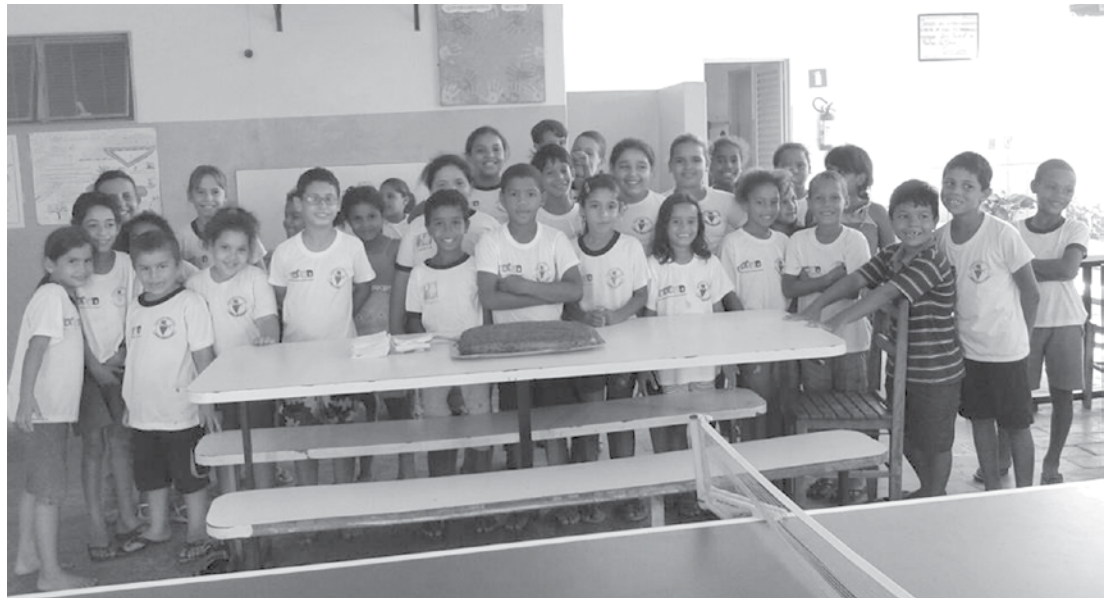
Atualmente, a associação atende 85 crianças e adolescentes

“Gostaria de fazer um apelo. Como sabem servimos quatro refeições diárias, sendo elas: café da manhã, almoço, café da tarde e jantar. Na parte da manhã atendemos adolescentes que saem daqui já almoçados e vão à escola. Na parte da tarde, porém, as crianças chegam às 15h. Lancham e, entre às 17h30 e às 18h, é servido o jantar. Entretanto nossa situação está crítica, devido a uma mudança relacionada à legislação federal. Ainda não foi liberado nenhum recurso e já não estamos tendo o que servir aos nossos atendidos”,