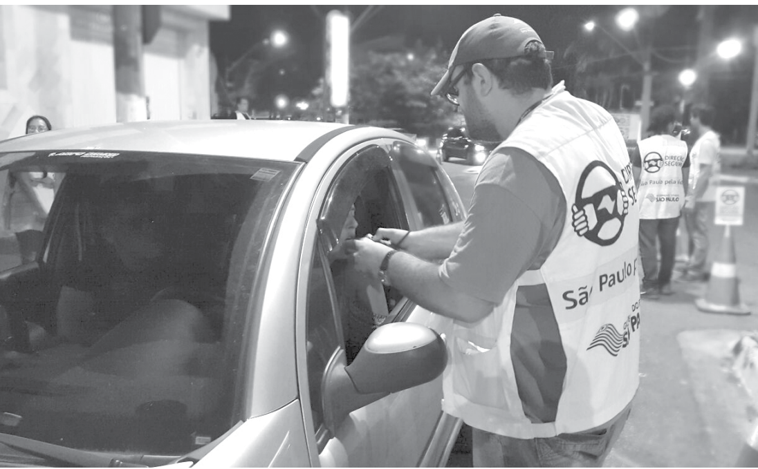
Blitze de fiscalização da Lei Seca foram realizadas entre a noite de sexta-feira (03) e a madrugada de domingo (05); ao todo, 846 condutores foram submetidos ao teste do etilômetro