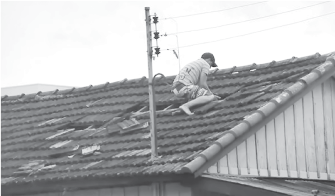
Morador troca telhas de casa atingida durante temporal

Galhos de uma árvore atingiram e danificaram uma caminhonete que pertence ao seu vizinho. O valor do prejuízo chega a R$ 8 mil. Os moradores passaram o dia limpando as casas e trocando as telhas quebradas. MAIS ESTRAGOS Em Meridiano, os estragos foram grandes: telhas quebradas, árvores arrancadas, caibros e vigas foram lançados nos telhados de residências. “Estou contabilizando meu prejuízo. Acredito que deve ficar em aproximadamente R$ 6 mil.