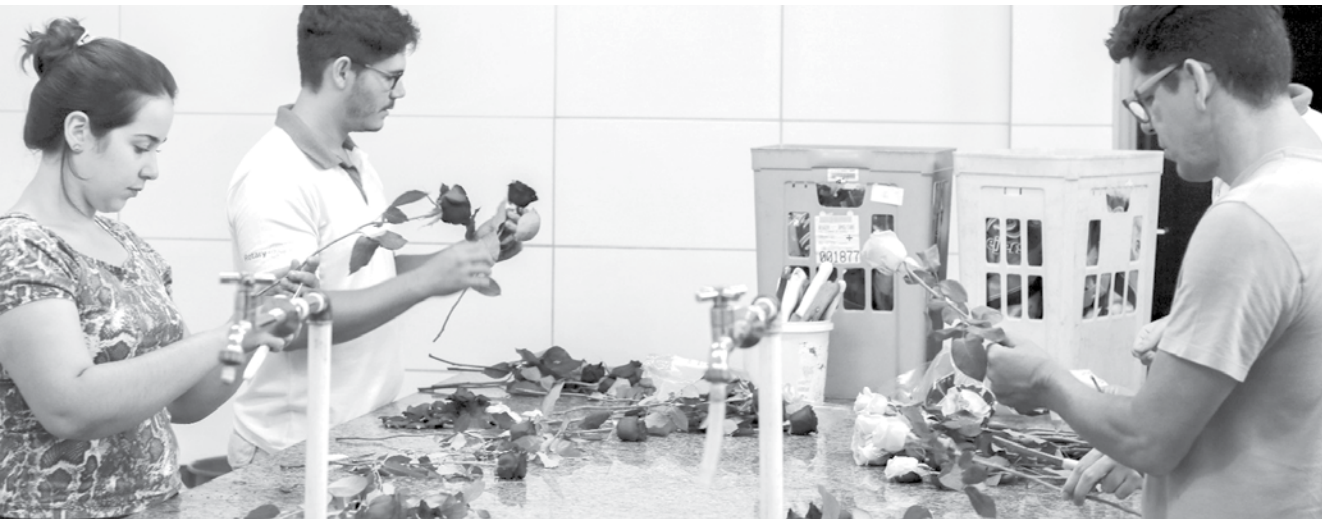
Mais de 400 rosas foram entregues a funcionárias e pacientes da Santa Casa de Fernandópolis