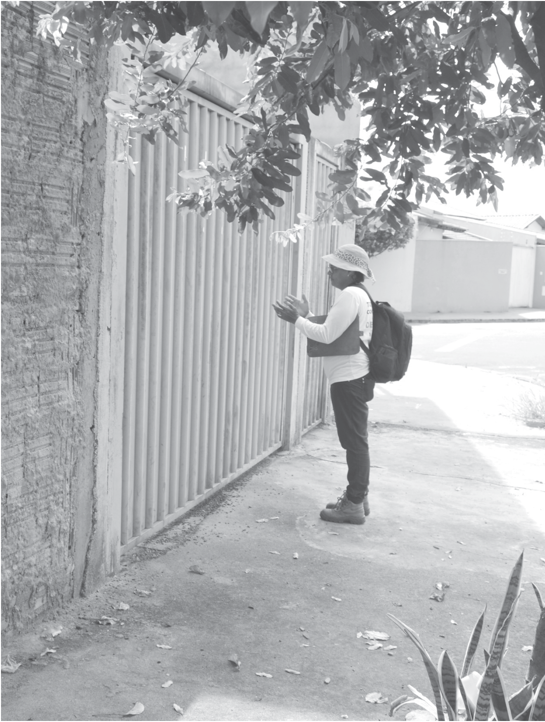
Lei Municipal, aprovada em abril do ano passado, permite o “ingresso forçado” a imóveis fechados ou abandonados em Fernandópolis

evitar quaisquer outras condições que propiciem a presença, criação, reprodução e proliferação dos mosquitos vetores que transmitem a Dengue, Chikungunya, Zica Vírus e outras doenças, bem como de outras pragas e animais nocivos à saúde humana. O não cumprimento das disposições da lei municipal sujeita o infrator à aplicação de penalidade de multa no valor equivalente a duas URM's (Unidades de Referência do Município), dobrada a cada reincidência. Em caso de pessoa jurídica, a reincidência implicará, também, na suspensão temporária do alvará de funcionamento por 30 dias, sem prejuízo da aplicação da multa, que será destinada ao Fundo Municipal de Saúde para a realização de ações de combate, prevenção e controle de proliferação dos mosquitos vetores e outras pragas e animais transmissores de doenças. Cabe ao agente de saúde o papel de