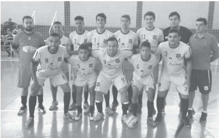
O primeiro jogo será no dia 17 de março, na cidade de Suzanópolis