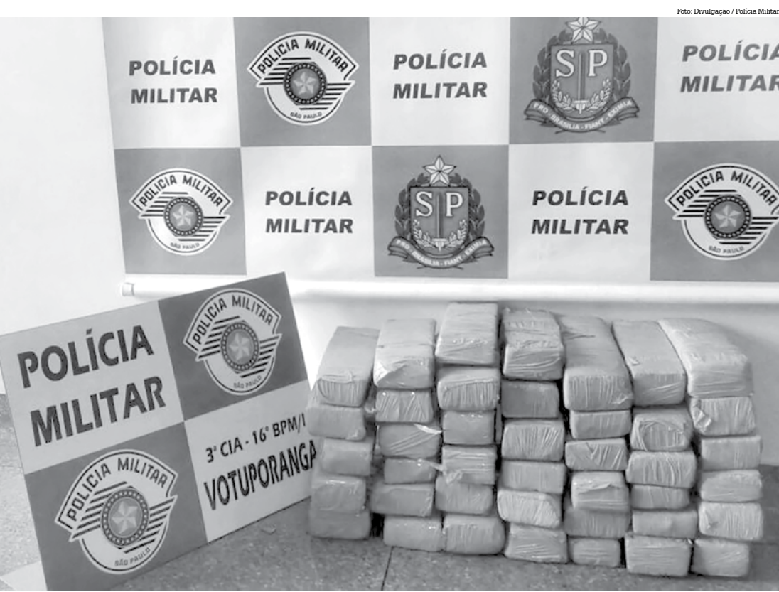
Droga apreendida pela Polícia em Magda