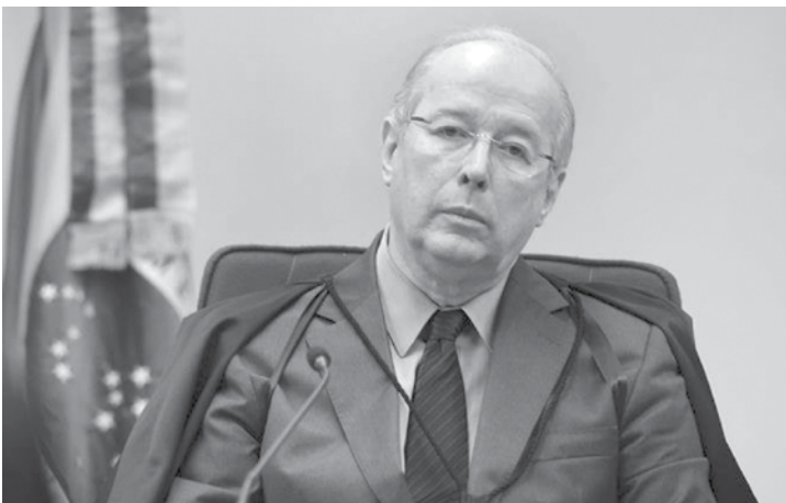
Ministro Celso de Mello, do Supremo Tribunal Federal

Fratelli”, na qual o MP-SP, o Ministério Público Federal e a Polícia Federal investigam fraudes em licitações ligadas à chamada “Máfia do Asfalto”. A quebra do sigilo telefônico foi deferida pelo juízo de primeiro grau em 2008, e, segundo a defesa, mantida por mais de dois anos sem a necessária fundamentação. Os advogados dos empresários sustentam, em pedido de Habeas Corpus, que “as interceptações foram determinadas com tese apenas em denúncia anônima, e que as decisões que as autorizaram não citam situações concretas dos interceptados”. Com base nesses fundamentos, buscam anular a “utilização e o compartilhamento” das escutas telefônicas com as demais ações penais a que o grupo