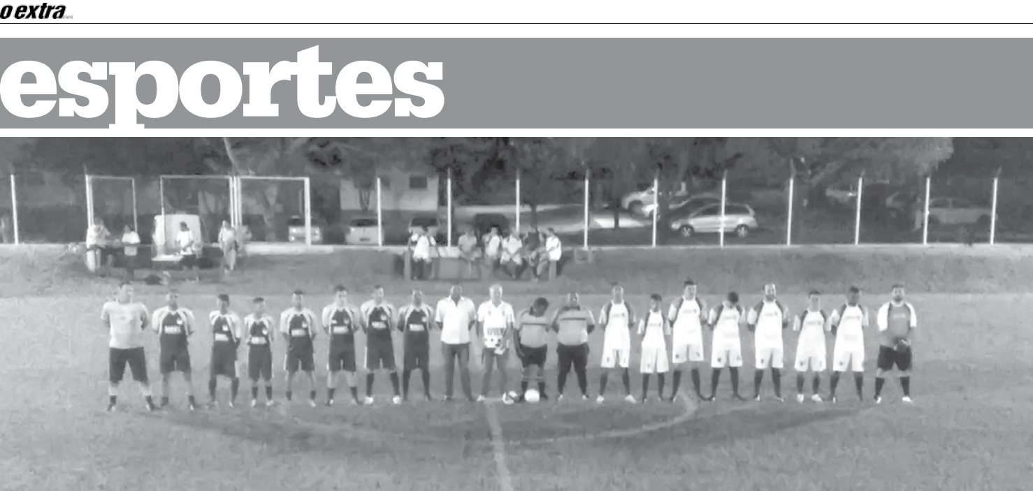
Tradicional competição do município acontece no campo da Secretaria de Esportes