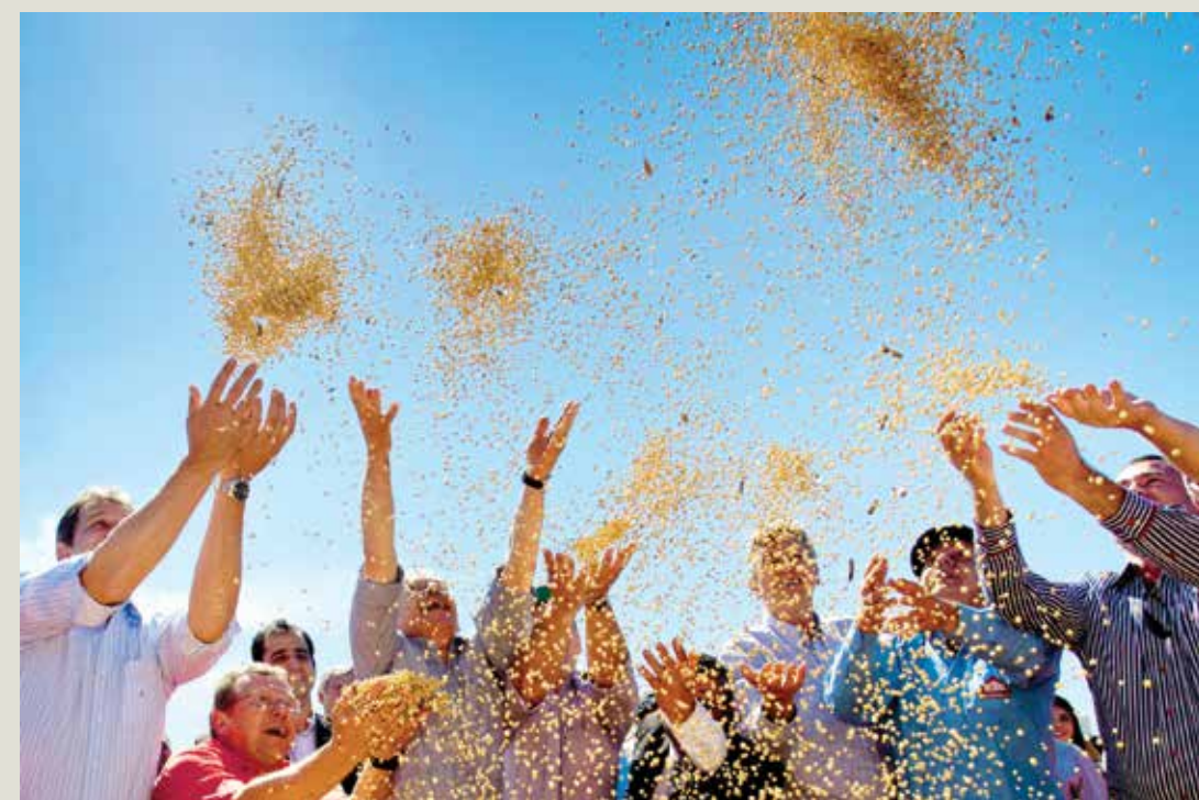
Produtores de soja comemoram os ótimos resultados de safra recorde