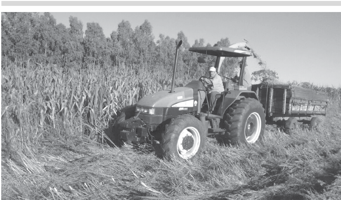
Serviço é desenvolvido pela Secretaria de Agricultura do município