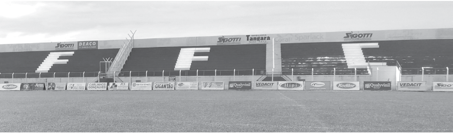
Estádio municipal não ficou pronto a tempo e o Fefecê fica fora do Paulista pela segunda vez na sua história

Federação Paulista de Futebol comunicou oficialmente, nesta semana, que nenhum clube entrará no lugar do Guará