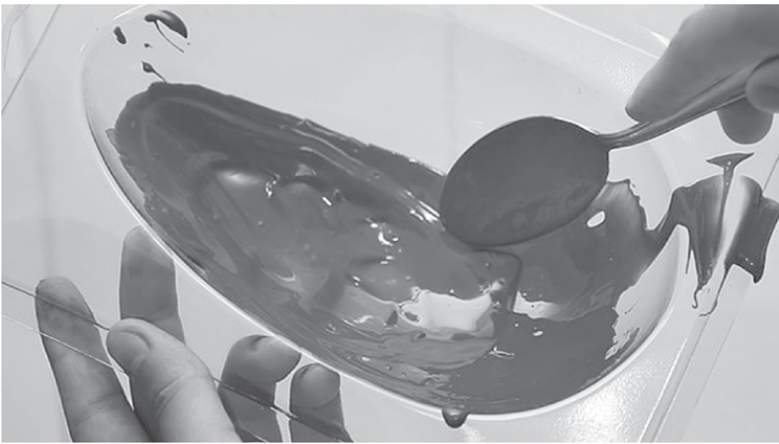
Segundo as empreendedoras, produto não pode deixar de ter qualidade, matéria-prima boa, e inovação para chamar a atenção dos clientes

Mas, antes de se arriscar a vender algum produto nesta