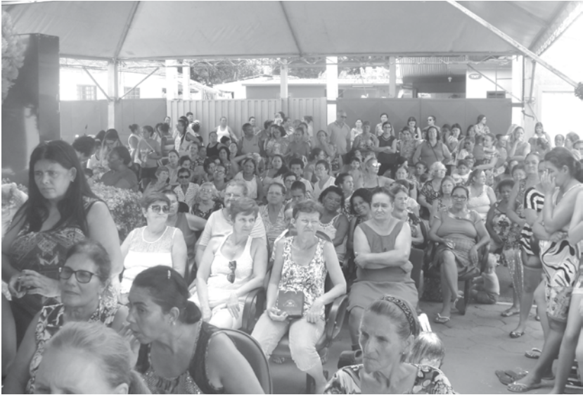
Dia foi marcado por exames e atividades em alusão à data

→ Da REDAÇÃO contato@oextra.net A Prefeitura de Guarani d'Oeste promoveu na última sexta-feira (10), um dia especial em comemoração ao Dia Internacional da Mulher. O dia todo foi marcado por várias atividades e exames voltados para a saúde e prevenção de doenças nas mulheres do município, entre elas: Exame de Glicose, Verificação da