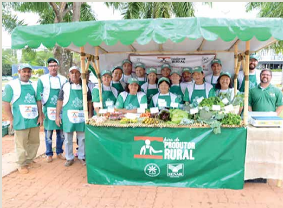
A Feira do Produtor Rural que funcionará semanalmente na área central de Fernandópolis, contará com barracas de bambu, faixas indicando o nome da propriedade e com produtores uniformizados conforme o padrão do Senar-SP como mostra a foto acima.

de de bambu, produtos rurais para comercialização, comercialização, gestão de negócios, Feira do Produtor Rural e consolidação do programa. O contato direto do produtor rural com o consumidor final é importante para a valorização do seu trabalho e de seus produtos, tanto na linha de orgânicos quanto convencionais, permitindo assim a troca de experiências com seus clientes. “A nossa primeira reunião será realizada no dia 20 de março, às 13 horas na sede do Sindicato Rural de Fernan-