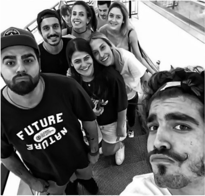
“Sou hétero, mas e se fosse homo? Você iria se sentir melhor que eu?”

Caio Castro rebateu um comentário preconceituoso que recebeu em uma foto postada em seu Instagram no último domingo (12). Para acompanhar uma imagem em que aparecia com vários amigos, o ator usou a legenda “migos”. Mas um fã não gostou: “Migos? Que coisa mais gay”. O ator, então, respondeu ao comentário. “Seu preconceituoso! Esse é problema do ser humano, achar que a opção sexual diferente da sua é uma anomalia! Sou hétero, mas se fosse homo? Você iria se sentir melhor que eu!? Ignorante”, escreveu o ator, que recebeu o apoio de outros fãs nos comentários.