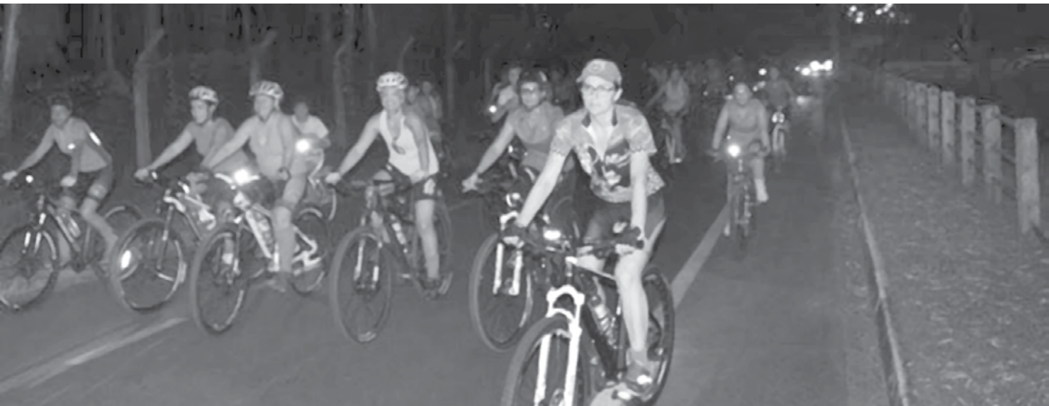
A caixas foram arrecadas no evento “Saia de Bike”

Após jogar por duas temporadas no Lucern, da Suíça, Makanaki recebeu uma proposta do 3 de Febrero, do Paraguai, e resolveu aceitar. Acabou ficando dois anos no país, e jogou até pelo gigante Olímpia, vice-campeão da Libertadores, em 2013.