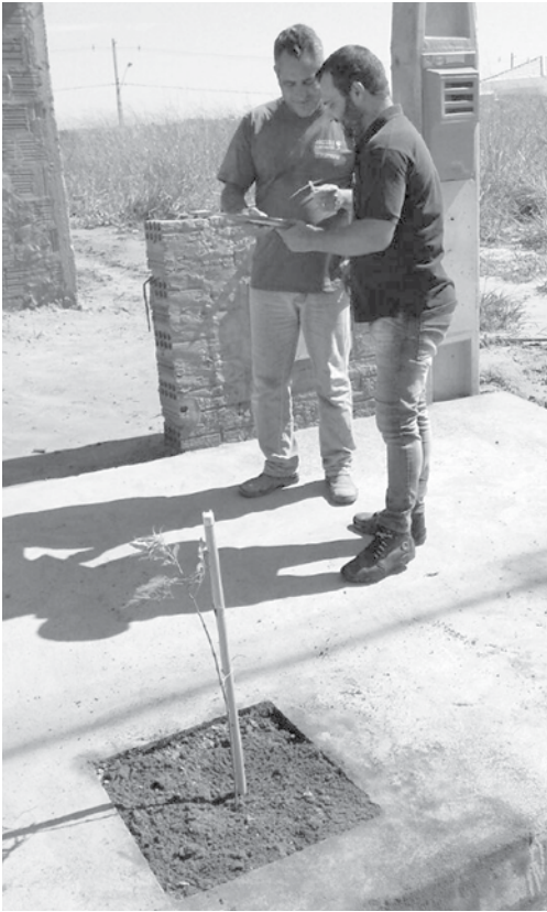
Solicitar o plantio é fácil, basta entrar em contato com a Secretaria Municipal do Meio Ambiente pelo telefone 3463-9014