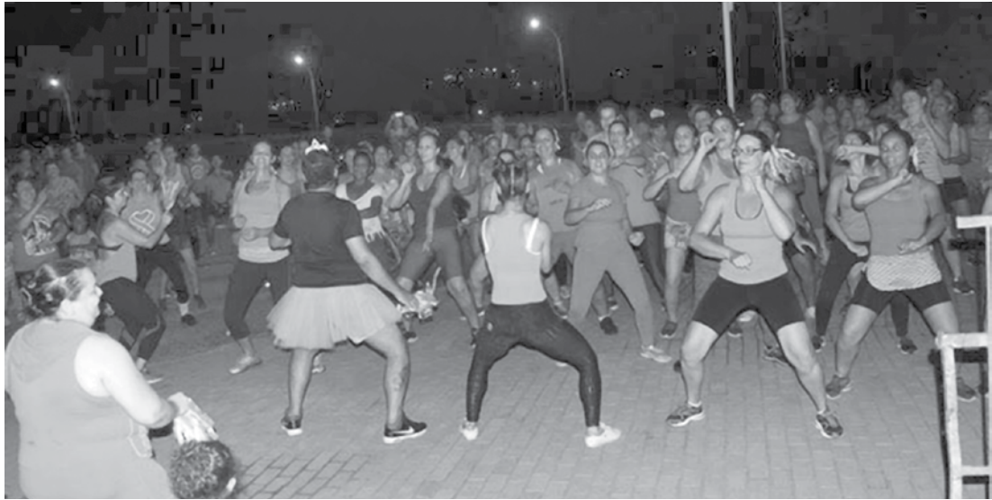
O evento contou com pedalada, corrida e zumba

O leite doado foi arrecadado durante evento promovido pela AFERCAN para comemorar o Dia Internacional da Mulher, que contou com corrida, pedalada, zumba, aquecimento proposto por uma academia da cidade, sorteio