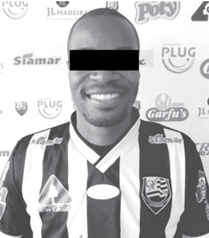
Jogador foi encaminhado à Cadeia Pública de Guarani d'Oeste após o último jogo do Votuporanguense