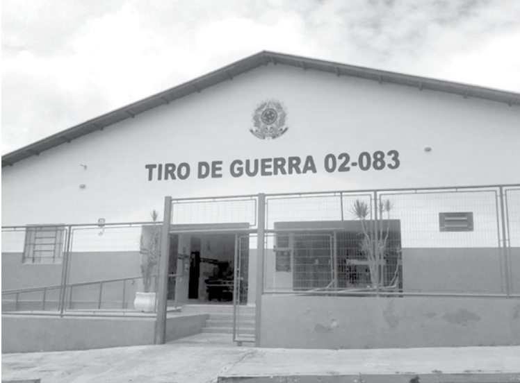
Fardados, 50 atiradores do TG vão tomar posse

O evento com a presença dos 50 atiradores será realizado na sede do ‘TG’, Av. Bento Miguel de Mendonça, nº 167 – Jardim Paulista e contará com a presença de autoridades civis e mili-