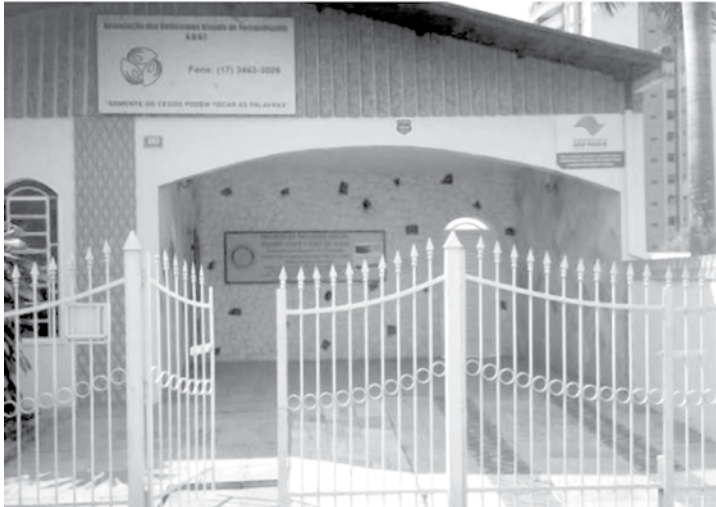
A Associação dos Deficientes Visuais de Fernandópolis está situada na Avenida Paulo Saravalli, nº 293, no Jardim Santa Helena

Além dos projetos de inclusão social, a ADVF oferece aos seus usuários diversas atividades, dentre elas, aulas de música, coral e instrumentos musicais; sala de informática com computadores que utilizam programas específicos e equipamentos adaptados; sala com uma professora/pedagoga, onde são aplicadas aulas de escrita e leitura braille, sorobá, apoio pedagógico para crianças, adolescentes e adultos que estão incluídos na rede regular de ensino (escola e faculdade); atividades de vida diária, aulas de orientação e mobilidade (uso da bengala) e trabalhos de inclusão.