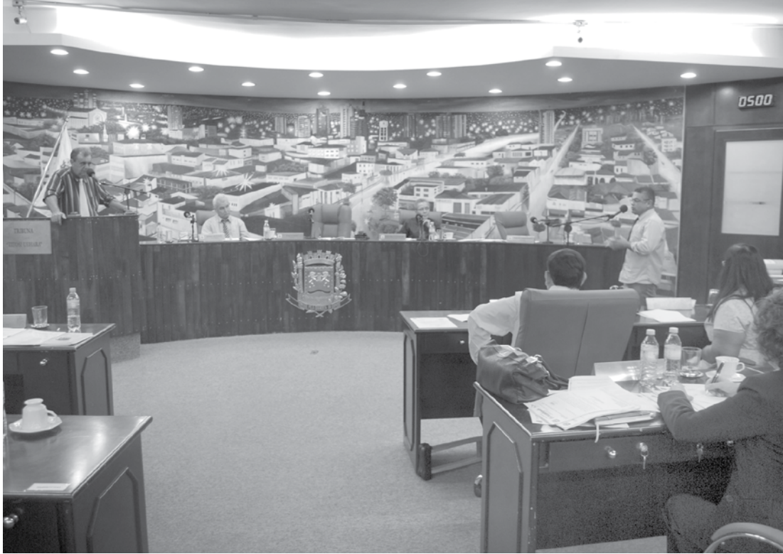
Entre os seis Projetos aprovados na sessão desta terça-feira na Câmara de Fernandópolis, três eram para a área da Saúde

pública municipal de ensino; Projeto de Lei nº 21/2017, de autoria do Executivo Municipal, dispõe sobre autorização para abertura de crédito adicional suplementar, por excesso de arrecadação, no valor de R$1,2 milhão destinado à Unidade de Pronto Atendimento - UPA; Projeto de Lei nº 24/2017 de autoria do Executivo Municipal, dispõe sobre autorização para abertura de crédito adicional suplementar, por superávit financeiro, no valor de R$ 2.567.858,73 destinado à Secretaria Municipal da Saúde;