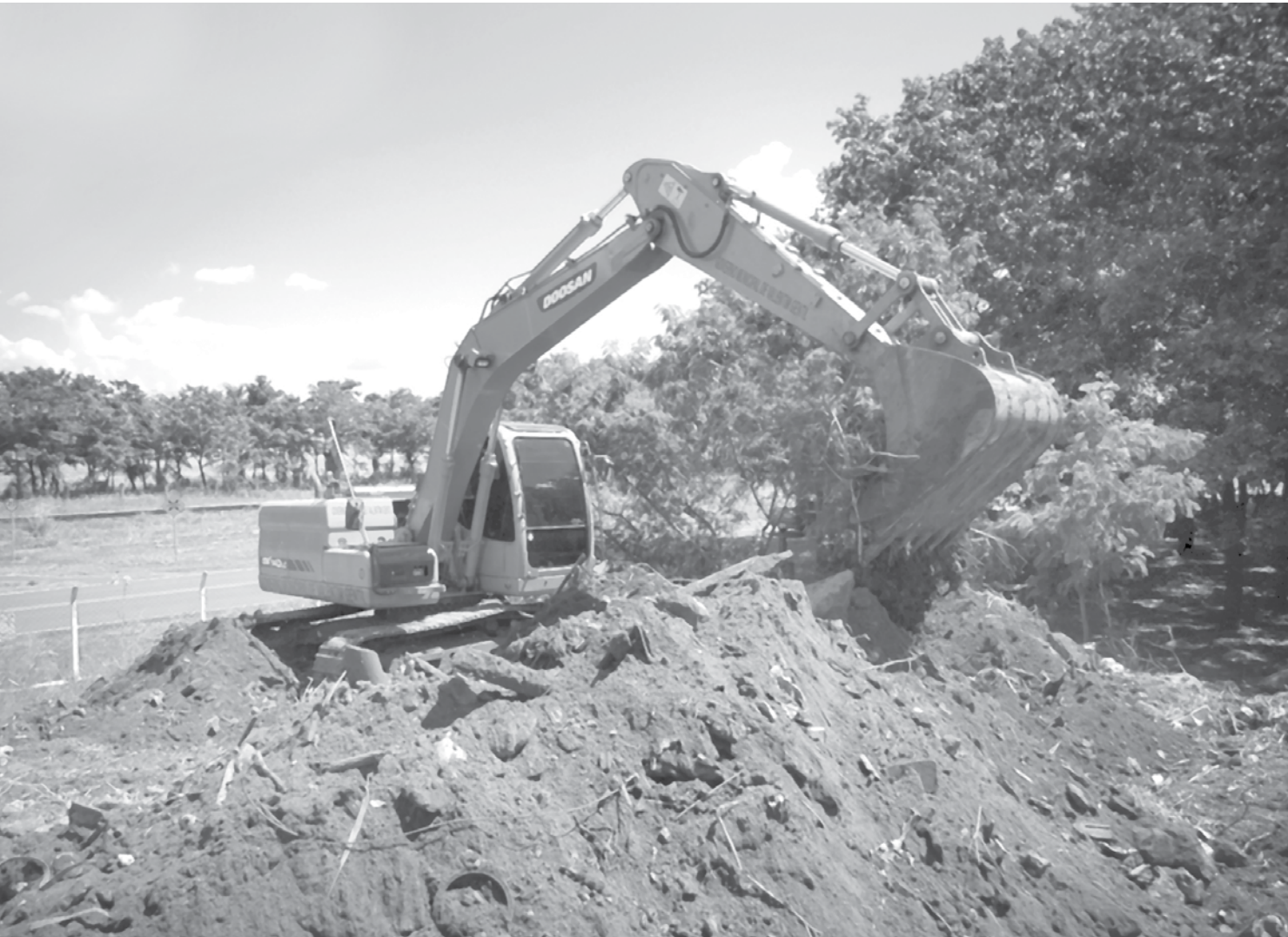
Município contratou equipamentos e equipe especializada que está concluindo os serviços no local

Município recebeu cerca de R$ 250 mil em multas nos últimos anos; valor seria suficiente para construir um Ecoponto para separação e reciclagem de lixo