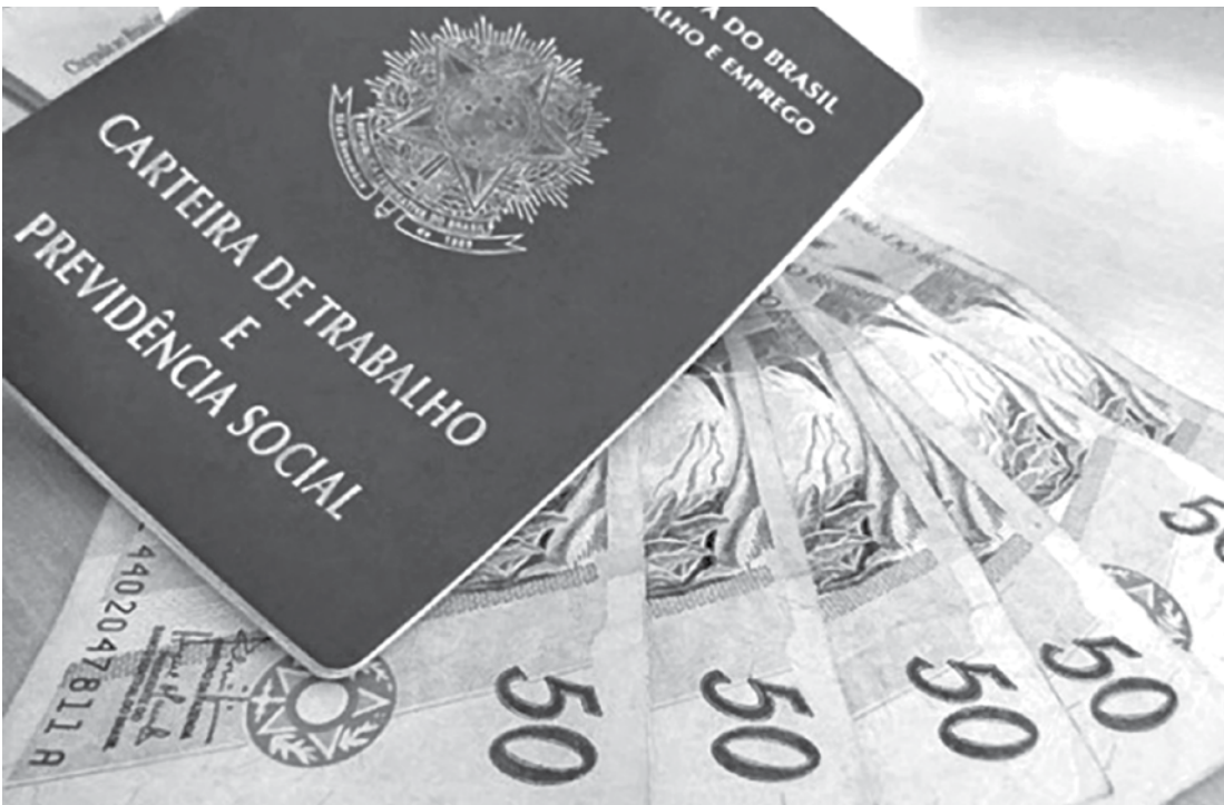
Caso o dinheiro não estiver na conta, trabalhador precisa cobrar a empresa

Caso o dinheiro não estiver na conta, o trabalhador precisa cobrar da empresa. Caso o antigo patrão não depositar, o caminho é buscar a Justiça. Mas atenção: só dá para recorrer até dois anos após o fim do contrato de trabalho. Depois disso, não tem mais jeito. O prazo para os saques na conta inativa do FGTS acaba em julho e a ação na Justiça pode demorar muito mais.