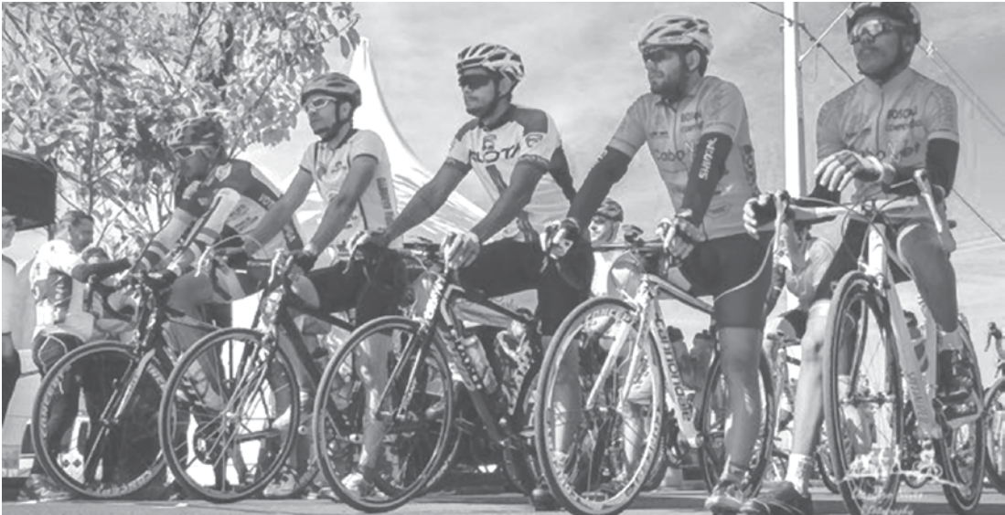
Cerca de 120 ciclistas de diversas cidades da região noroeste deverão participar da competição

premição em dinheiro para categoria Sênior A (30 a 39 anos), com R$ 150,00 para o 1º colocado; já para a categoria Elite Masc (23 a 29 anos) serão três premiações: R$ 150,00 para o primeiro colocado, R$ 100,00 para o segundo e R$ 100,00 para o terceiro classificado. A 2ª Etapa da Copa de Ciclismo é uma realização da Prefeitura de Fernandópolis, através da Secretaria Municipal