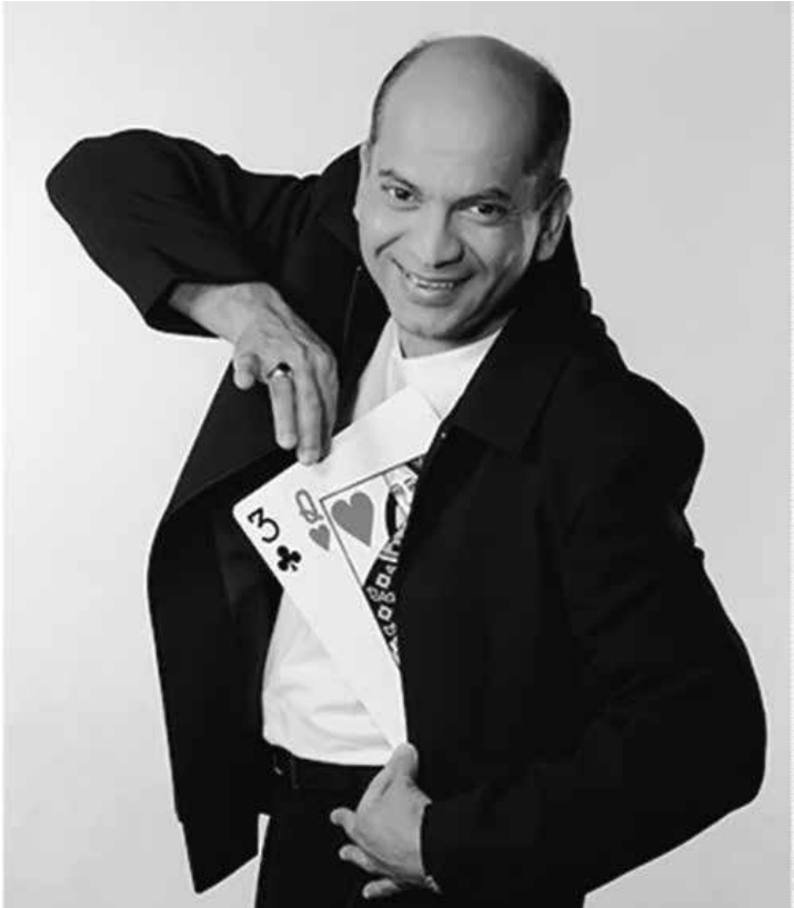
O projeto traz números clássicos de mágica e produções rápidas