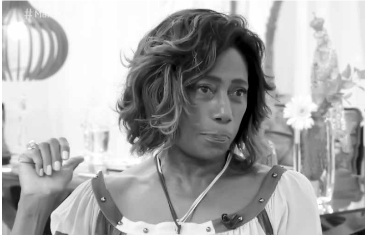
Jornalista preferiu não revelar a sua idade no programa “Mais Você”