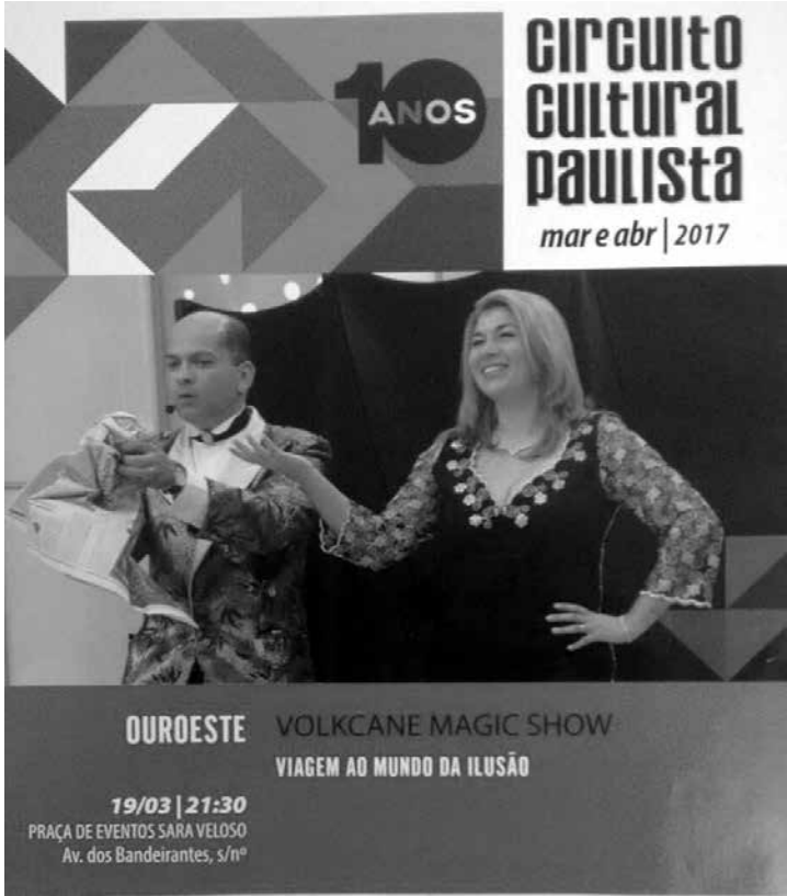
O espetáculo circense acontece no próximo domingo, dia 19, às 21h30, na Praça de Eventos

ral Paulista é uma parceria da Prefeitura de Ouroeste, APAA (Associação Paulista de Amigos da Arte) com a Secretaria de Estado da Cultura. No município, o circuito é organizado pela Secretaria de Educação e Cultura e pelo Museu Cultural e Arqueológico. Sobre a atração circense O projeto traz números clássicos de mágica e produções rápidas, como bengalas, lenços, cordas, entre outros. Na sequência, números falados e argumentados com a interação da plateia, momento em que o público participa ativamente dos números de ilusionismo. O show conta ainda com uma dose de bom humor. A arte milenar mágica aguçá os sentidos do público e ativa sua percepção. Este ano o Circuito Cultural Paulista comemora 10 anos de aplicação e existência.