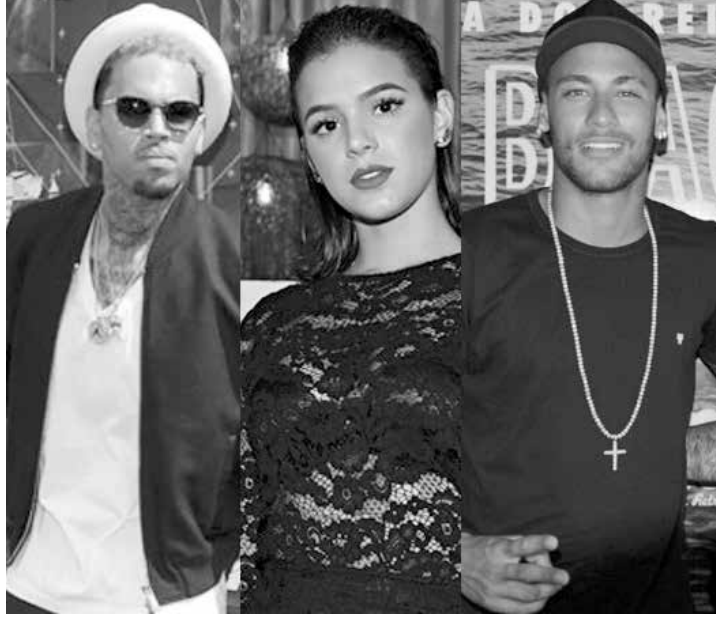
Jogador alfinetou Chris Brown no Instagram