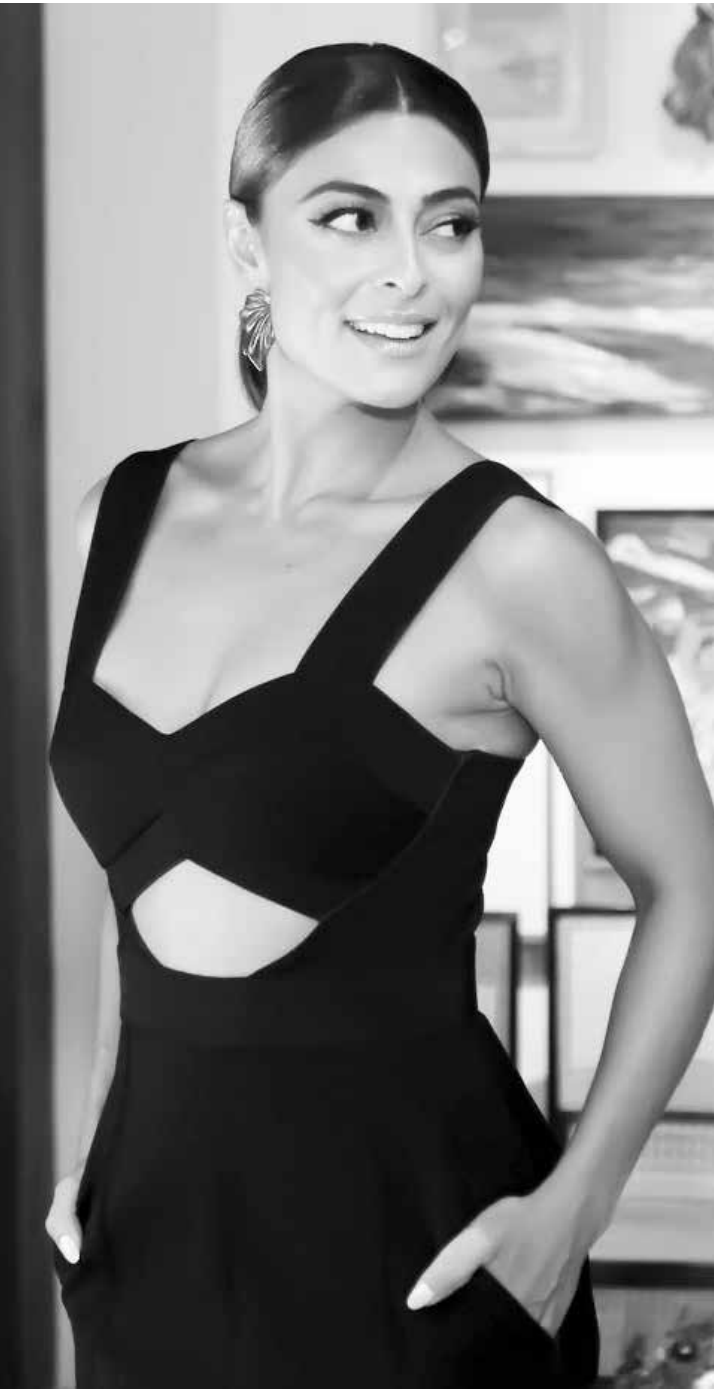
Atriz disse que cuidar da imagem ‘não é um fardo’.

Juliana Paes será Bibi Perigosa na nova novela das nove, “A Força do Querer”. Em conversa com a imprensa na coletiva da trama na terça-feira, 14, ela falou sobre beleza, a boa forma invejável e os looks estilosos que usa. A atriz contou que sente que se aprimorou com o tempo: “Me sinto tão mais preparada agora, tão mais capaz, e me sinto lidando com isso de uma maneira muito saudável. Acho que quando você envelhece diante dos olhos do público, na TV, precisa ter muito cuidado. A minha profissão tem essa demanda. Preciso cuidar do meu corpo, do meu rosto, isso está embutido na minha rotina e eu pretendo continuar assim. Me cuido, faço atividade física, passo creminho aqui e ali, mas acho que nunca farei grandes intervenções porque sou contra. Cada um tem que fazer o que faz feliz, mas para quem está na TV o cuidado tem que ser maior”.