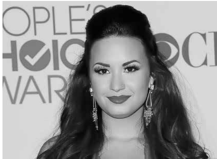
Fotos da cantora foram parar em sites pornográficos