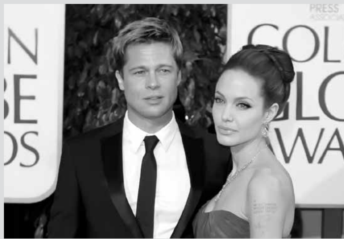
“É um investimento para a nossa família, para nossos filhos” disse Brad

Na apresentação comercial, o azeite Brad Pitt e Angelina Jolie é descrito como