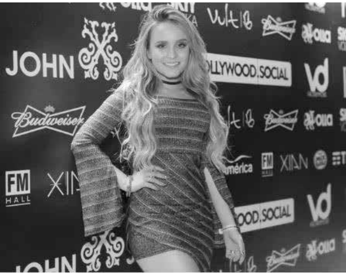
Larissa Manoela em festa no Centro do Rio