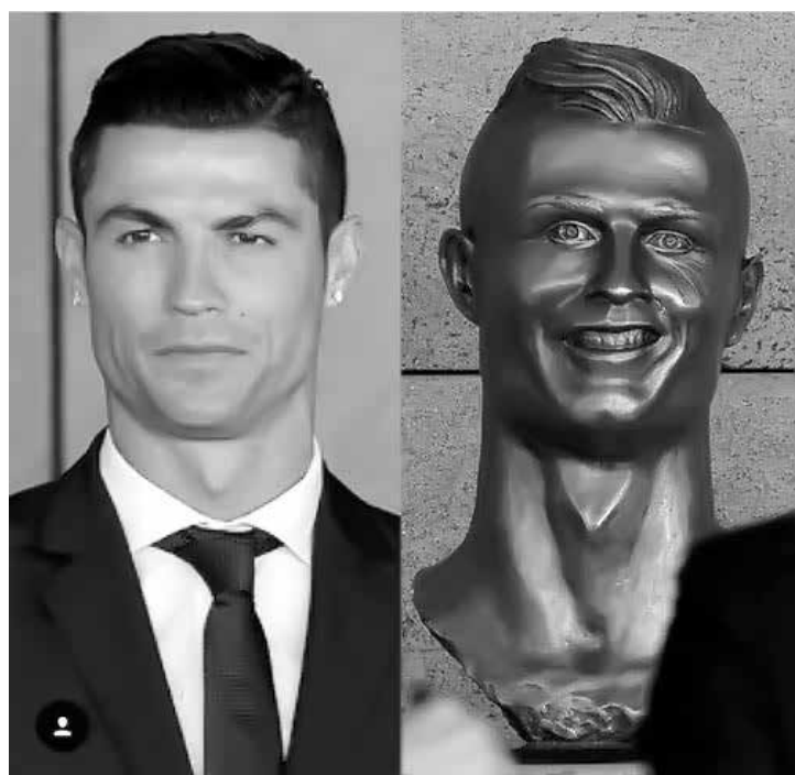
Escultor justifica: ‘Nem Jesus agradou a todos’