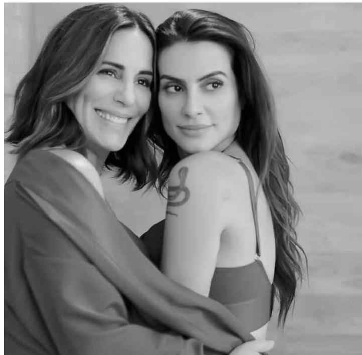
Mãe e filha demonstraram sensualidade durante ensaio

nha Shape and Shine, que prezam pela leveza, compressão e brilho acetinado do tecido. A marca também é conhecida por valorizar diferentes biótipos e respeitar as curvas. Por isso, realizar uma campanha com as duas atrizes, mãe e filha, significa mais que mostrar celebridades e sim valorizar as diferentes passagens da vida de uma mulher, que tem sua identidade transformada a partir do momento que seus filhos nascem e crescem.