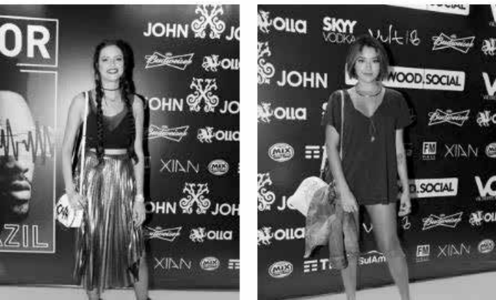
Participaram da festa diversas celebridades brasileiras