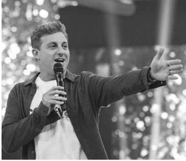
Internautas zombaram do apresentador

sa e chegou num preço. Mas tem que negociar, não dá pra falar: “Não vou pagar”. É como se eu dissesse: “Eu vou usar você, você faz a reportagem lá pra mim mas não vou te pagar, tá?”. Não é assim... A apresentadora lamenta que não esteja mais sendo vista por muitos telespectadores que a acompanharam por anos.