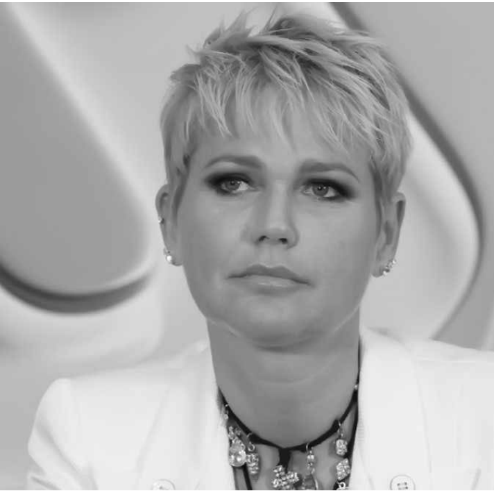
“Me dói muito dizer isso”

Xuxa desabafou com os fãs na noite de quarta-feira (29) e contou que está com dificuldades para manter a Fundação Xuxa Meneghel funcionando. A apresentadora disse que o instituto - que ajuda crianças e jovens carentes com atividades educativas - pode fechar após 27 anos. “O Brasil tá em crise e eu não tô conseguindo levar a FXM sozinha, dói muito mas é verdade, vai ser o último ano. Eu não quero, mas está difícil, crise, TV não é mais a mesma. Gasto 1.800.000,00 anualmente, é muito pesado, não dá”, disse ela, respondendo às perguntas de alguns seguidores. Os fãs sugeriram exposi-