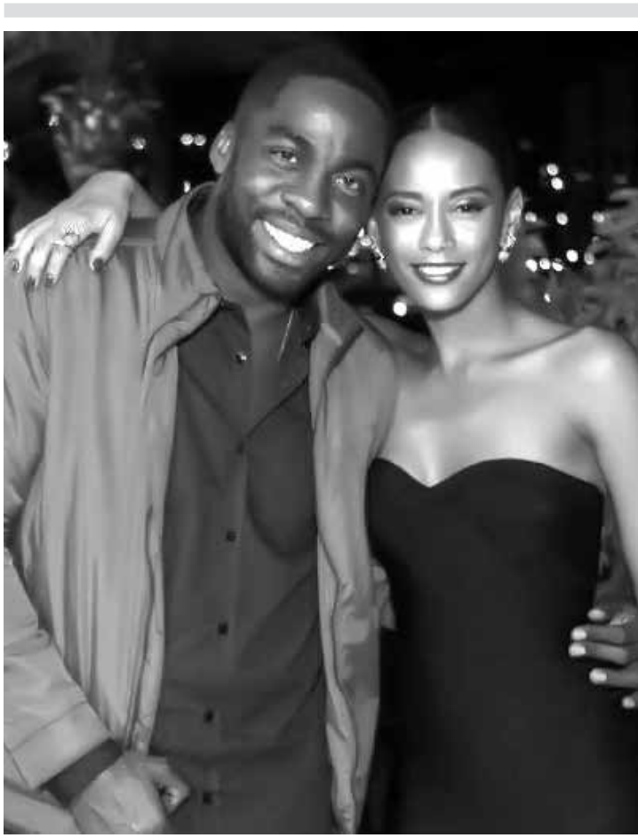
Casal pretende aumentar a família

ções, shows e eventos com renda revertida para a fundação, mas Xuxa pareceu desanimada com o apoio. “Já pensei em tanta coisa, você acha que eu quero? É que eu não posso fazer isso sozinha, tenho pouca gente que me ajuda.” A apresentadora lamentou o possível destino da instituição e disse estar cansada de ficar pedindo ajuda para todos. “É muita grana... xá pra lá, eu já desisti de pedir, é ruim, chato, cansativo... Entendo que as pessoas não podem [sic] ajudar, mas também não posso seguir sozinha com as despesas, entende? Mas foram 27 anos de muitas histórias lindas.”.