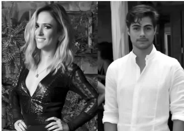
Os dois foram flagrados várias vezes juntos

pediu perdão pela sua atitude. “Errei e me arrependo. Minha atitude afetou a mulher mais importante pra mim. Eu e Dani estivemos sempre juntos. Ela é minha melhor amiga e o amor da minha vida. Nos amamos e vamos superar isso juntos e casados. Nada importa mais do que a nossa relação”. Adnet e Calabresa estavam juntos desde 2007, mas oficializaram a relação três anos mais tarde, no dia 15 de maio de 2010.