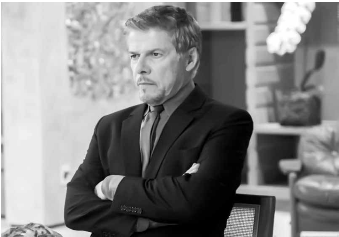
A Rede Globo está apurando o caso

um ambiente de harmonia e colaboração, de acordo com o Código de Ética e Conduta do Grupo Globo. Todas as questões são apuradas com rigor, ouvidos todos os envolvidos, em busca da verdade.” A Globo termina a nota dizendo ainda que “não comenta assuntos internos”. Em entrevista, Mayer afirmou que respeita muito as mulheres e pede que “não misturem ficção com realidade”. “As palavras e atitudes que me atribuíram são próprias do machismo e da misoginia do personagem Tião Bezerra de ‘A Lei do Amor’, não são minhas! Nesses 49 anos trabalhando como ator sempre busquei e encontrei respeito e confiança em todos que trabalham comigo.”