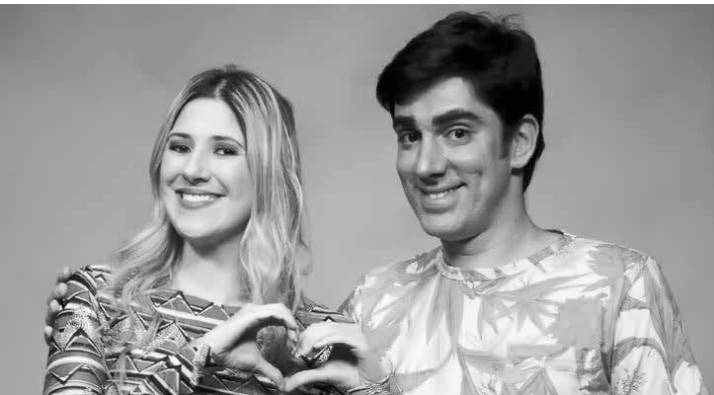
Casal estava junto desde 2007

Chegou ao fim o casamento de seis anos de Marcelo Adnet e Dani Calabresa. A notícia foi divulgada pelo colunista Ancelmo Gois. Eles teriam deixado de dividir o mesmo teto, mas garantiram que “o carinho, a amizade e a parceria” continuam. Os rumores de uma possível crise começaram quando os dois passaram o Réveillon separados. Em 2014, Adnet foi flagrado trocando beijos com uma moça. Nas redes sociais, ele