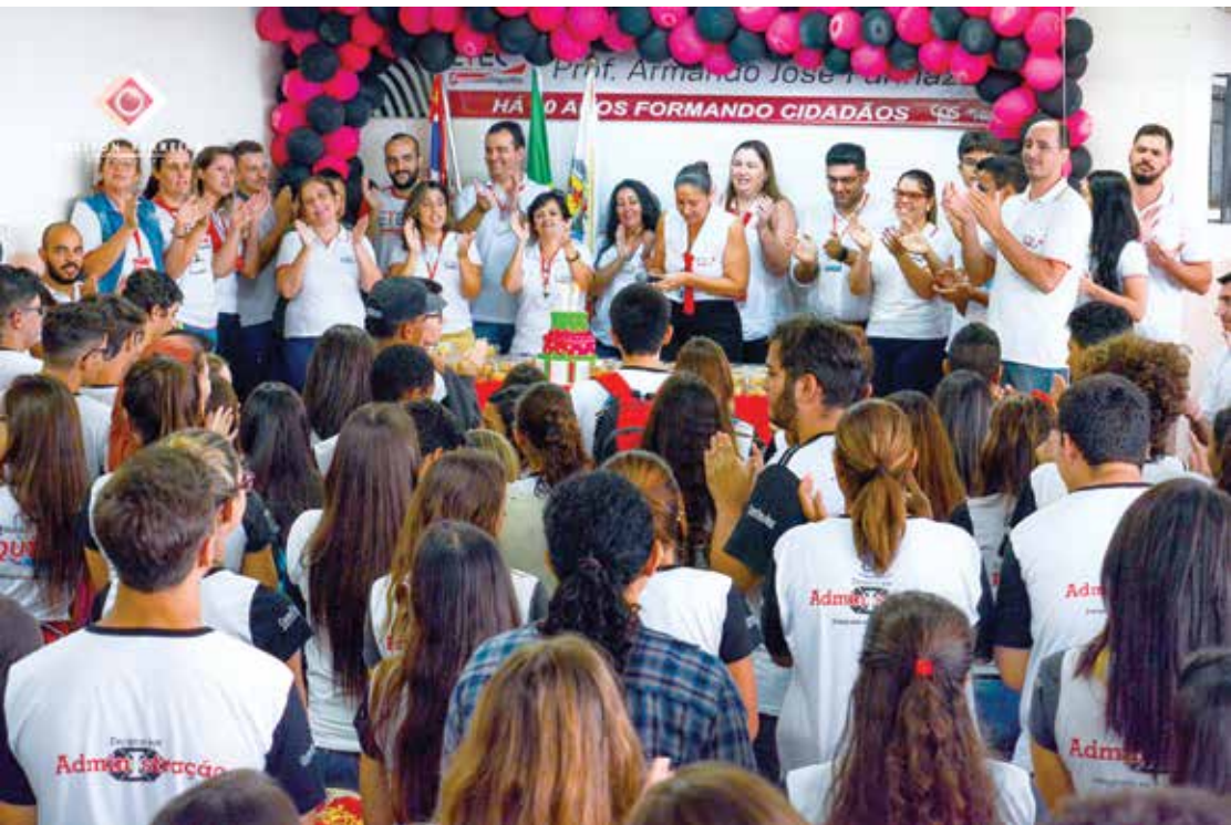
Estudantes do Ensino Médio durante as provas da gincana realizada na última sexta-feira