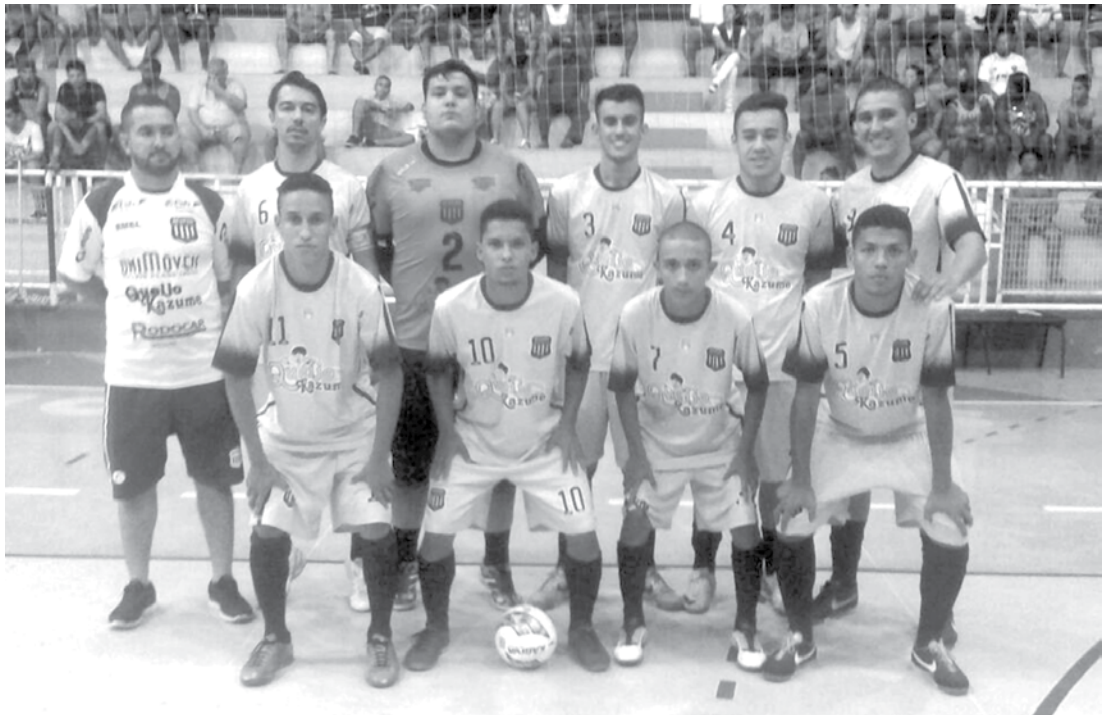
O time de Fernandópolis foi classificado em segundo lugar para a próxima etapa