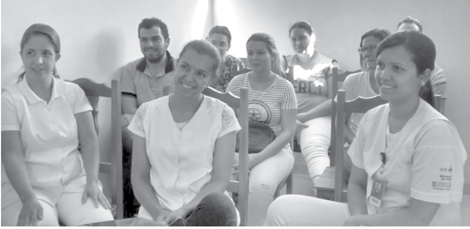
Capacitação foi realizada na própria unidade de atendimento