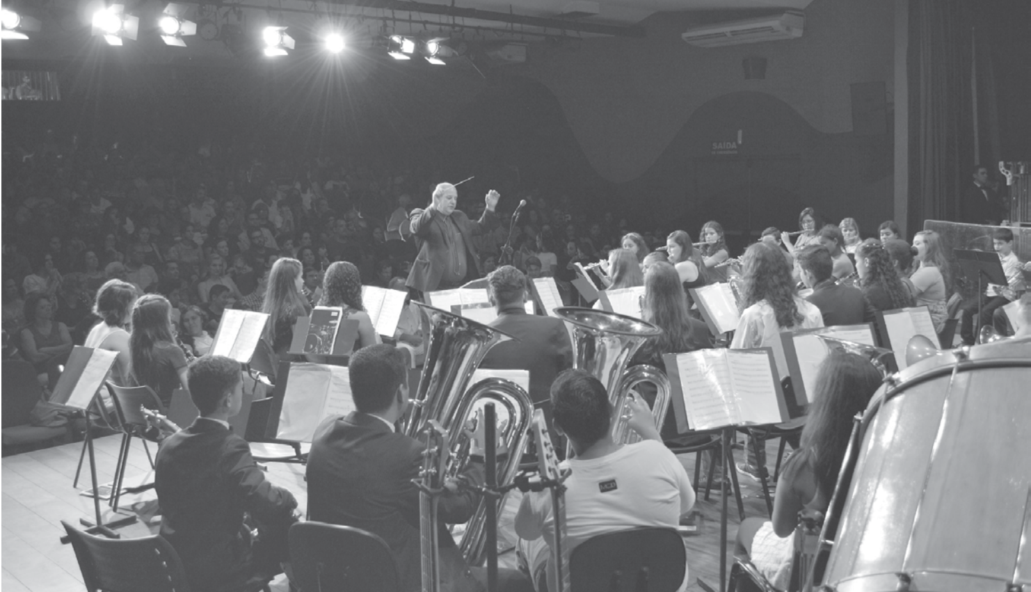
Osfer, grupo que integra a Corporação Musical de Fernandópolis, está engajada em prol de entidade mantida pelo Frei Francisco; apresentação contará com muita música caipira

tas outras”, antecipou Thito. A Corporação Municipal de Fernandópolis é mantida pela Prefeitura, por meio da Secretaria Municipal da Cultura. Os ensaios são na Avenida Rosalvo Aderaldo, nº 768, Jardim Esplanada, em frente à Escola Estadual Afonso Cáfaró. SOBRE A FESTA DO MILHO Realizada pela Associação e Fraternidade São Francisco de Assis na Providência de Deus, a Festa do Milho Verde é um evento em que a solidariedade é o ponto alto. O trabalho de mais de 2 mil voluntários e a presença marcante de um público de mais de 100 mil pessoas nos dois domingos de festa (2 e 9 de abril) conquistam uma grande ajuda à instituição que trabalha dia e noite em prol da vida. A festa é um dos maiores eventos gastronômicos da região de São José do Rio Preto e integra o calendário oficial da