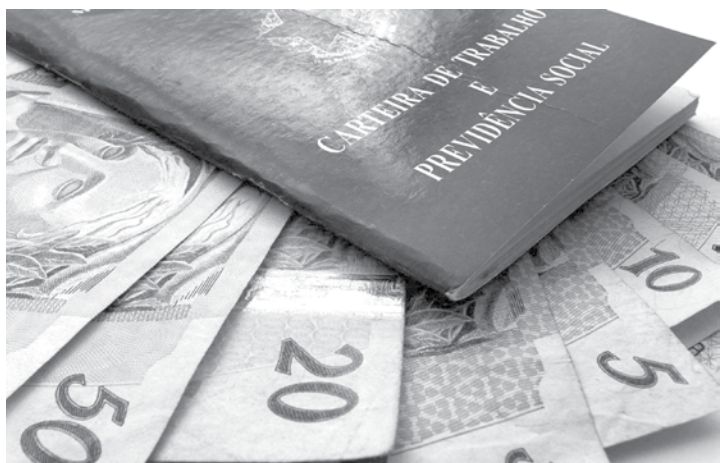
Para valores a partir de R$ 10 mil, a Caixa exige a carteira de trabalho e a liberação do dinheiro leva um dia para ocorrer

estará disponível no site do banco ainda hoje (www.caixa.gov.br). Também está prevista a abertura antecipada em duas horas das agências da Caixa entre a próxima segunda (10) e quarta-feira (12) para pagamento exclusivo de contas inativas do FGTS. O diretor executivo de Fundos de Governo da Caixa, Valter Nunes, lembrou que no sábado não é possível transferir para outro banco por meio de Transferência Eletrônica Disponível (TED), mas os clientes poderão enviar o dinheiro por DOC (Documento de Crédito), limitado ao valor de até R$ 4.999,99, com liberação do dinheiro na terça-feira e isenção de tarifas. Para valores a partir de R$ 10 mil, a Caixa exige a carteira de trabalho e a liberação do dinheiro leva um dia para ocorrer. DIFICULDADES PARA SACAR O presidente da Caixa disse que um dos principais problemas apresentados pelos trabalhadores para o saque na primeira fase foi a falta de informação sobre a data da demissão. Ele lembrou que nesses casos as empresas têm que informar à Caixa que houve a demissão e o motivo. Quando isso não acontece, o trabalhador deve levar à Cai-