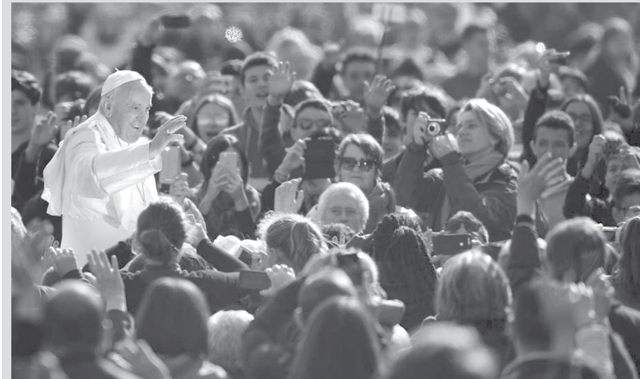
Papa Francisco acena para a multidão enquanto chega para a audiência geral semanal na Praça de São Pedro, no Vaticano.