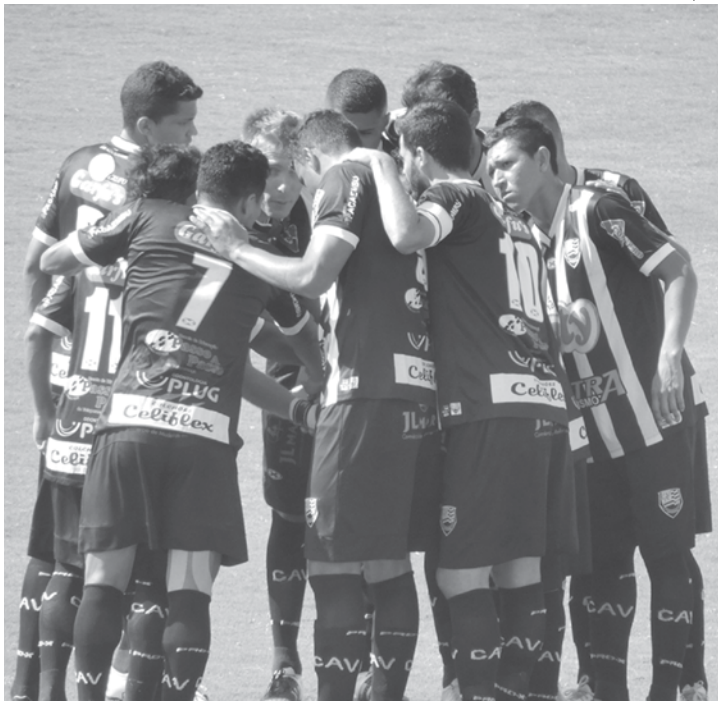
Votuporanguense enfrenta o Bragantino fora de casa na última rodada

DERROTA PARA O BRAGANTINO Perdendo para o Massa