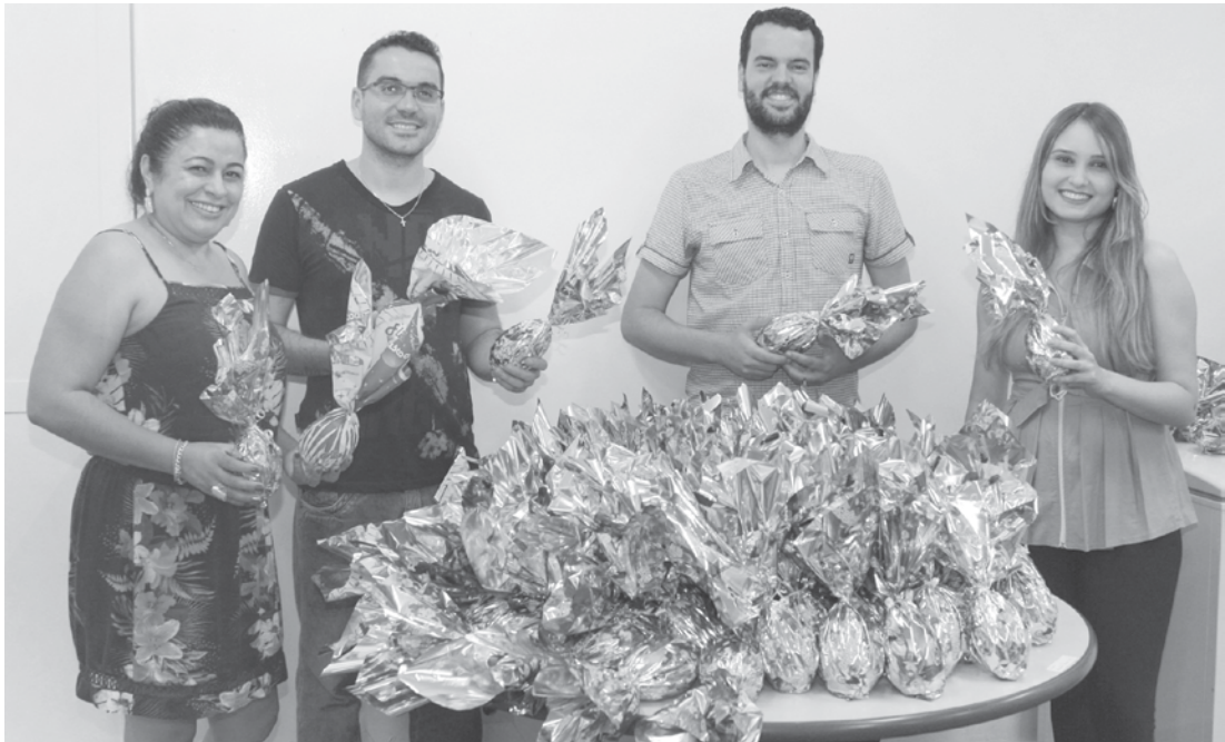
A produção dos ovos de páscoa ocorreu nos laboratórios específicos do curso de Engenharia de Alimentos