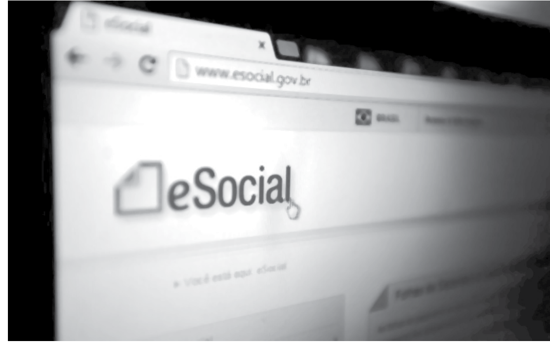
Situação vai servir para as micro e pequenas empresas e o MEI, além do pequeno produtor rural

Para ter acesso ao novo eSocial, é possível encontrar a plataforma em: www.esocial.gov.br ou www.caixa.gov.br , nesta última, entrando na indicação “download”.