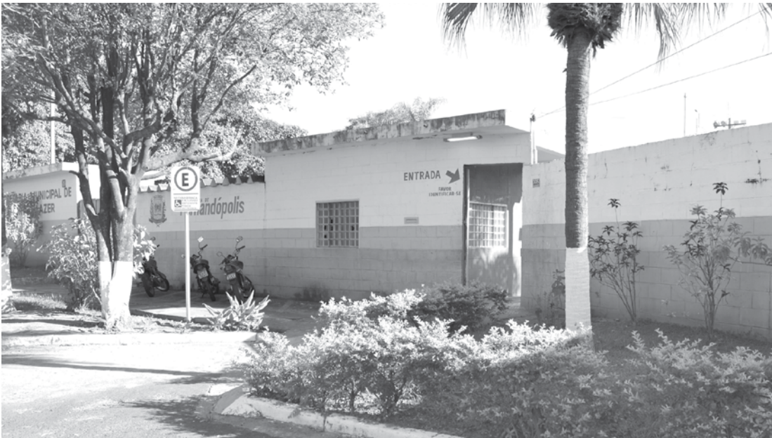
Na Secretaria Municipal de Esportes e Lazer, na Rua Kazuyoshi Beppu, nº 305, Bairro Morada do Sol (Antigo Clube da Cesp)

deficiência, estimula a convivência social, a formação de gestores e lideranças comunitárias, favorece a pesquisa e a socialização do conhecimento, contribuindo para que o esporte e lazer sejam tratados como políticas e direitos de todos. Os núcleos esportivos funcionarão no Ginásio de Esportes Dr. Quer-ton Ribamar Prado de Souza (Beira Rio); CAEFA (Centro de Apoio à Educação e Formação do Adolescente); Jardim Santa Bárbara; Secretaria Municipal de Esportes (antigo Clube da Cesp); e na área de lazer do Bairro Bernardo Pessuto, que também atende moradores do Bairro Ana Luiza.