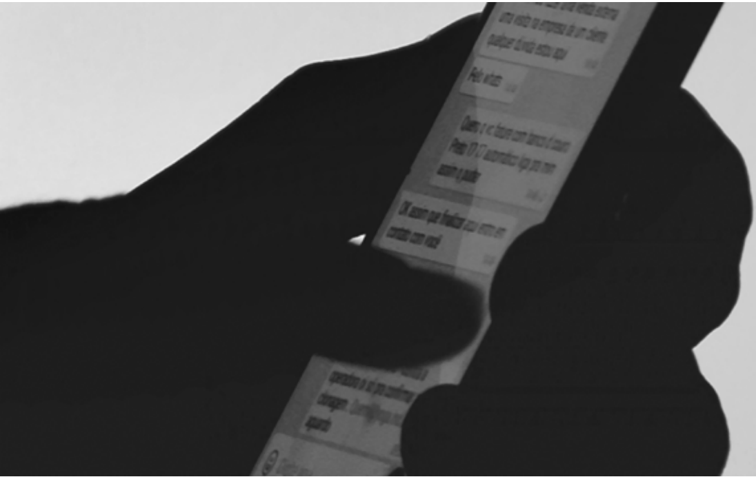
Aplicativo dá condição para dificultar a clonagem do número

combustíveis próximo à rodoviária de Fernandópolis. Ele foi preso em flagrante por tentativa de homicídio e encaminhado para a cadeia de Guarani D'Oeste. Já a vítima foi socorrida pelo Samu (Serviço de Atendimento Móvel de Urgência) e levada para atendimento médico no pronto-socorro.