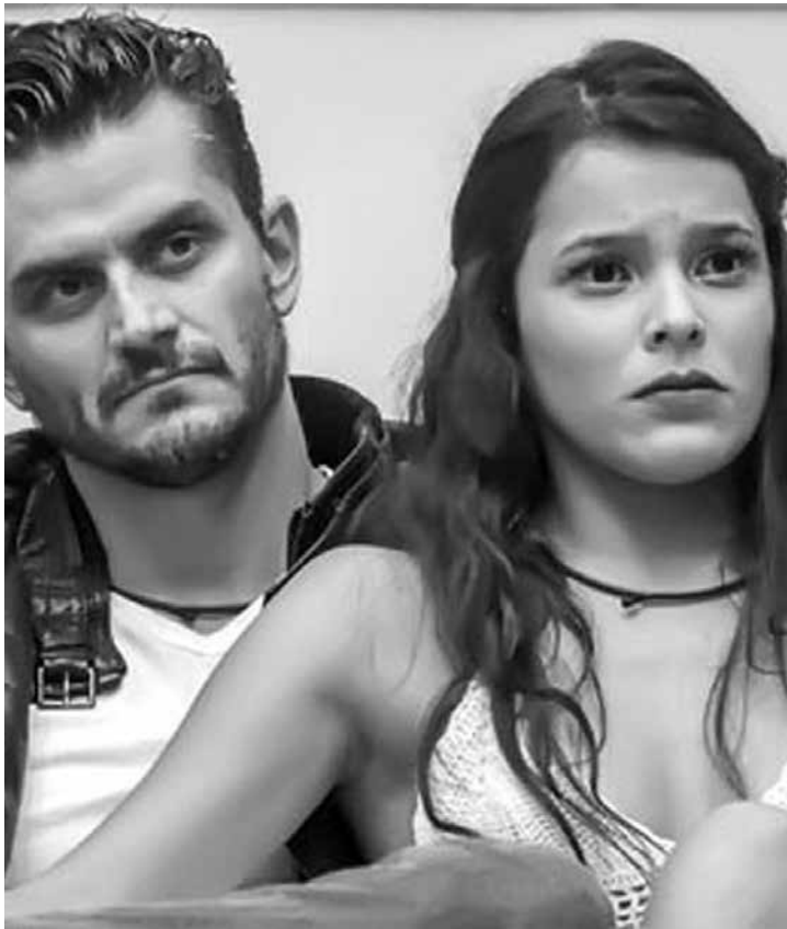
Pena pode chegar a três anos, disse delegada do caso