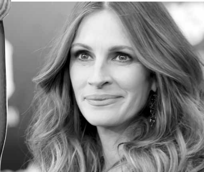
“Estou muito lisonjeada”, disse a atriz

Julia Roberts foi eleita pela revista “People” a mulher mais bonita do mundo de 2017. “Estou muito lisonjeada”, disse a atriz, que estampa a capa da nova edição da revista. Ela brincou por estar à frente de George Clooney, que ganhou como homem mais sexy por duas vezes: “Eu vou mencionar isso no meu cartão de Natal para a família Clooney neste ano”. Julia Roberts ganhou o título após 26 anos desde a primeira vez em que foi escolhida pela publicação a mulher mais linda do mundo. Esta é a quinta vez que ela é homenageada na categoria. Em entrevista à “People”, a atriz dis-