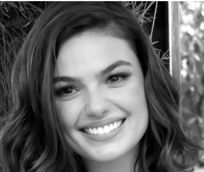
Atriz negou ter lentes de contato nos dentes

Protagonista de “A força do querer”, Isis Valverde negou o uso de lente de contato para os dentes. “São meus mesmos, nasci assim. Obrigada”, escreveu a atriz em seu Instagram ao compartilhar uma matéria que dizia que ela e Juliana Paes eram adeptas do procedimento, que deixa o sorriso mais branco e os dentes perfeitos.