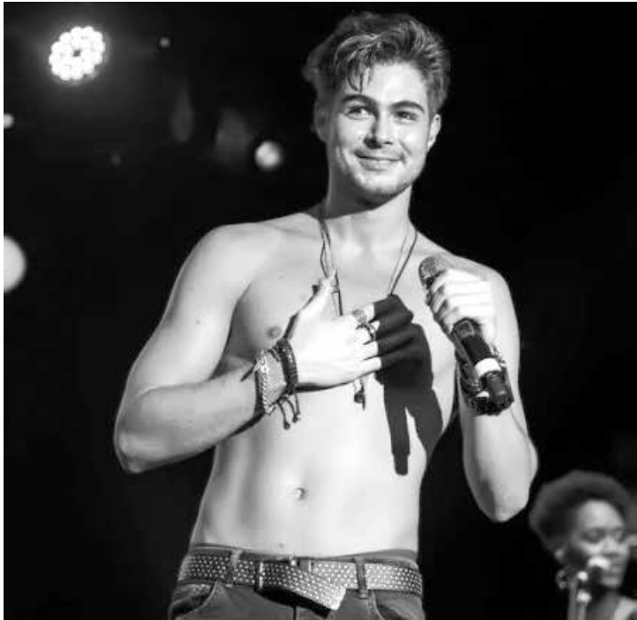
Rafael Vitti descarta namoro com Tatá Werneck

Tudo que Rafael Vitti faz gera curiosidade e interesse dos fãs. De postagens em redes sociais, passando por passeios em público, supostos namoros... Companhia frequente da atriz Tatá Werneck, ele lamentou que os dois não sejam namorados.