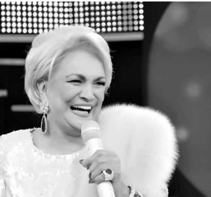
Apresentadora morreu aos 83 anos vítima de câncer

chegou ao meu pé de ouvido e disse, aconselha esse ser a a ser melhor. O nome disso que você citou aí é vaidade, graças a Deus eu me sustento para e tenho como pagar as minhas vaidades e você rs fica só me admirando do oculto porque a raiva que você sente de não ser metade de mim não deixa seu instinto de fã falar mais alto. Eu sei que você me ama”, escreveu.