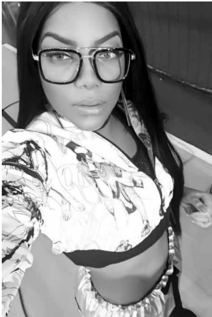
Visual de Ludmilla provoca críticas e cantora responde

Um tempo atrás, ele me contou que eu estava no aeroporto e o paquerei. Eu lembrava daquele cara, ele tem presença, né? Mas olhei tão rápido, não fico secando, acho horrível. Daí, no aniversário de uma amiga, uma outra nos apresentou: “Esse é meu primo”. Fiquei muda! (risos). Depois, eu vi que ele estava me olhando, e pronto, foi! Mas eu nunca cheguei em ninguém, tenho vergonha, não me sinto confortável em levar um fora. Prefiro induzir a pessoa a vir até mim, me sinto mais segura. Fiquei na minha, como sempre, e ele chegou (risos)”, disse.