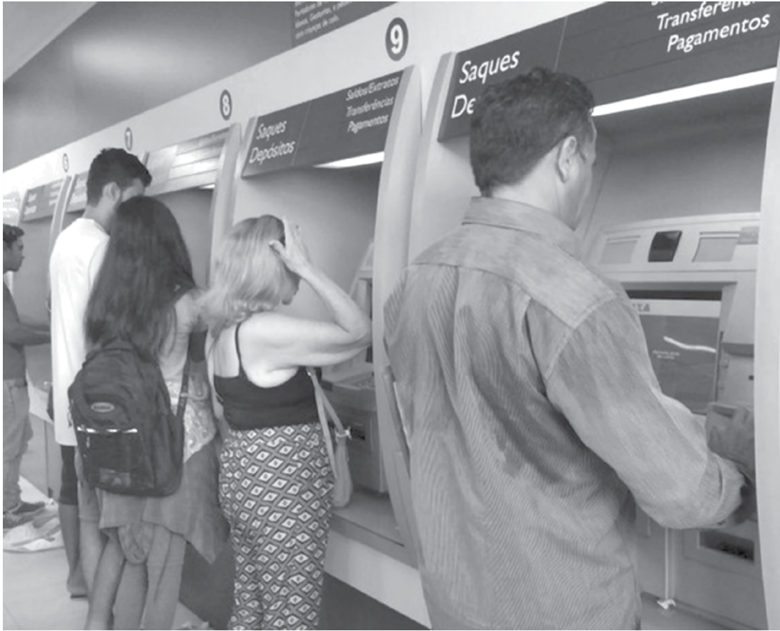
Segundo a Caixa, as pessoas que não conseguem fazer a retirada do dinheiro dentro do seu mês do calendário e nem até 31 de julho não conseguirão fazer o saque em outra data

Essas dificuldades aparecem no balanço do Reclame Aqui, que mostra crescimento no número de reclamações contra a Caixa Econômica Federal desde o anúncio da liberação do saque das contas inativas, no final do ano passado. Durante o ano passado, o total de reclamações envolvendo o FGTS foi de 920. E neste ano já são 642 até o dia 9 de abril, ou seja, 70% do total de 2016 já foi atingido nos primeiros três meses do ano.