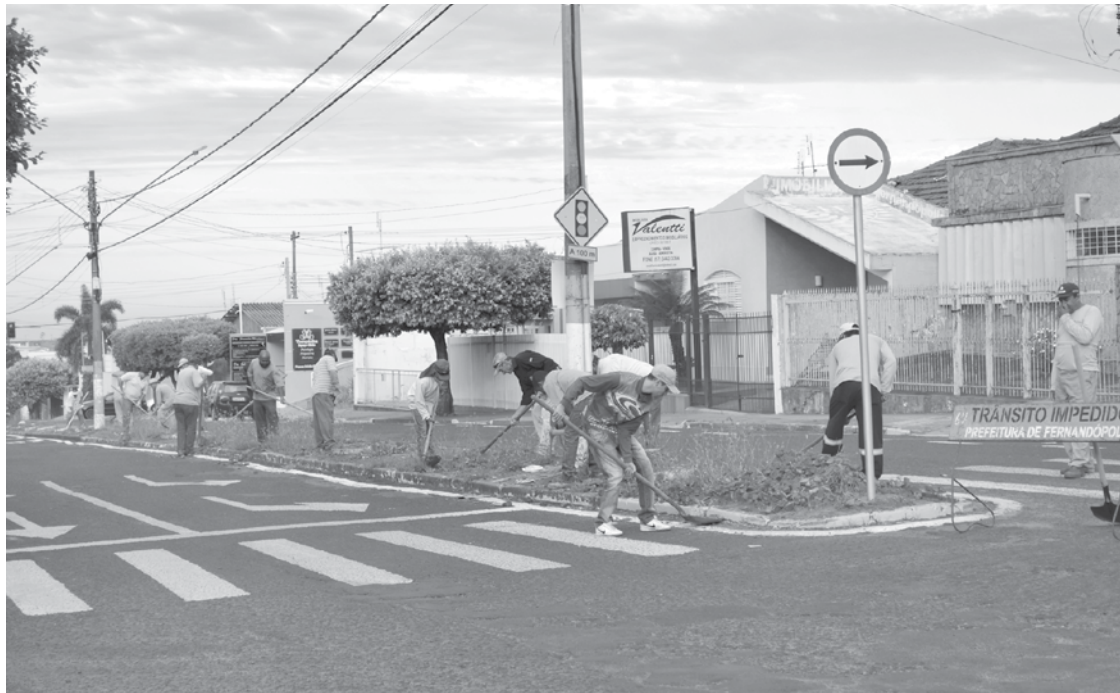
Trabalhadores fazem mutirão nas obras de revitalização dos canteiros da avenida