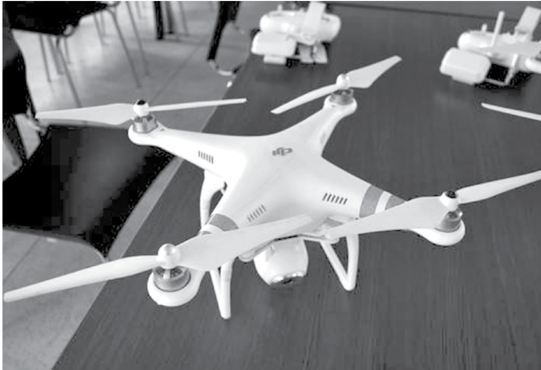
Texto considera o nível de complexidade e de risco das operações

→ Da REDAÇÃO contato@oextra.net A Agência Nacional de Aviação Civil (Anac) aprovou, nesta semana, um regulamento especial para utilização de aeronaves não tripuladas, os drones. O texto foi elaborado levando-se em conta o nível de complexidade e de risco envolvido nas operações e nos tipos de equipamentos. O objetivo do regulamento é tornar viáveis as operações desses equipamentos e preservar a segurança das pessoas. Pela regra geral, os drones com mais de 250g só poderão voar em áreas distantes de terceiros (no mínimo 30m horizontais), sob total responsabilidade do piloto operador e conforme regras de utilização do espaço aéreo do Departamento de Controle do Espaço Aéreo (Decea). Caso exista uma barreira de proteção entre o equipamento e as pessoas, a distância especificada não precisa ser observada. Já para voar com drones com mais de 250g perto de pessoas, é necessário que elas concordem previamente com a operação, ou seja, a pessoa precisa saber e concordar com o voo daquele equipamento