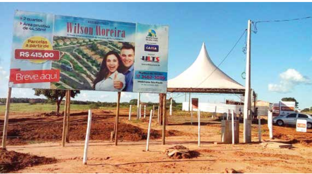
Quem passa pelo local já pode presenciar a área cercada e o ritmo acelerado das máquinas e construtores trabalhando para a entrega da 1ª etapa, prevista para maio de 2018

As casas terão o valor de R$ 99.900,00, financiado. É possível utilizar o FGTS na negociação e financiar o imóvel em até 360 meses, com parcelas a partir de R$ 415,00. Além disso, aqueles que fecharem contrato ga-