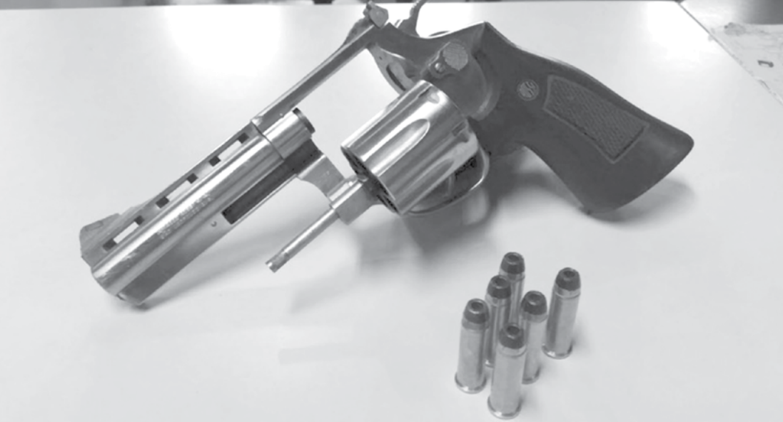
Armas em que o número de série tenha sido suprimido ou adulterado deverão ser remarcadas

gurança Pública (Senasp/MJSP). Segundo o texto, o órgão de segurança pública responsável pela apreensão do armamento deverá manifestar à Senasp o interesse pela doação das armas apreendidas, da data de apreensão até dez dias após o envio das armas pelo