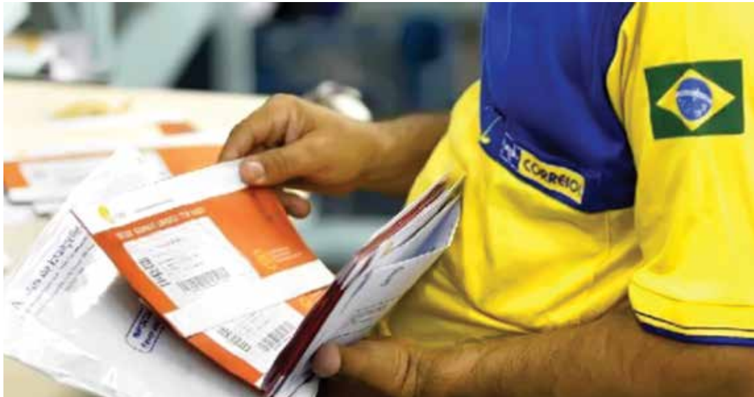
Em Fernandópolis, a greve está sendo sentida em relação à entrega de correspondências, de responsabilidade dos carteiros. A agência está com o expediente normal

Foi realizada anteontem, no final da tarde, uma assembleia que decidiria ou não pela retomada dos trabalhadores dos Correios. No encontro, a categoria