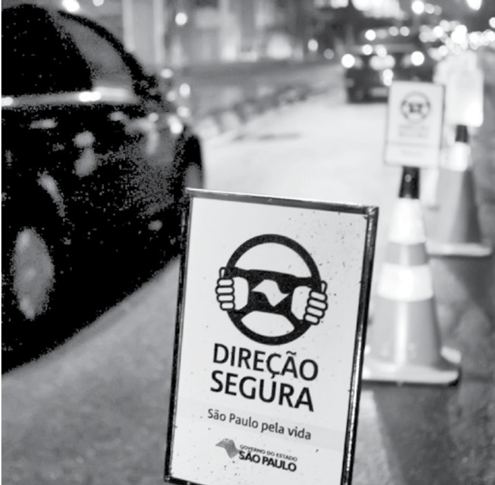
Oito condutores foram autuados por embriaguez ao volante e terão de pagar multa no valor de R$ 2.934,70

Lançado no Carnaval de 2013, o Programa Direção Segura integra equipes do Detran.SP, das polícias Militar, Civil e Técnico-Científica. Pela Lei Seca (lei 12.760/2012), todos os motoristas flagrados em fiscalizações têm direito a ampla defesa, até que a Carteira Nacional de Habilitação (CNH) seja efetivamente suspensa. Se o condutor voltar a cometer a mesma infração dentro de 12 meses, o valor da multa será dobrado.