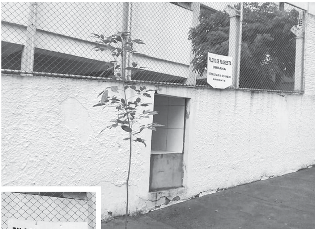
Calçamento da escola começa a ser revitalizado com a implantação de mudas

Para a implantação do projeto é imprescindível adotar estratégias ambientalmente seguras e qualitativas, especialmente voltadas à qualidade de vida do município, e assim, favorecer o planejamento, avaliando o padrão e a forma urbana e atendendo as premissas estabeleci-