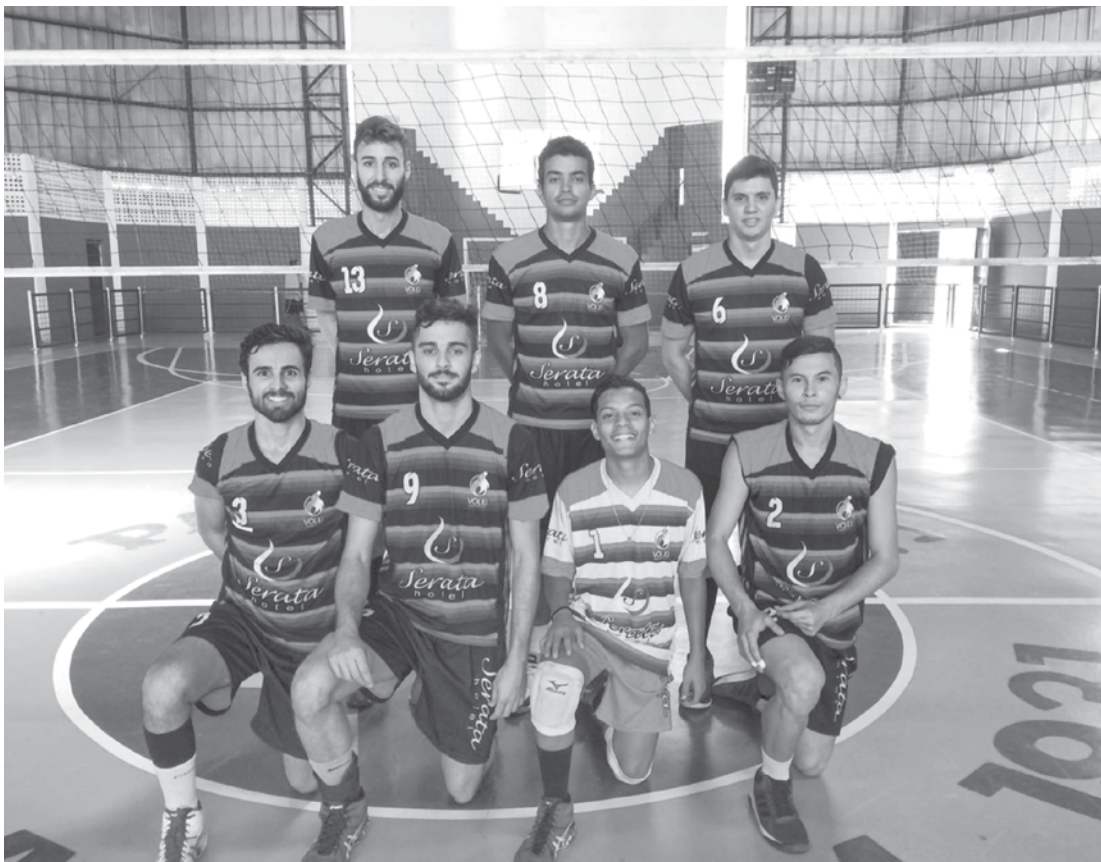
Fernandópolis venceu Monte Aprazível por 2 a 0

“Depois da disputa contra Jales conseguimos melhorar bastante nosso entrosamen-