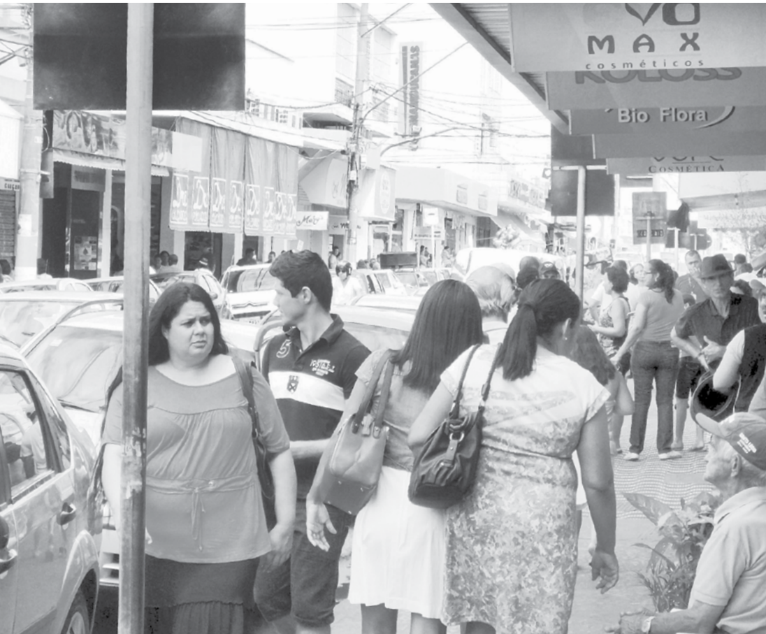
As pessoas ainda estão pesquisando. O movimento no comércio de Fernandópolis deve melhorar dois dias antes do Dia das Mães

Apesar da grande movimentação no centro de Fernandópolis, lojistas ainda esperam os “filhos mais atrasados”