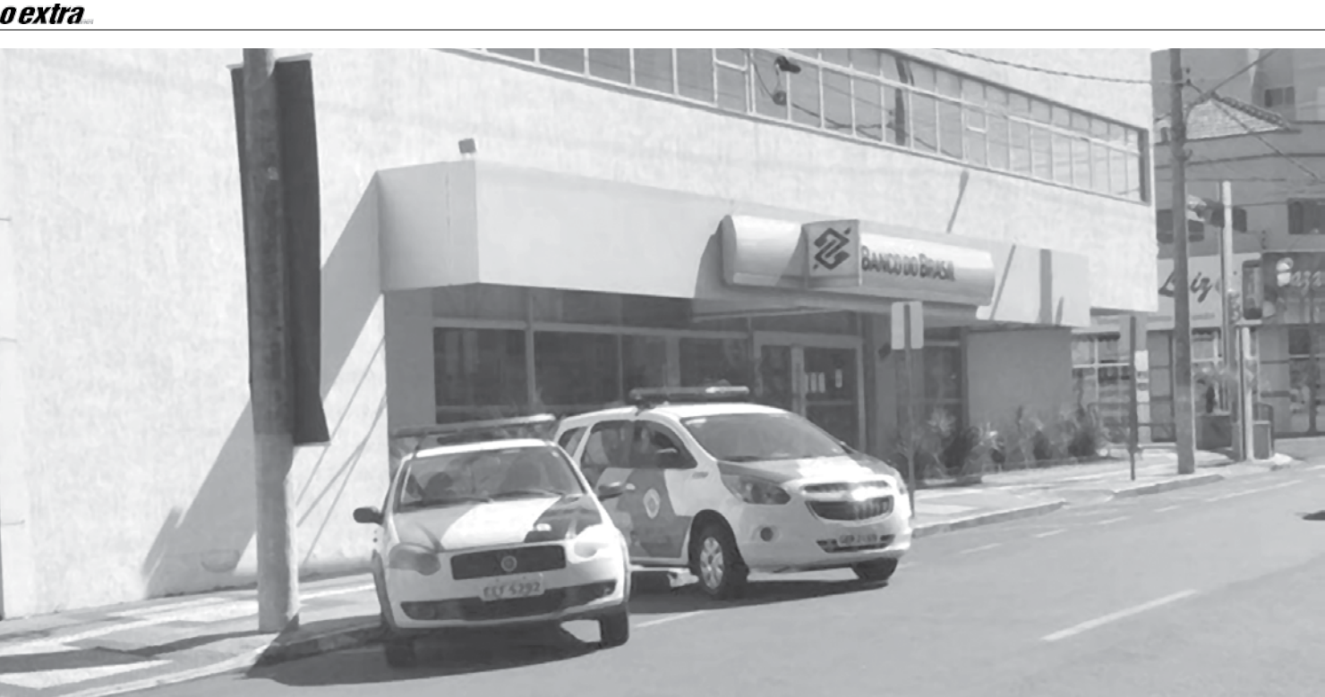
Ladrões arrombam cofre de agência bancária em Santa Fé do Sul