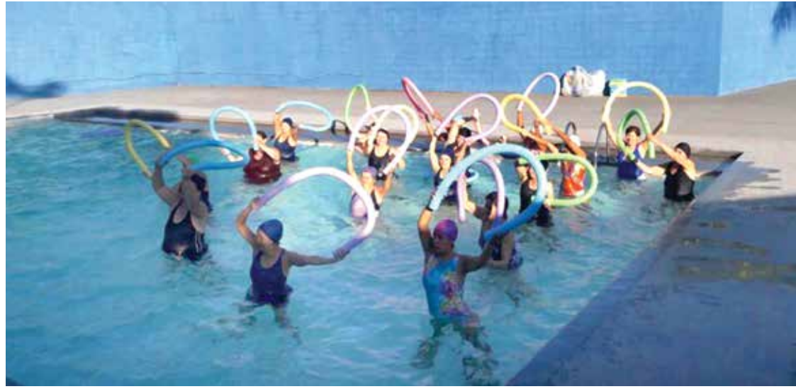
Com cerca de 68 mil habitantes, município tem hoje diversas atividades voltadas a garantir a qualidade de vida do idoso