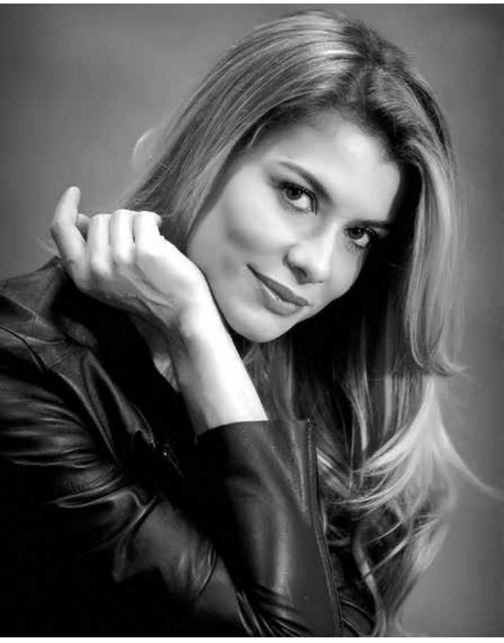
Atriz revela que já sofreu por amor e é amiga dos seus ex

No jogo da vida, vence quem sabe perder. Essa lição Alinne Moraes conhece de cor, diferentemente de Diana, sua personagem em “Rock story”, que ainda não aprendeu a arte de sorrir cada vez que o mundo lhe diz “não”.