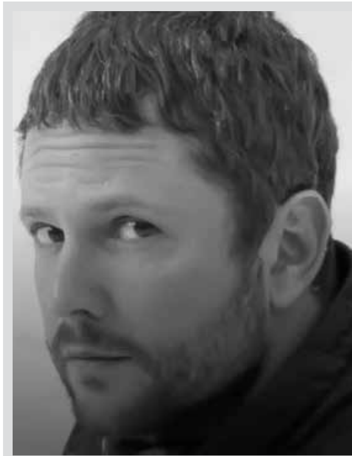
Série “O mecanismo”, foi criada pelo mesmo diretor de “Tropa de elite”

Já com Gustavo Lima, a cantora paraense agradeceu a presença dele, dizendo que o artista foi o primeiro a dar uma oportunidade a ela de cantar junto. Gaiato, Gustavo, que é vizinho da anfitriã, brincou: “Pula o portão e vai lá em casa tomar um café”.