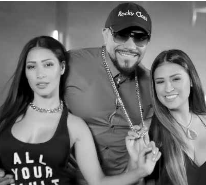
“Minha mulher não sente ciúmes”

Naldo gravou nesta terça-feira, em Goiânia, o clipe de “Embaçar o Vidro”, no qual recebe a dupla Simone & Simaria. Em clima sensual, o cantor não só trocou carícias com as coleguinhas como “embaçou o vidro” com uma modelo contratada para a gravação.