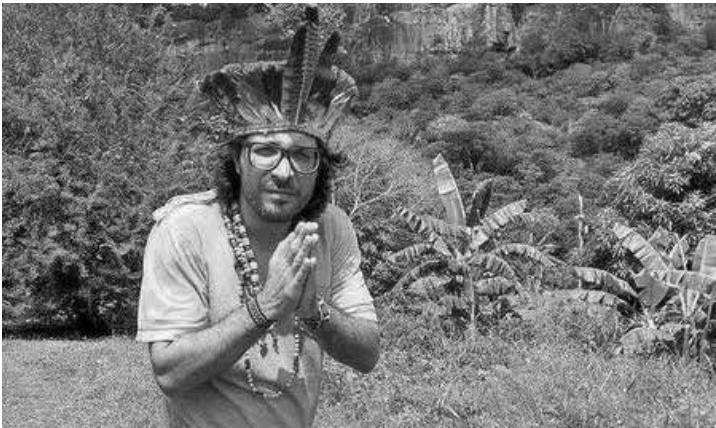
Fotos serão feitas em duas tribos indígenas