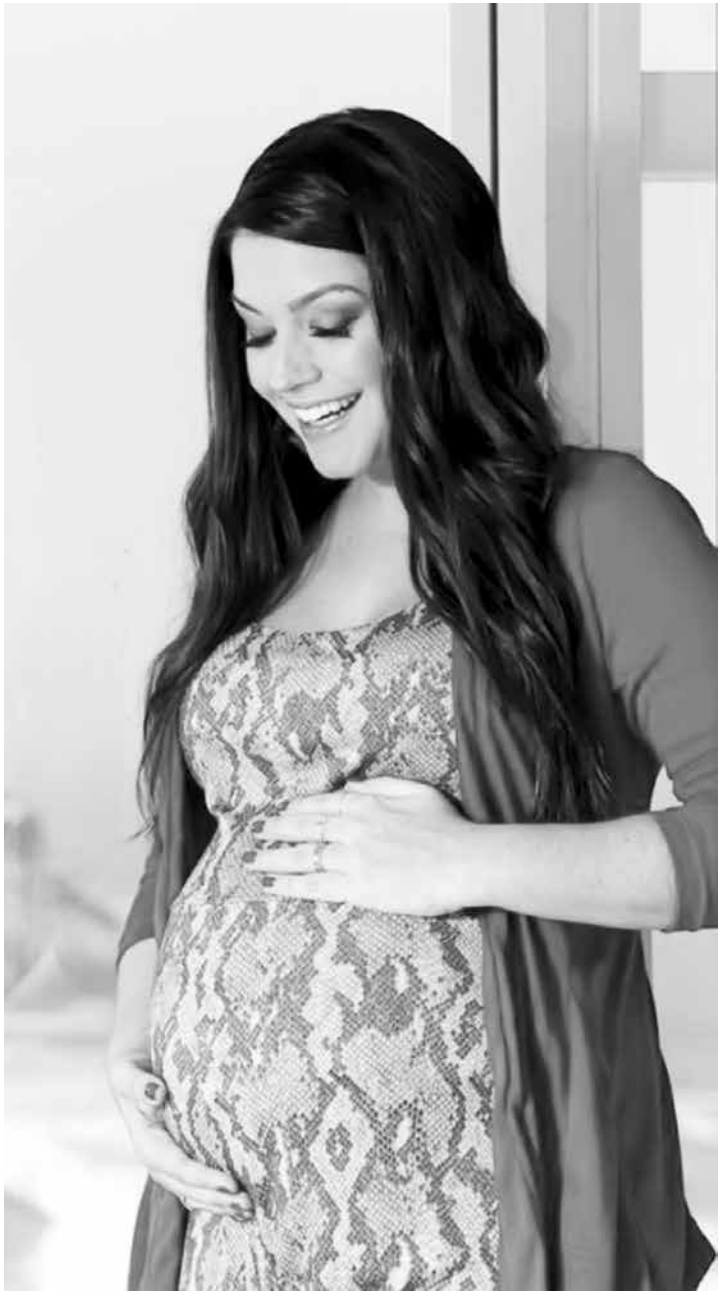
Nome do caçula é em homenagem a Michel Teló

A atriz também falou sobre como anda a sua vida amorosa. “Com três filhos pequenos, é claro que o cinema muitas vezes substitui o sexo.