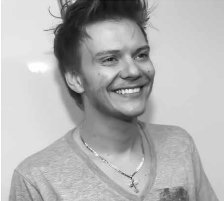
Sempre bem humorado, cantor brincou com a situação

— Eu acho que a novela tem a ver com o momento atual que estamos vivendo. A trama fala de ética. Mostra que vale a pena roubar... Já que estão roubando ali, vou roubar aqui. É o que a gente vive.