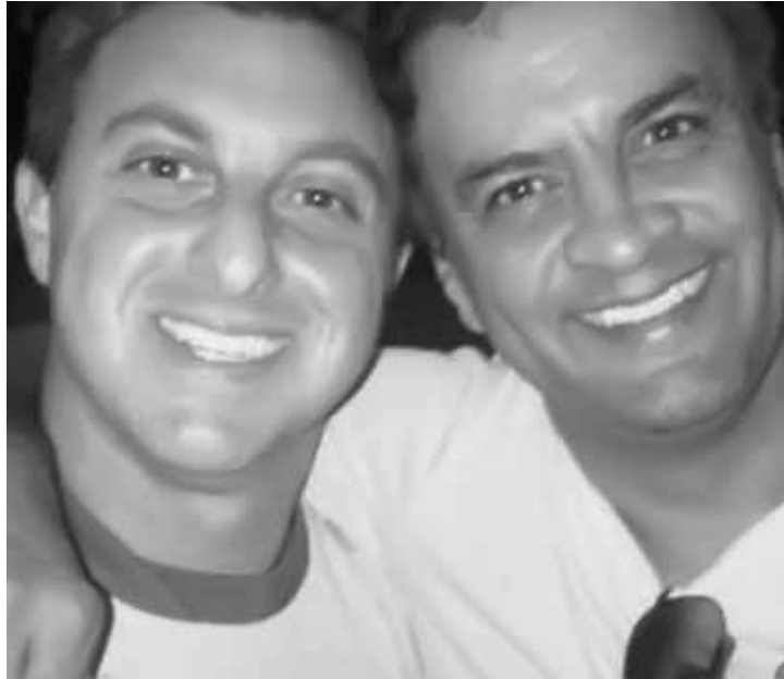
Luciano Huck aparece ao lado de Aécio Neves em foto que teria sido apagada pelo apresentador de seu Instagram

Aécio foi alvo nesta quinta-feira de operação da Polícia Federal que cumpriu mandados de busca e apreensão em diversos endereços ligados a ele no Rio de Janeiro e em Minas Gerais, além de seu gabinete no Congresso Nacional.