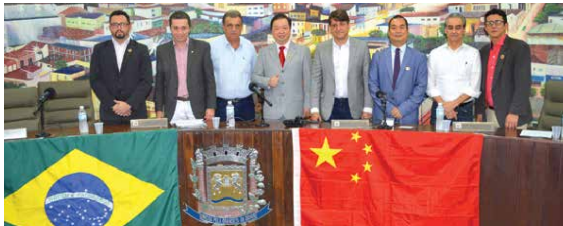
Autoridades participantes do encontro da Frente Brasil-China

O prefeito André Pessuto deu as boas-vindas aos participantes, recepcionando os chineses que visitaram Fernandópolis e falando sobre o potencial regional. "A Frente Parlamentar Brasil-China é extremamente importante, estamos muito gratos por esse encontro, onde as potencialidades de nossa cidade poderão ser vistas de perto, para que juntos possamos traçar parcerias que certamente serão benéficas para todos", disse. Na oportunidade, o deputado federal Fausto Pinato, presidente da Frente Parlamentar Brasil-China na Câmara