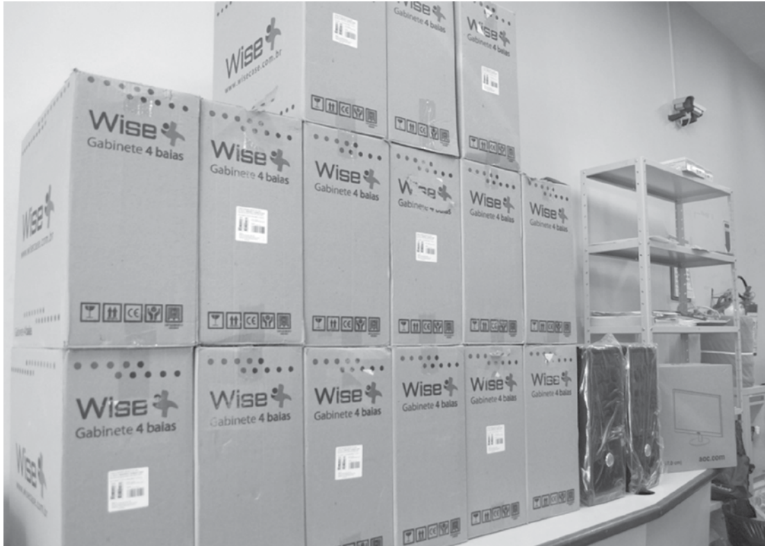
Equipamentos modernos e de melhor desempenho possibilitarão tanto a substituição de algumas máquinas quanto a implantação de novas estações de trabalho no setor de TI do hospital

Emendas parlamentares destinadas pelos deputados João Dado, Otoniel Lima e senador Aloysio Nunes, intermediadas Fausto Pinato, possibilitaram a compra de 17 microcomputadores e um novo servidor para a Santa Casa de Fernandópolis, no valor total de R$ 81,9 mil. Além destes, outros equipamentos também serão adquiridos com os recursos, propostos em 2015 e 2016, ultrapassando o valor de R$ 1 milhão. “Esses equipamentos são mais modernos, apresentam melhor desempenho e vão possibilitar tanto a substituição de algumas máquinas, como a implantação de novas estações de trabalho em setores que estavam deficitários”, explica o responsável pelo setor de TI (Tecnologia da Infor-