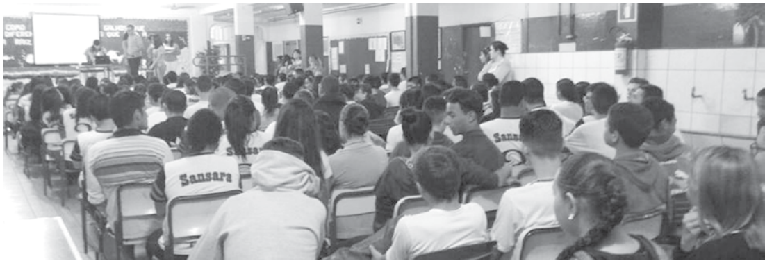
O objetivo central do encontro foi de conscientizá-los sobre a temática do Abuso e Exploração Sexual Infantil e orienta-los sobre a importância da efetivação das denúncias

da E.E. Sansara Singh Filho e da EMEF – Ouroeste, oficinas com atividades socioeducativas em todas as salas de aulas, tendo alcançado cerca de 1300 crianças e adolescentes.