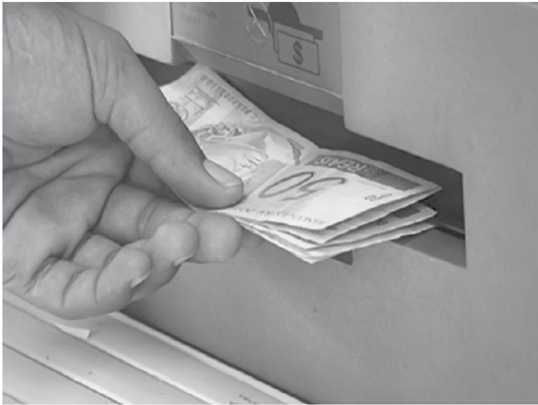
Iniciada em dezembro do ano passado, a pesquisa mostra, no entanto, pequena redução na proporção dos que não conseguiram guardar dinheiro

A pesquisa mostra também que a minoria (14%) faz a poupança, pensando em tê-la como reserva na hora de se apo-