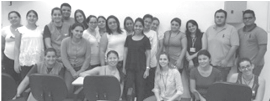
Agentes Comunitários de Saúde receberam as informações para repassarem à população

para repassarem as informações pertinentes à população.