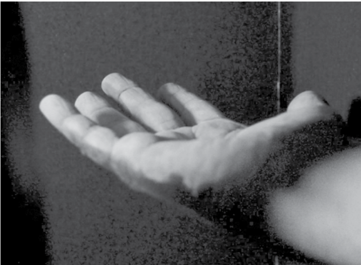
Utilizando uma câmara escura, orientadores enfatizam a necessidade da higienização

rais, após a áreas próximas aos pacientes e antes de técnicas assépticas.