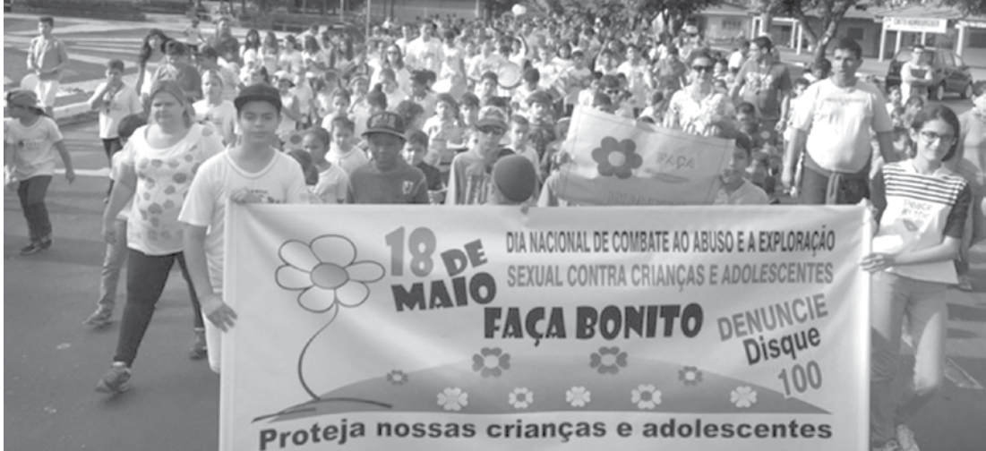
A caminhada contou com a participação em massa dos alunos, professores e coordenadores da EMEF – Ouroeste, da Escola Sansara e do Projeto Guri

A rede contou também com a parceria da SABESP que disponibilizou saquinhos de águas, que foram distribuídos aos participantes, ao longo do trajeto. Com o objetivo de preparar as crianças e adolescentes do município para esta ação comunitária, no último dia 19 de maio, o curso de Serviço Social da Fundação Educacional de Fernandópolis – FEF, a partir da articulação com o CRAS de Ouroeste realizou juntos aos alunos