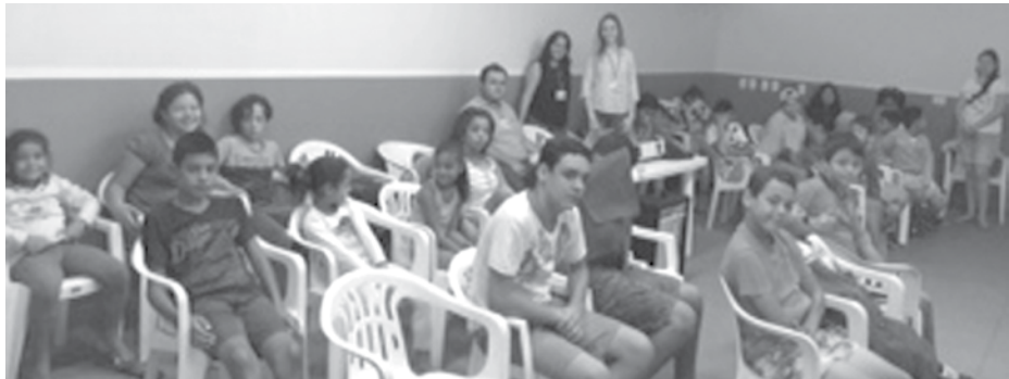
Palestra educativa realizada com participantes do CRAS