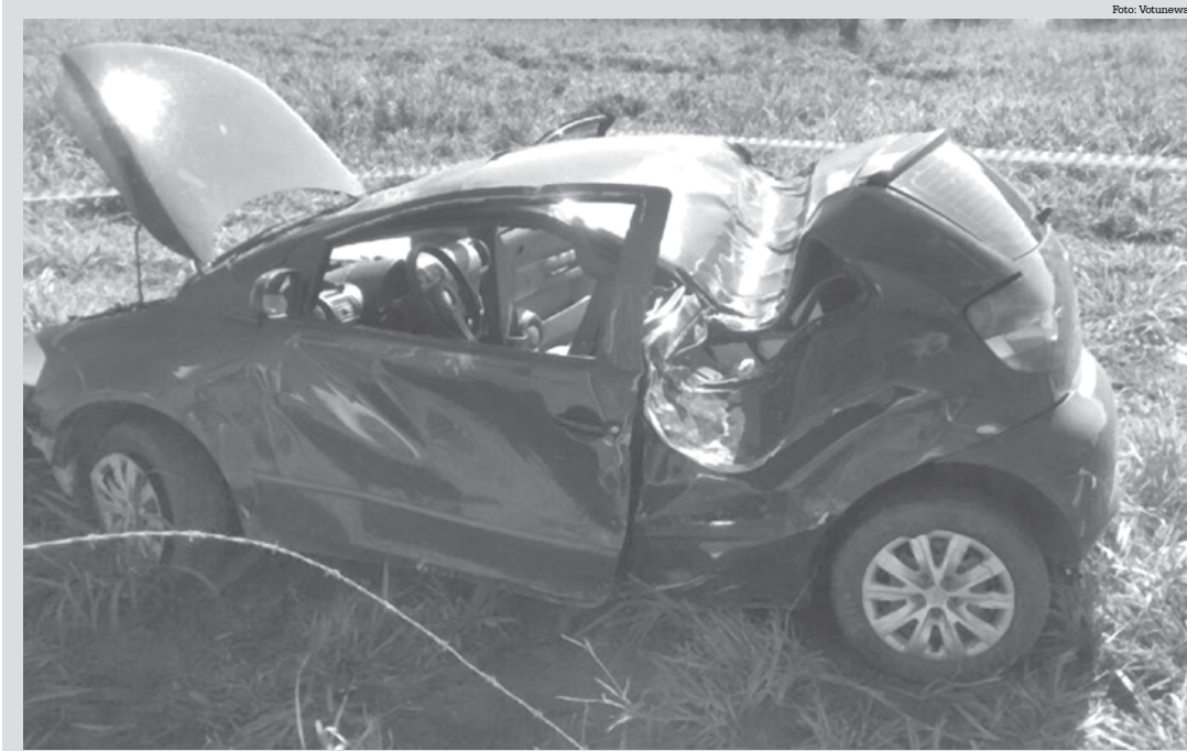
Carro capotou ao sair da pista

→ BRENO GUARNIERI contato@oextra.net Uma criança de 1 ano e 2 meses morreu após sofrer um acidente doméstico na tarde de ontem (26), em Estrela d'Oeste, município localizado a 18 quilômetros de Fernandópolis. De acordo com informações da Polícia, a criança brincava perto de uma churrasqueira feita de campana de caminhão quando o objeto caiu sobre ela. A Polícia Civil investiga o que teria feito a churrasqueira cair, se a criança teria encostado no objeto ou subido nele. Logo após o acidente, a criança foi socorrida pelo Serviço de Atendimento Móvel de Urgência (Samu) e levada à Santa Casa de Fernandópolis, porém, não resistiu aos ferimentos e veio a óbito. A Polícia Civil solicitou perícia no local do acidente. Até o fechamento desta matéria, não havia informações a respeito do sepultamento.