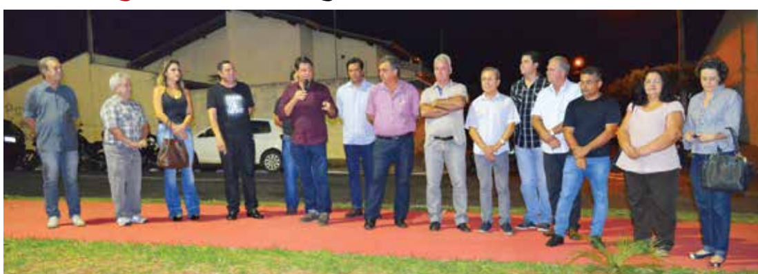
Cerimônia realizada na quinta-feira (25), apresentou os serviços implantados pela Prefeitura