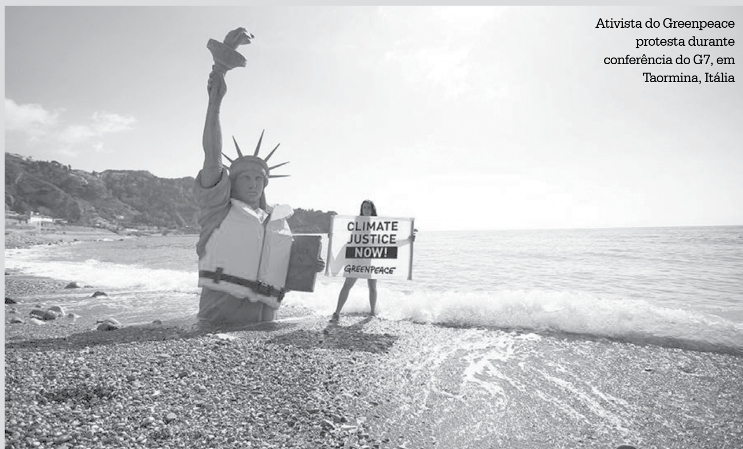
Ativista do Greenpeace protesta durante conferência do G7, em Taormina, Itália