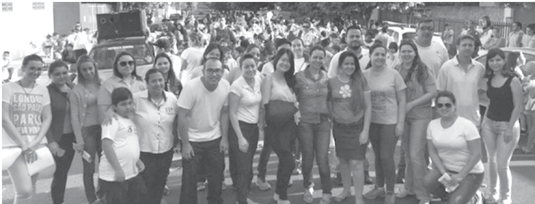
Os profissionais planejaram a ação comunitária, com o intuito de conscientizar a comunidade sobre a importância de ficarem atentos às suspeitas da existência de violência