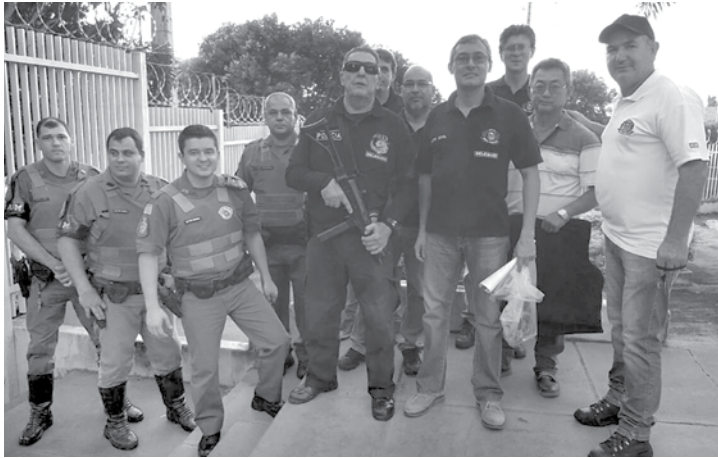
Operação contou com o efetivo de 90 policiais

termo circunstanciado de posse de droga, e um ato infracional de tráfico de drogas. Nove criminosos foram presos em flagrante delito, uma mulher procurada capturada e um menor apreendido. Foram apreendidas inúmeras porções de cocaína, crack e maconha, dinheiro proveniente do tráfico de drogas e um revólver calibre .22. A Polícia Militar e Polícia Civil contaram com o efetivo de 90 policiais, distribuídos em 30 viaturas durante a ação.