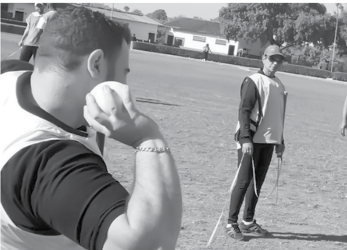
Modalidade atende pessoas com deficiência