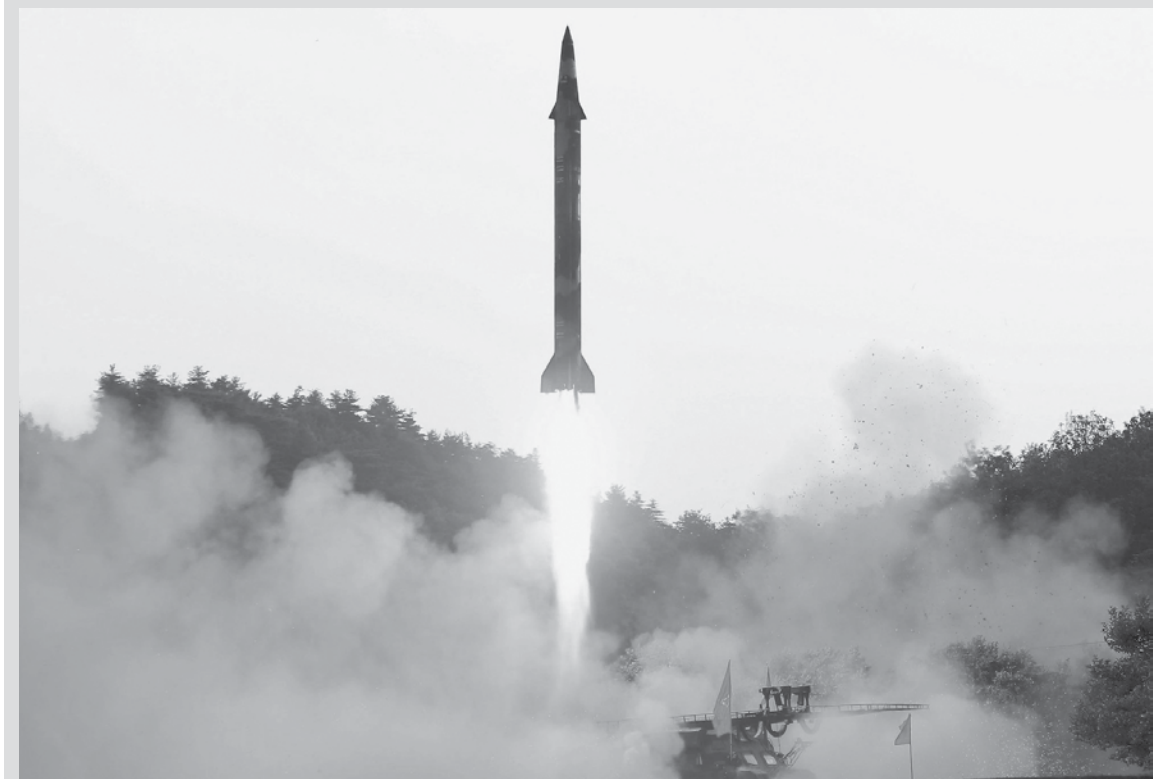
Mísil balístico é lançado na Coreia do Norte em teste usando um sistema de guiamento com precisão de controle, em foto não datada divulgada pela agência estatal norte-coreana