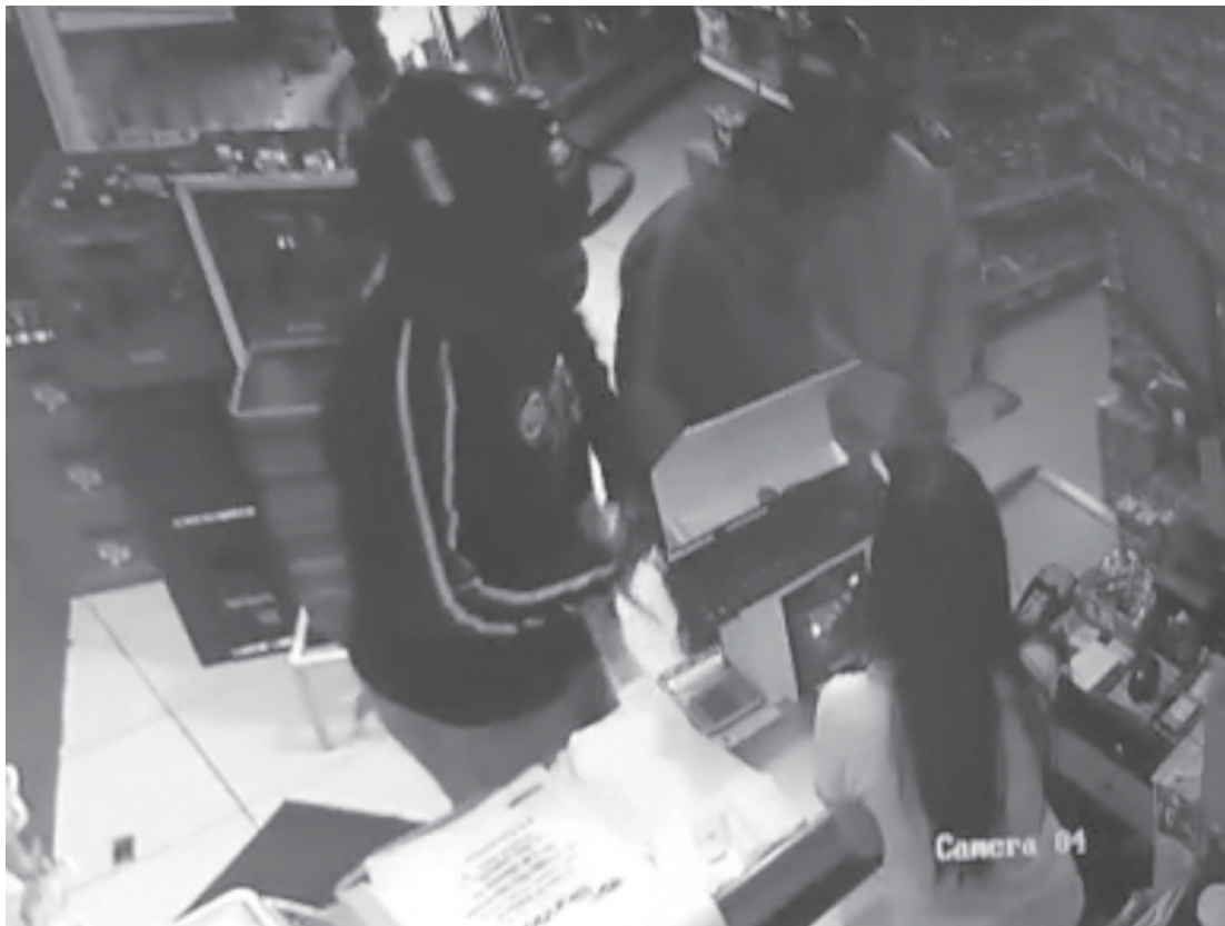
Câmera de segurança flagra o momento do assalto

Um mercado foi assaltado na segunda-feira (29), no Bairro Jardim Espanha, em Valentim Gentil, município localizado a 23 quilômetros de Fernandópolis. Informações do boletim de ocorrência dão conta de que dois suspeitos chegaram ao local armados e de capacetes. Rapidamente renderam os funcionários e obrigaram uma das vítimas a entregar o dinheiro do caixa. Uma das câmeras de segurança do estabelecimento registrou a ação dos criminosos, que durou menos de 30 segundos. Na ocasião, ninguém ficou ferido. A dupla fugiu com aproximadamente R$1,5 mil. A Polícia Civil está em busca dos suspeitos, mas, até o fechamento desta edição, ninguém foi preso.