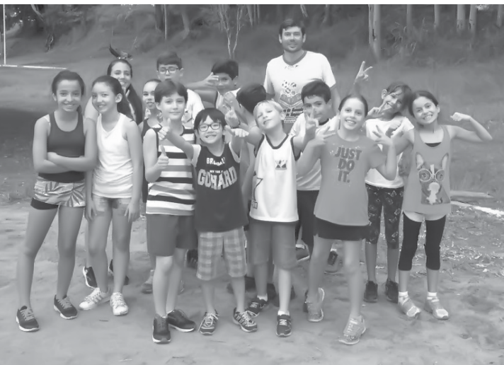
Crianças e jovens também participam gratuitamente das aulas

Lazer, na rua Kazuyoshi Bepu, 305, bairro Morada do Sol (Antigo Clube da Cesp), o telefone é 3442-3234.