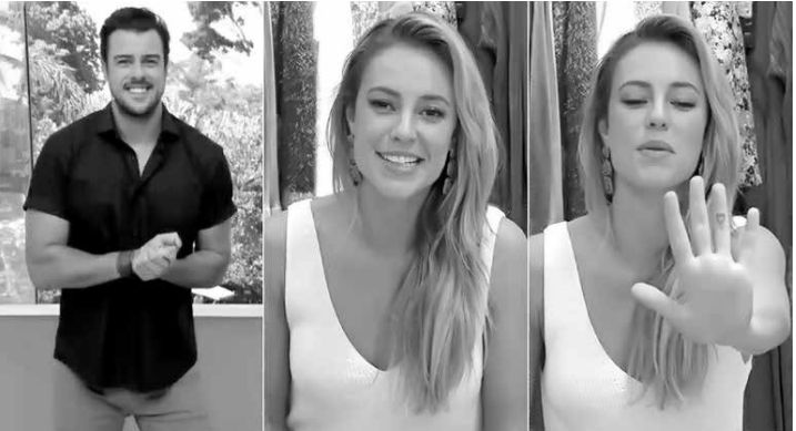
O apresentador do Vídeo Show foi casado durante 5 anos com a atriz global