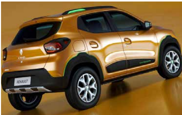
Versão completa do Kwid deve custar apenas R$ 34,9 mil

A Renault prometeu novidades com o seu novo subcompacto - o Kwid - e deve mesmo cumprir o prometido. Sucesso de vendas na Europa e, principalmente na Índia, o modelo debuta em solo tupiniquim em 15 de junho com bom pacote tecnológico e com preço surpreendente: a versão de entrada, o primeiro hatch compacto nacional a vir de série com airbags laterais, além dos obrigatórios frontais, deve sair por R$ 29,9 mil e a top de linha, câmbio automatizado Easy'R e, com ele, hill-holder e controles de tração e estabilidade, por R$ 34,9 mil.