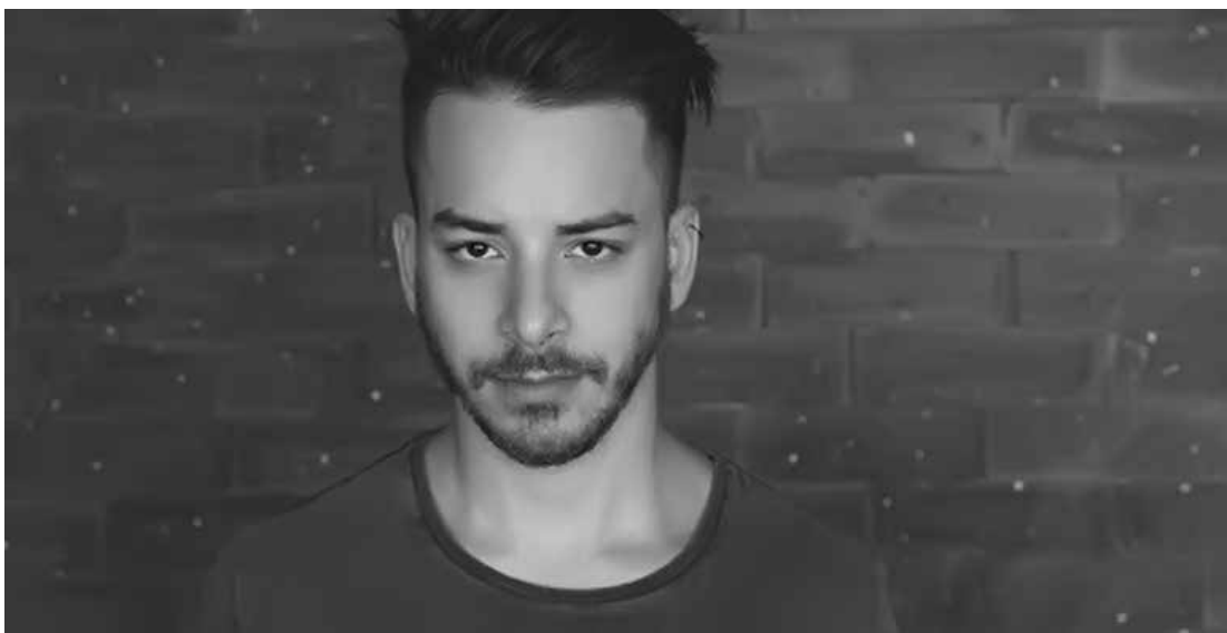
“Quem não queria pedir um autógrafo, queria infernizar”.