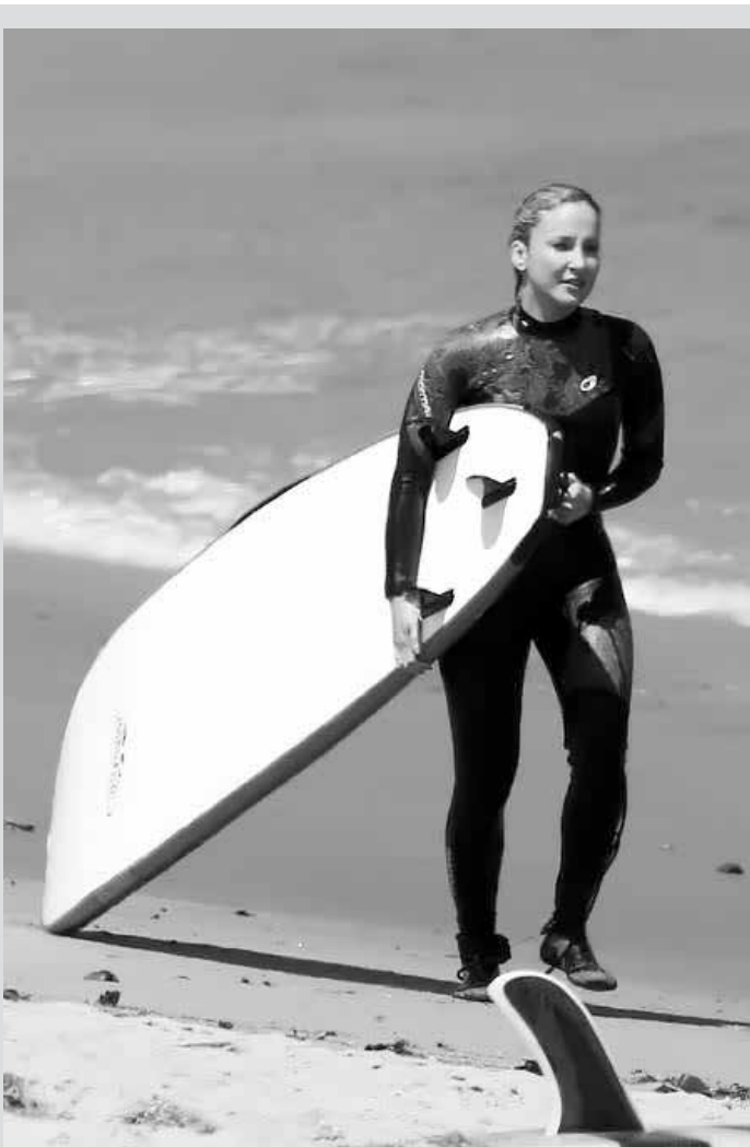
A cantora estava acompanhada de amigas brasileiras

na, eu amo. Não me considero radical”. Além disso, contou o “segredo” para ter a boa forma que exhibe: “Quando consigo manter minha rotina, o que nem sempre é possível por causa das viagens e das gravações, me exercito seis vezes na semana. Faço muay thai, pilates e ioga em dias diferentes, pelo menos duas vezes cada um”, revelou. Fora os exercícios, a esposa de Luciano Huck investe em drenagem linfática duas vezes por semana, e em outras ocasiões, foca em eliminar celulite, flacidez, e gorduras localizada. Para o rosto, ela faz rituais de limpeza, e garantiu que nunca sai de casa sem passar protetor solar, quando vai dormir investe em cremes para nutrir a pele. Por fim, Angélica contou que é adepta ao Botox, que sua dermatologista faz com cuidado e sem exagero. O que a faz gostar do procedimento que faz há algum tempo.