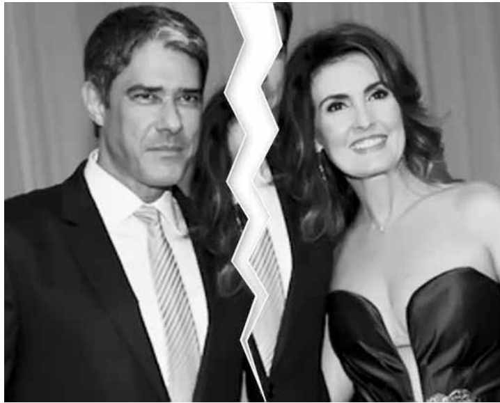
“Passamos por um processo de luto”, revelou a apresentadora.