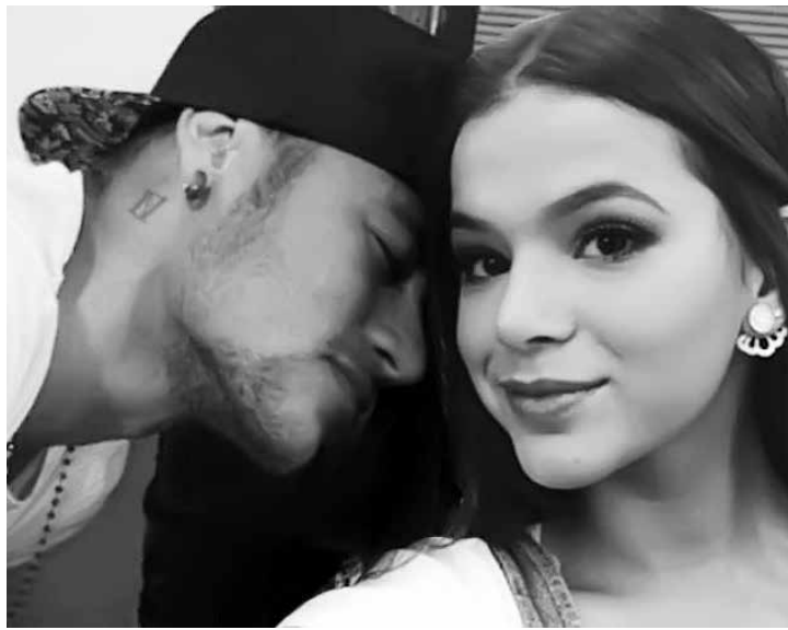
O craque postou um vídeo nas redes sociais para comemorar a chegada da amada

“Eu cheguei”, responde a atriz. Além de curtir as férias com Marquezine e os “parças”, Neymar tem participado de alguns eventos na Terra do Tio Sam. Ele também curtiu um jogo da final da NBA.