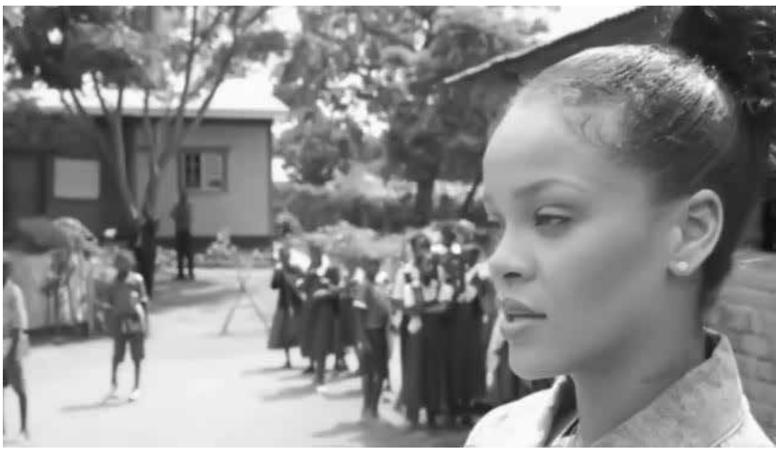
Rihanna participou das aulas das crianças

mo de manhã porque, no futuro, quando eu for um homem de negócios, eu terei mais comida”, diz ele. Logo no início do documentário, Rihanna aparece cantando com as crianças. Nas imagens, a cantora também aparece ajudando uma das crianças a resolver problemas de matemática, comemorando a vitória de um time de rugby feminino e se encanta com o fato de o ensino na escola ser feito com a música. “É brilhante poder usar isso como uma ferramenta de aprendizagem, porque crianças aprendem músicas com muita facilidade”, conta.