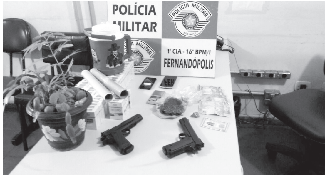
Material encontrado na residência da acusada foi apreendido pela Polícia

drogas, crime que prevê de 5 a 15 anos de prisão, em caso de condenação. Ela foi encaminhada à sede da DISE para prestar esclarecimentos. Posteriormente, foi levada à Cadeia Pública de Nhandeara, na qual permanece à disposição da Justiça. O material, que evidenciou a atividade ilegal, encontrado na residência de L.S. foi apreendido pela Polícia. O caso é investigado.