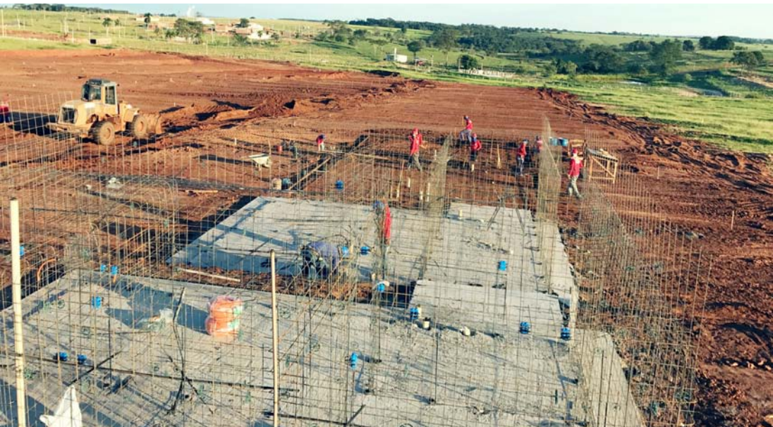
Trabalhadores em atividade no novo bairro: aquecimento do setor de construção civil

zada na Avenida dos Arnaldos, 1503, de segunda a sábado, das 09 às 18h. Também há plantões de venda no local do empreendimento no mesmo horário. Mais informações podem ser obtidas pelos telefones (17) 3462-3089 e (17) 99632-6788.