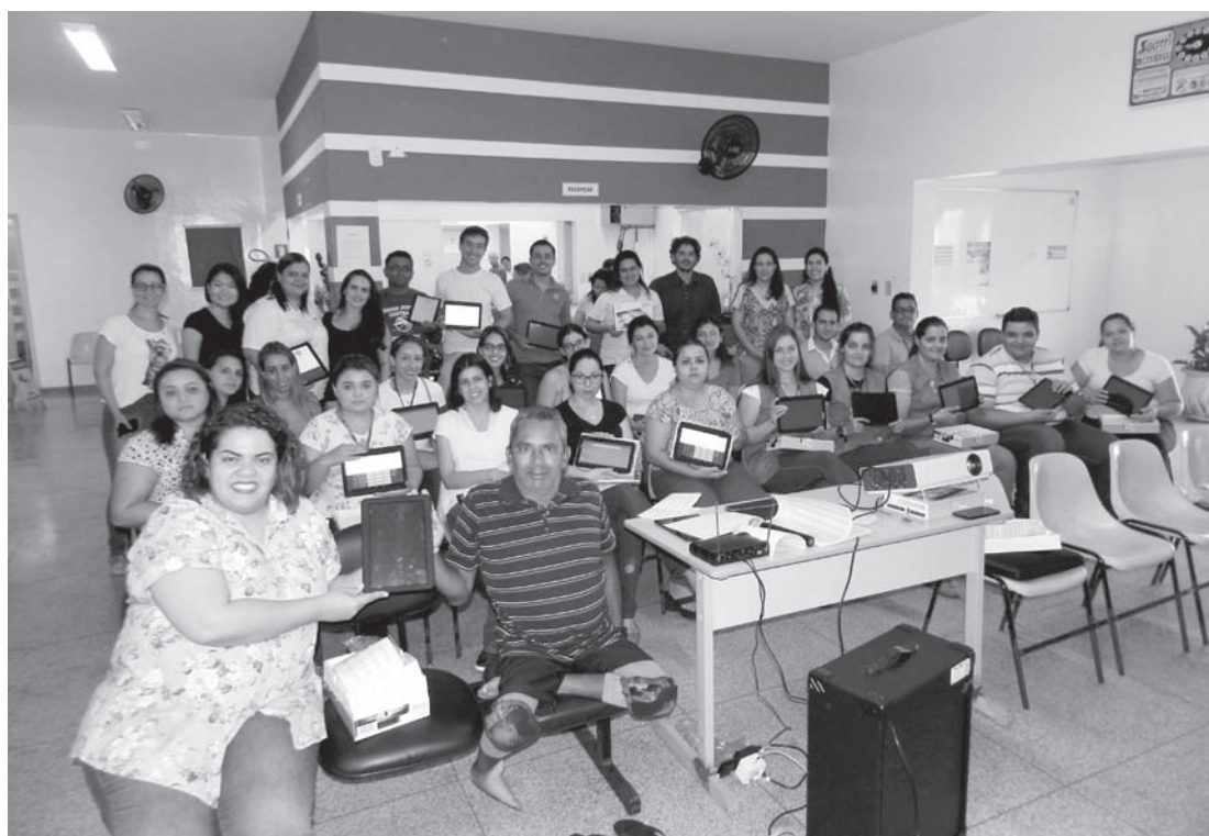
A informatização vai integrar as ações de saúde, permitindo melhor atendimento ao cidadão, melhor aplicação dos recursos públicos e o fornecimento de dados para o planejamento do setor

→ ACESSORIA DE IMPRENSA Prefeitura de Ouroeste