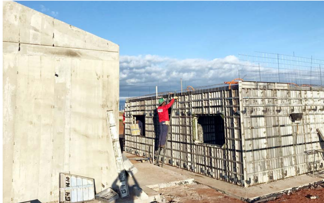
Casas começam a ser erguidas no Residencial Wilson Moreira

O contrato de construção foi oficializado no dia 03 de maio