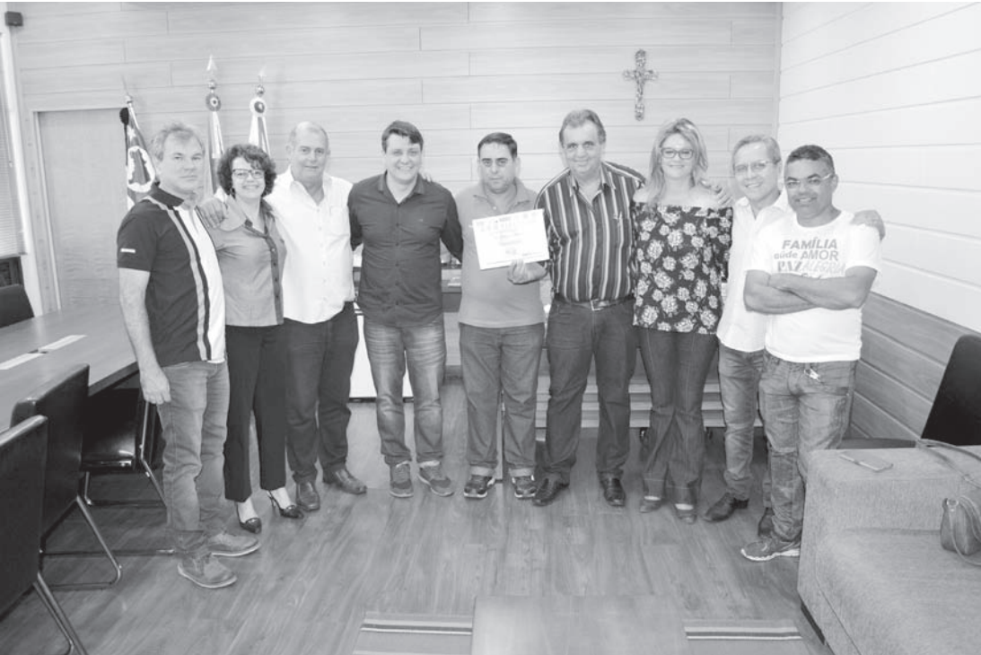
Evento foi realizado nesta sexta-feira no gabinete do prefeito

na certeza que estamos no caminho certo” destacou o prefeito André Pessuto. Ele também fez questão de citar as visitas constantes que o município vem recebendo. “Já recebemos o secretário do Meio Ambiente, da Assistência Social, neste sábado vem o do Turismo, entre outros nomes que vão ajudar em muito o nosso município” ressaltou o prefeito.