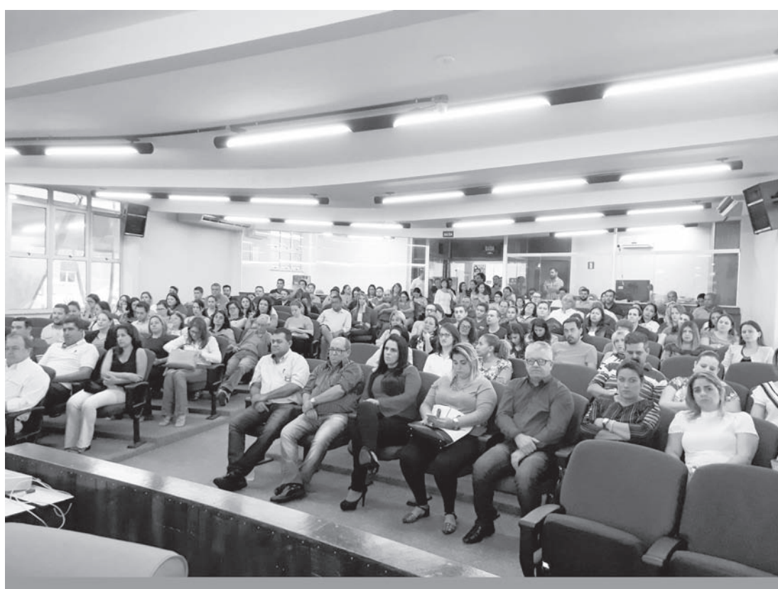
Evento contou com a presença de prefeitos, vices, vereadores e gestores sociais da região

Por sua vez, Pignatari explicou a importância das políticas públicas de assistência social serem transformadas em um programa de Estado. “Precisamos implementar essas políticas, para que possamos melhorar o atendimento