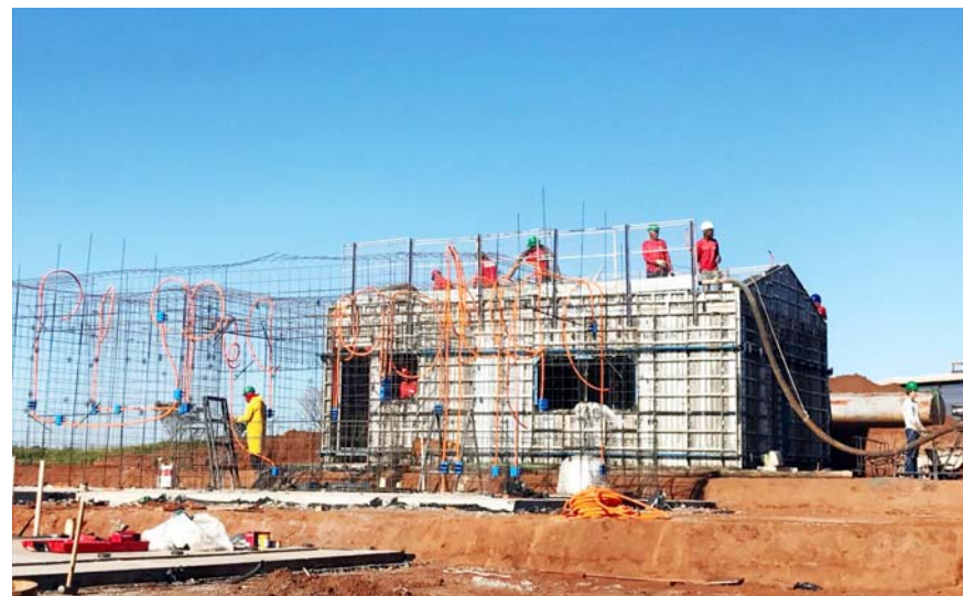
Até o final de junho canteiro de obras contará com 60 empregados diretos