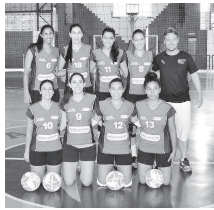
Equipe intensificou os treinos para obter bons resultados na competição