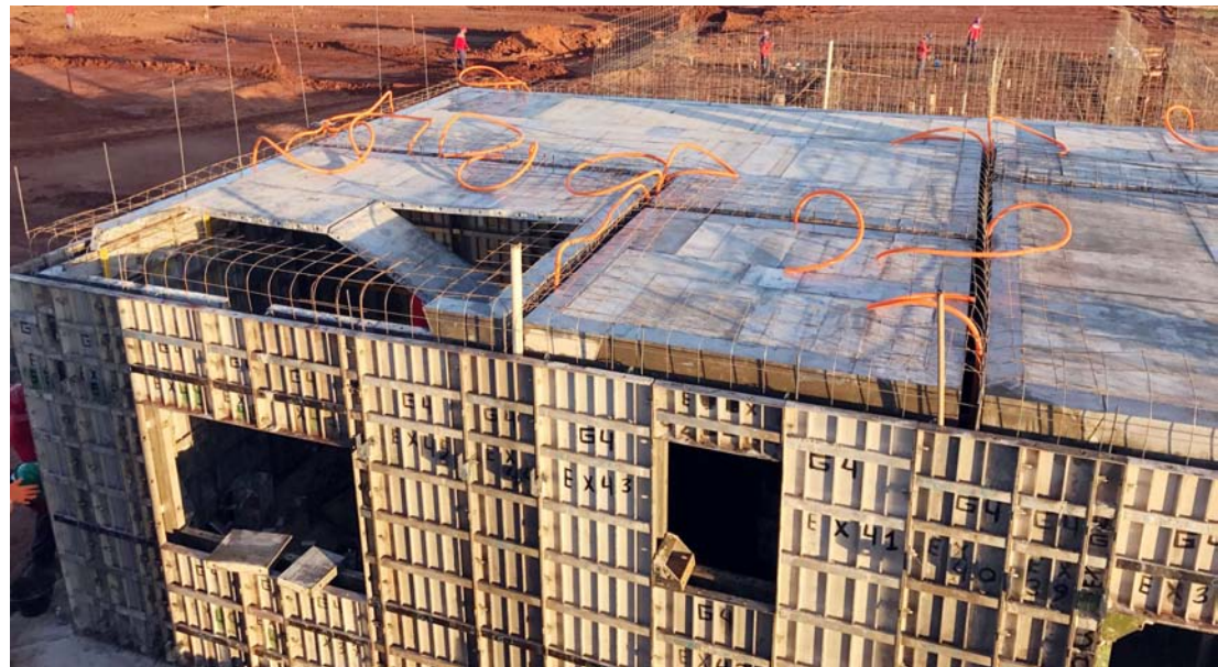
Com infraestrutura em estado avançado, obras avançam para nova fase