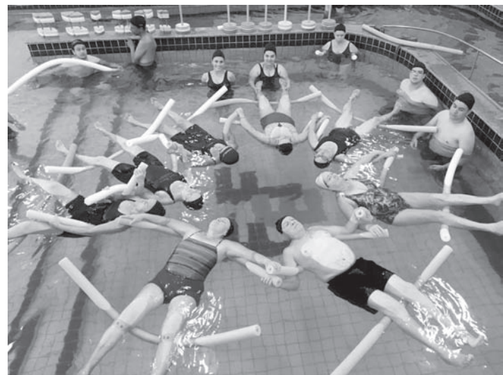
Além de relaxar os músculos, a fisioterapia aquática auxilia na recuperação de lesões