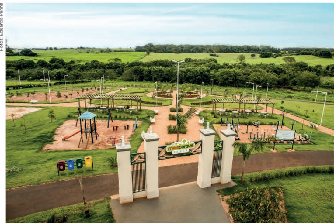
PARQUE ECOLÓGICO: Região do Recinto conta com mais de 150 mil m 2 de Áreas Verdes e Lazer

“Construí aqui porque além do loteamento estar bem localizado, é um dos lugares mais bonitos de Fernandópolis.”