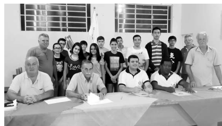
Seletiva que aconteceu na sede do Rotary com uma comissão de intercâmbio e estudantes de várias cidades

Onze estudantes participaram de uma avaliação respondendo questões, onde apenas uma jovem foi selecionada