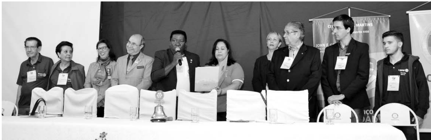
Mesa Diretiva formada por autoridades de Rotary Club e governadores do atual e do próximo ano rotário

O próximo lema é "O ROTARY FAZ A DIFERENÇA" que será veemente defendido durante todo o ano rotário, salientando que a preservação do meio ambiente e o combate a ações que provocam mudanças climáticas, são vitais à sustentabilidade de todos os projetos, conforme citação do Presidente de Rotary Internacional Ian Riseley, em que "Já passou o tempo em que