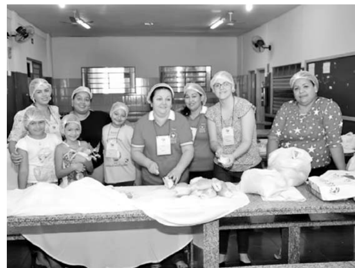
Senhoras da Casa da Amizade de Ouroeste foram responsáveis pela recepção com café da manhã