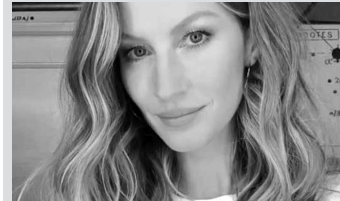
Top Model fez pedido nas redes sociais

Gisele Bündchen publicou, nesta terça-feira, em seu perfil no Twitter, um pedido ao presidente Michel Temer. A modelo pediu que Temer vetasse as Medidas Provisórias 756/2016 e 758/2016, que reduzem a proteção de 597 mil hectares de áreas protegidas na Amazônia. “É nosso trabalho proteger nossa Mãe Terra. @MichelTemer diga NÃO para reduzir a proteção na Amazônia!”, escreveu Gisele. O pedido feito por Gisele foi publicado após a modelo apoiar um abaixo-assinado da ONG WWF contras as MPs. Até o momento, mais de 15,5 mil pessoas já assinaram a medida. A expectativa é de que 50 mil