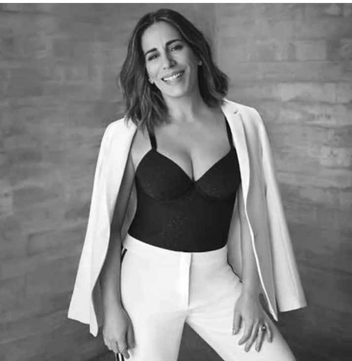
Gloria Pires posa de lingerie em ensaio