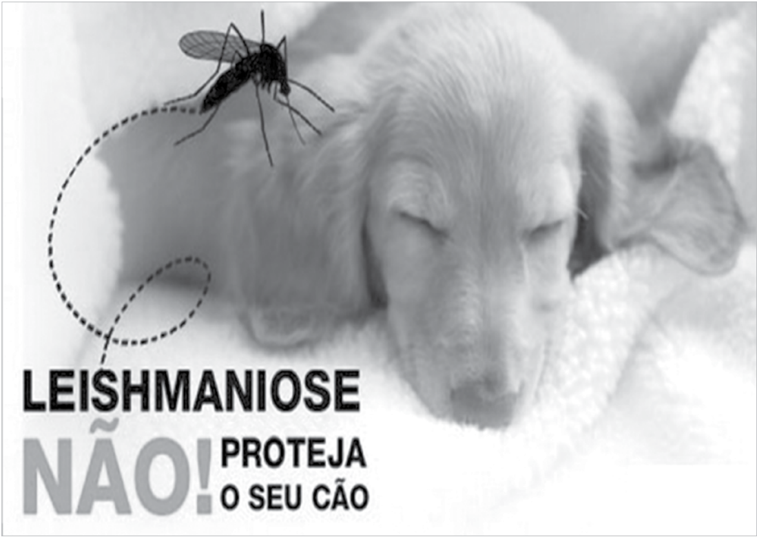
Centro de Zoonoses já iniciou ações na residência da vítima e imediações

O diagnóstico precoce é fundamental para evitar complicações que podem pôr em risco a vida do paciente. Além dos sinais clínicos, existem exames laborato-