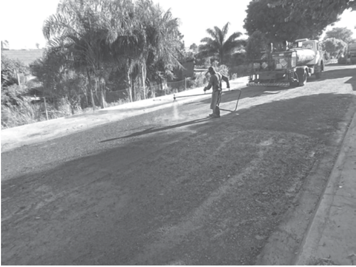
Equipes já estão trabalhando no asfaltamento e finalizando várias ruas