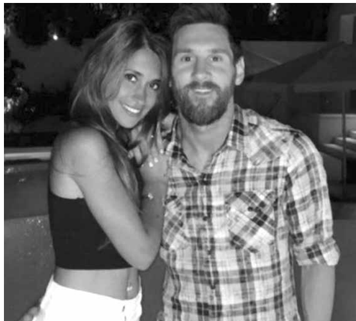
Antonella e Messi vão se casar no dia 30 de junho

Artista consagrada e com 56 anos de carreira, Elza Soares fez um elogio a Anitta. A cantora de 24 anos afirmou numa rede social que a Poderosa, de 24, é talentosa e merece “dominar o mundo e calar a boca de muita gente”. “A Anitta tem todo esse talento mesmo. Que domine o mundo e cale a boca de muita gente”, elogiou ela, se referindo ao sucesso que a cantora está começando a fazer no exterior. O comentário de Elza foi criticado por uma internauta, que chegou afirmar que a cantora é “babona de gente famosa”. Ela, então, rebateu: “Famosa, não, flor. Artista. O que são coisas completamente diferentes. Explicando o que canso de dizer por aí...”