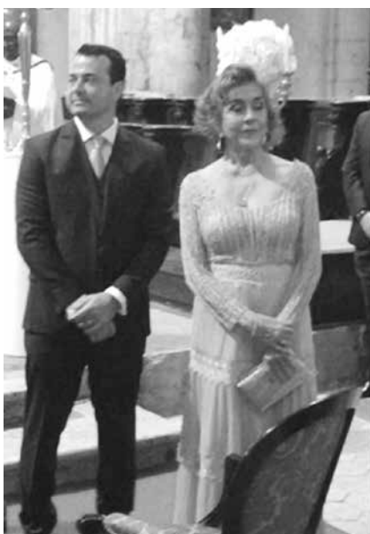
Cerimônia aconteceu no luxuoso Église Saint-Pierre de Chartres