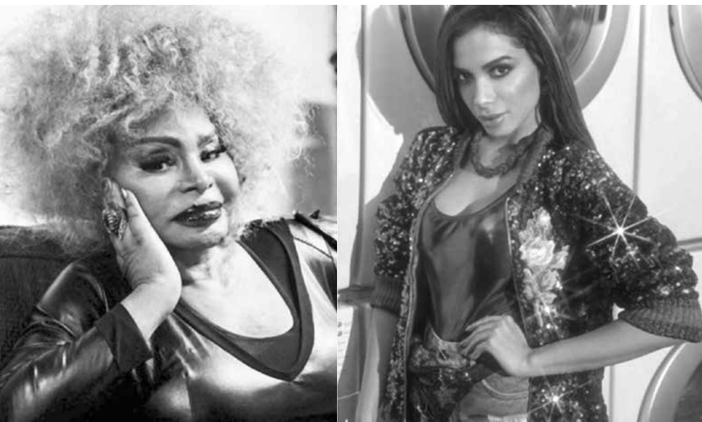
Elza Soares rebateu críticas de internautas

Artista consagrada e com 56 anos de carreira, Elza Soares fez um elogio a Anitta. A cantora de 24 anos afirmou numa rede social que a Poderosa, de 24, é talentosa e merece “dominar o mundo e calar a boca de muita gente”. “A Anitta tem todo esse talento mesmo. Que domine o mundo e cale a boca de muita gente”, elogiou ela, se referindo ao sucesso que a cantora está começando a fazer no exterior. O comentário de Elza foi criticado por uma internauta, que chegou afirmar que a cantora é “babona de gente famosa”. Ela, então, rebateu: “Famosa, não, flor. Artista. O que são coisas completamente diferentes. Explicando o que canso de dizer por aí...”