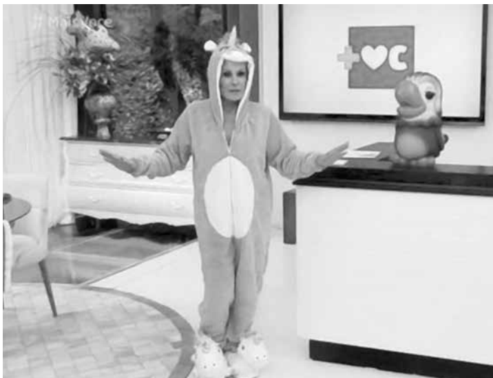
Ana Maria apresenta o “Mais você” vestida de unicórnio

Sobre o episódio específico desta segunda-feira, ela também não se mostra chateada: