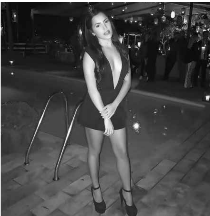
Emilly arrasou no decote, mas passou despercebida na festa