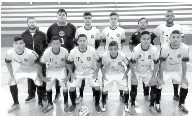
Futsal está na final