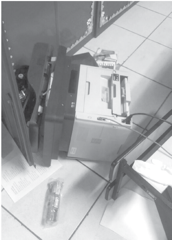
Funcionários presenciaram um cenário de destruição quando chegaram à escola para trabalhar