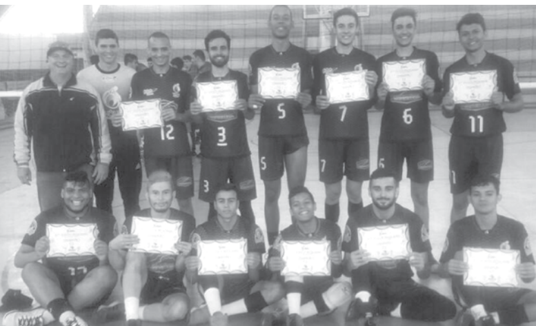
Vôlei masculino é ouro nos Regionais

Equipe conquistou a medalha na final realizada nesta quarta-feira (19), com uma grande virada em partida contra Indiaporã