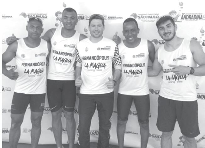
Atletismo no revezamento 4x100

→ SECOM Prefeitura de Fernandópolis D e virada, a equipe de voleibol de Fernandópolis conseguiu medalha de ouro na final contra Indiaporá nesta quarta-