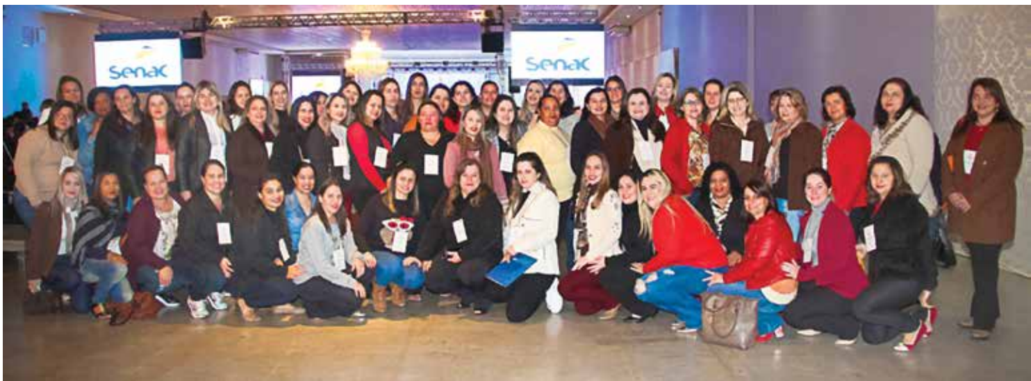
Docentes Efetivos da Rede Municipal de Ensino de Valentim Gentil