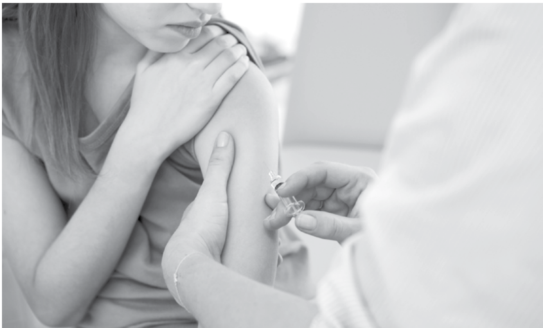
Todas as unidades de saúde disponibilizarão as vacinas

portante lembrar que o esquema completo consiste de três doses, que são aplicadas com zero, um e seis meses. As pessoas estarão protegidas apenas se estiverem com o esquema completo. Já a vacina meningocócica C é destinada a meninos e meninas entre 12 e 13 anos de idade. Em relação à Meningite é o primeiro ano no calendário vacinal para essa faixa etária, até o ano passado somente crianças menores de quatro anos recebiam a dose. A Meningite é transmitida por vias