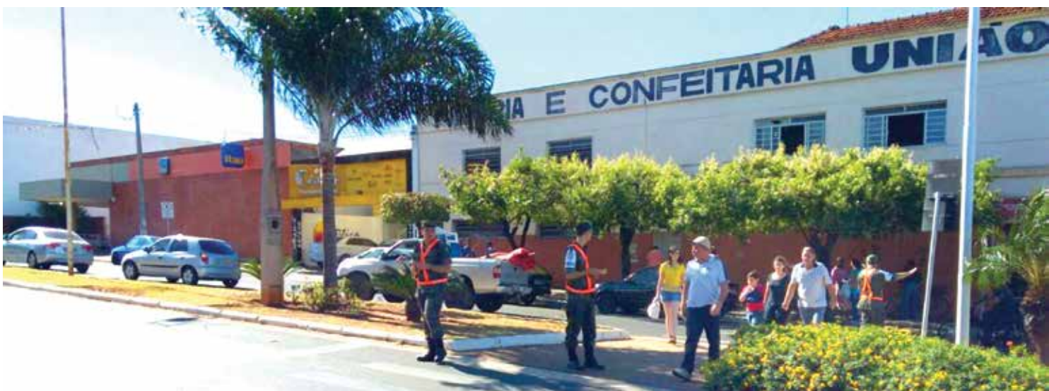
Atiradores em diversas atuações: nas faixas de pedestres, na área central da cidade e no MK Race

lio da travessia das faixas de pedestres, através do uso do apito e sinalização de mão em cruzamentos onde não existe sistema semafórico. Durante a ação, que acontece a cada quinze dias, a equipe também fez a distribuição de panfletos educativos, com objetivo de despertar a atenção dos condutores para que respeitem a travessia de pedestres. Durante todo dia de domingo, 16, os atiradores também marcaram presença na segunda edição do 'MK Race', evento que contou com a participação de ciclistas de toda região, realizando serviços de