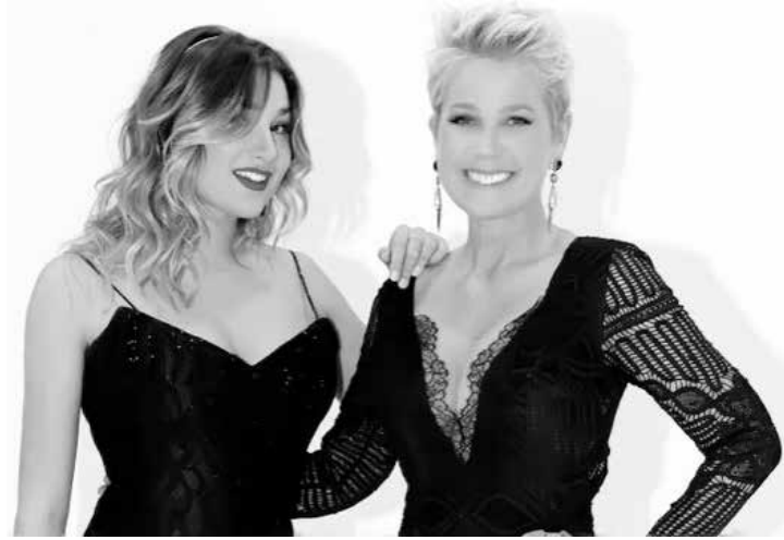
Xuxa rebate seguidor por crítica a Sasha

“Xuxa, você que preza tanto por mudanças no país, co-