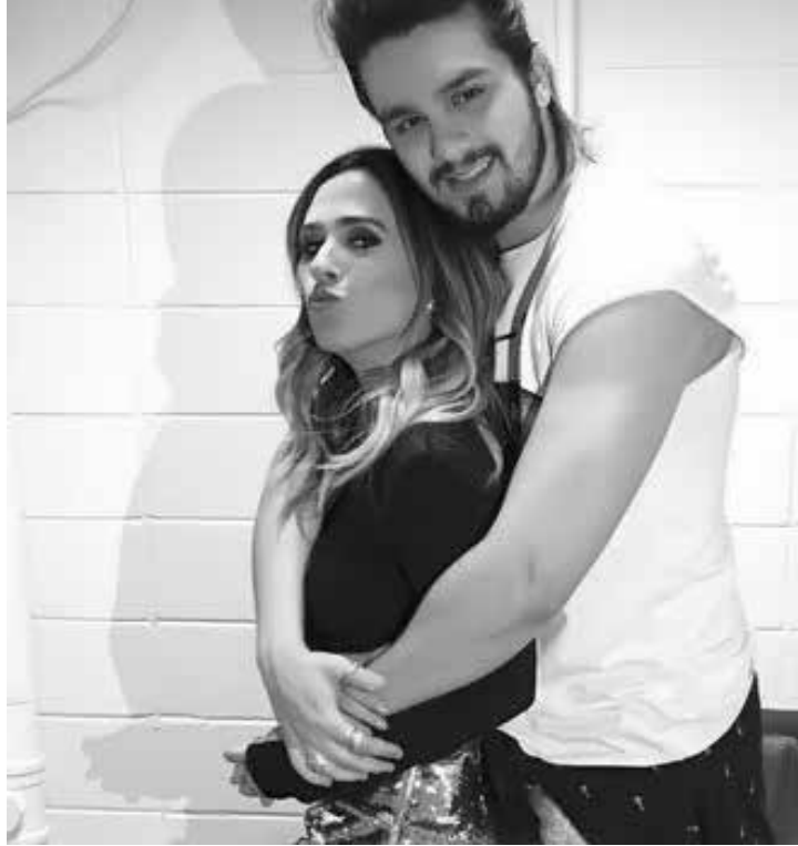
Ciúmes de Tatá? Vitti manda recado para Luan Santana

story” deixou uma mensagem no Instagram de Tatá, só que direcionada a Luan. “Tá gostoso aí, meu querido?”, brincou ele. Como todos sabem, Tatá e Vitti vivem um romance ainda não assumido publicamente. Eles, inclusive, viajaram juntos recentemente pela Europa.