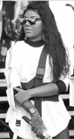
Ludmilla está feliz da vida com o resultado das próteses de silicone de 320 ml que colocou nos seios