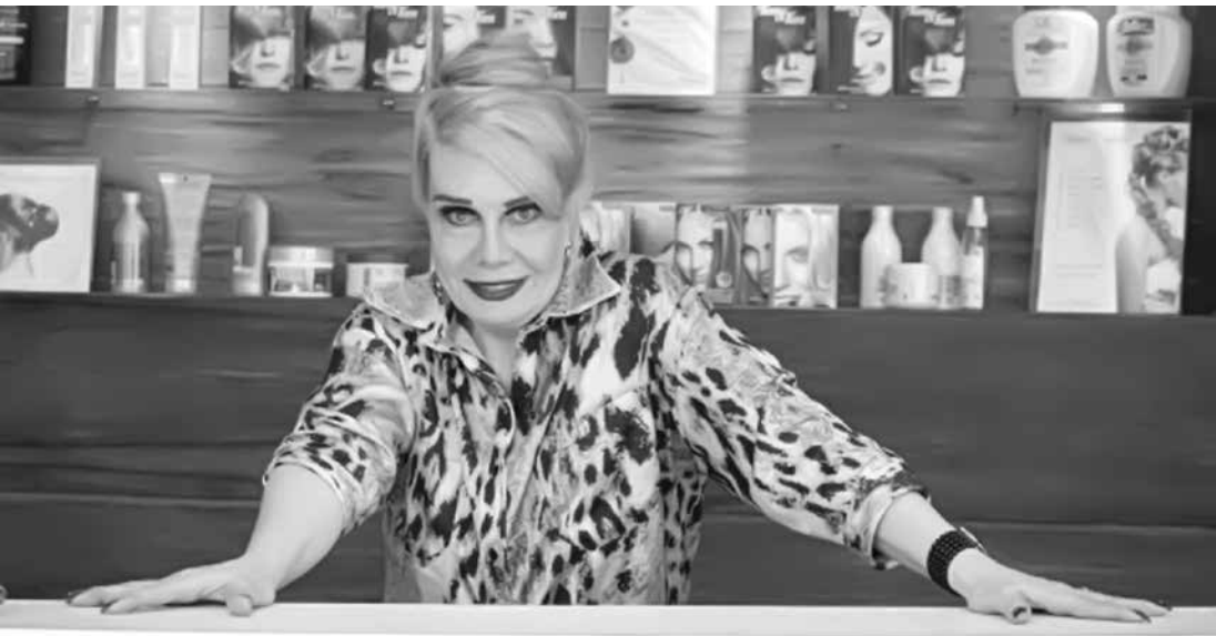
A artista permanece internada com infecção generalizada

quais já arca atualmente. A pendenga judicial já se arrasta há quatro anos. O cantor e Mari se divorciaram em 2010.