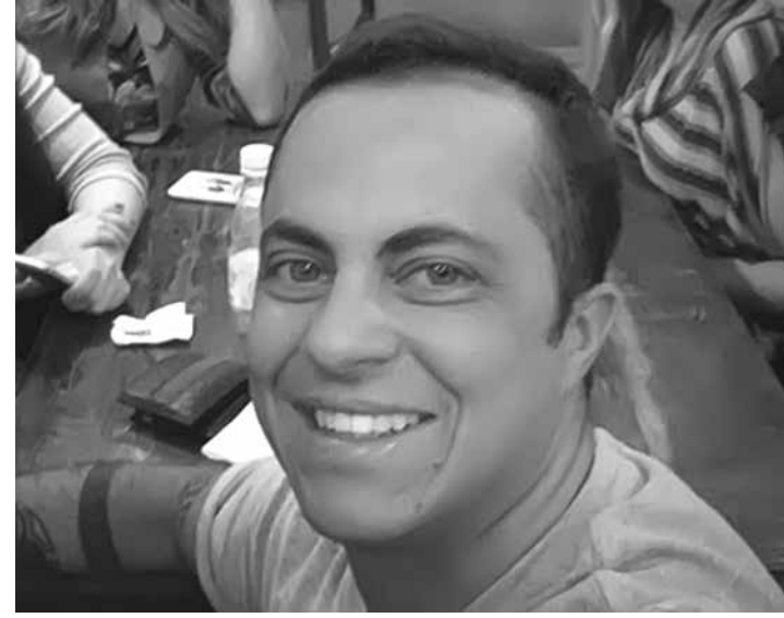
Thammy mostra calvice

Uma foto postada por Thammy Miranda nas redes sociais durante um jantar com a namorada e amigas está chamando a atenção dos internautas. A imagem deixa em evidência a calvície do filho transgênero de Gretchen. “Está ficando careca”, observaram alguns seguidores do ator. O próprio Thammy já confirmou em entrevista que vem perdendo cabelo por conta dos hormônios masculinos que toma para modificar o corpo e ganhar pelos no rosto e no peitoral.