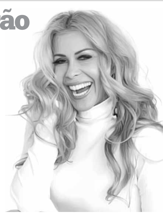
Ex-Calypso cantará na Estudantina

(Marco Pigossi) enciumado. Acompanhe os resumos de “A força do querer” desta e da próxima semana: Esta não será a primeira vez que Joelma participa de um folhetim. Em “Cheias de charme”, lançada em 2012 e reprisada em 2016, ela apareceu em cenas ao lado de seu marido na época, Ximbinha. Na sequência da ficção, a cantora e o ex foram tietados por Chayenne (Claudia Abreu), e cantaram também com o personagem Fabian (Ricardo Tozzi).