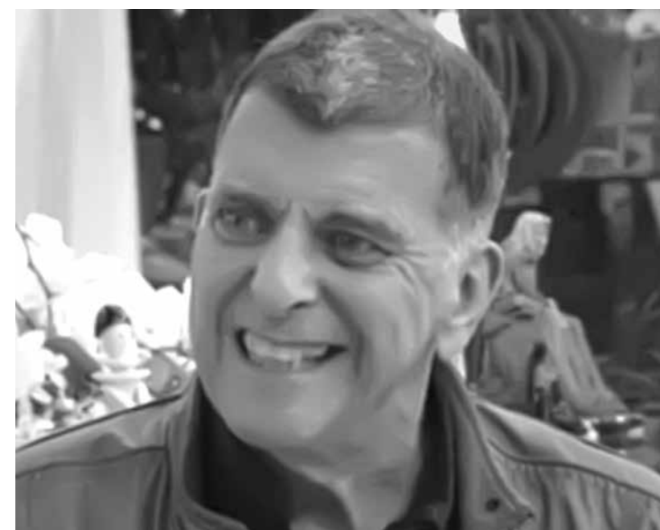
Jorge Fernando foi ao ‘Mais você’ para anunciar volta à TV visual”, no “Mais você”: “A gente tem que ajudar as pessoas a serem felizes, a brotar um riso no rosto. Sempre ba- talhei por isso. A vida é muito breve para a gente sofrer. A gente tem que ter um papel forte e ajudar.”

guiu se manter calmo para voltar à rotina no tempo da orientação médica. “Eu tive um AVC e imediatamente a carga de amor veio para cima de mim. Isso me acalmou muito, saber que eu tinha minha família, minha mãe, os médicos, os enfermeiros... É o maior aprendizado. Você fica com medo de morrer, não é bolinho (...). Tem medo de morrer para a vida. Eu tinha três projetos, uma novela, quero fazer teatro. A gente aprende a saborear cada momento. Quando a produção me chamou para fazer (o programa de Ana Maria) eu ainda estava falando torto, mas decidi: ‘Eu vou’”, declarou ele, que participou do quadro “Tapa no