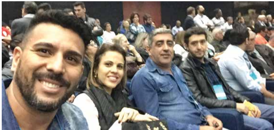
Representantes de Ouroeste durante o Encontro de Dirigentes de Cultura do Estado de São Paulo, no Memorial da América Latina, na Capital