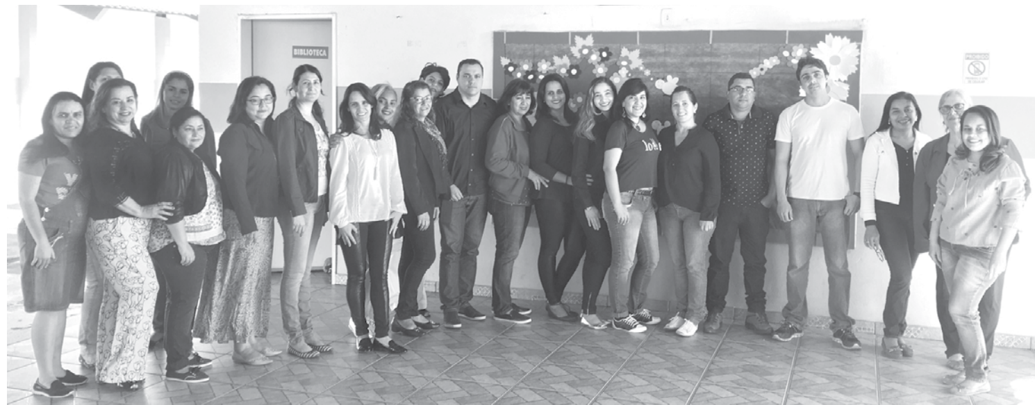
Escola vem apresentando um avanço qualitativo nos últimos anos

Diagnosticar as dificuldades dos alunos e priorizar a aprendizagem com comprometimento foram as estratégias utilizadas para o sucesso no alcance da meta