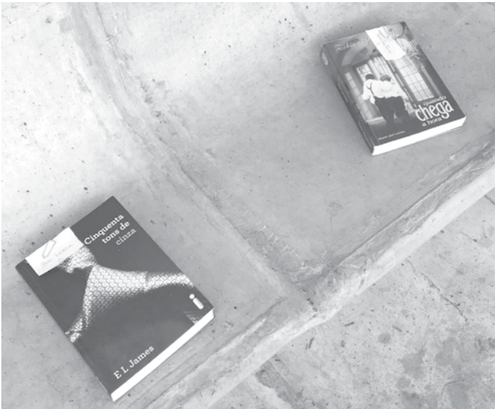
Em duas semanas, 20 livros foram “abandonados” em cinco bairros de Fernandópolis

Jales participa de um projeto de incentivo à leitura. Além de convocar os jalesenses para abandonar os livros, a Biblioteca Pública irá espalhar cerca de 50 livros pela cidade. Estrela