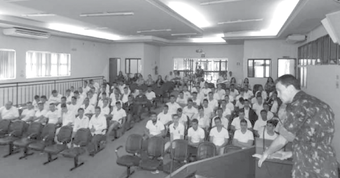
Cerca de 85 jovens alistados nos municípios de Ouroeste, Indiaporã, Populina e Guarani d'Oeste receberam os CDIs durante a cerimônia