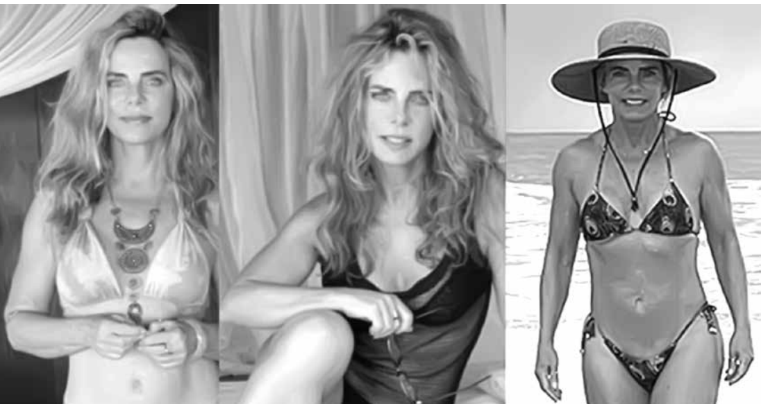
Bruna Lombardi: aos 65 anos quebrando tudo