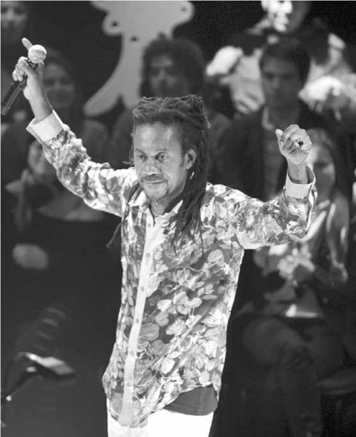
Músico lutava contra um câncer na medula

“Ivete veio com a proposta de resgatarmos a delícia do que é dançar junto, acho que a ideia e o vídeo e o ritmo da música passam essa vontade, fazendo com que todos danceem juntos novamente”, conta Bianco.