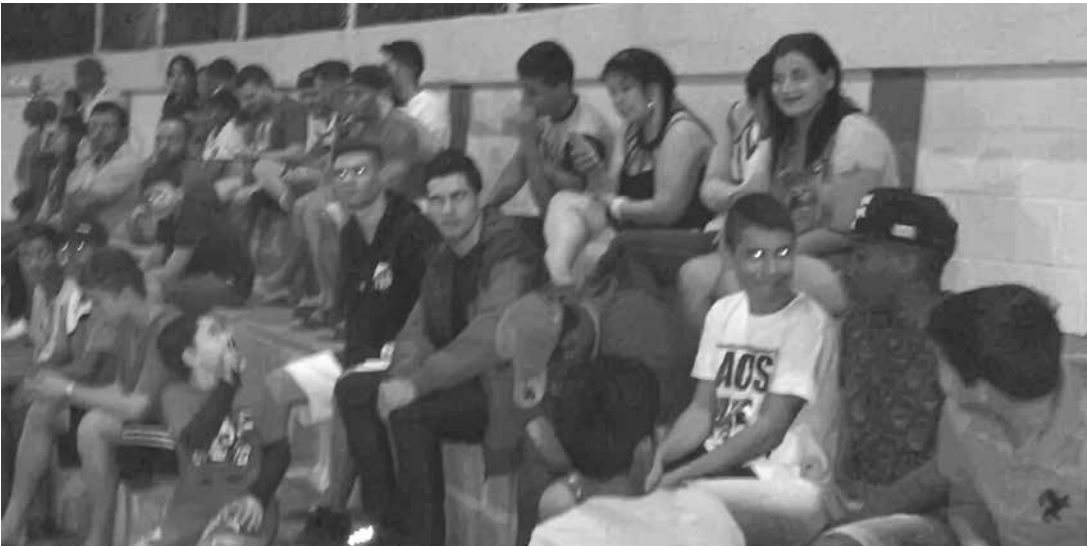
A final do 1º Fut Férias contou com o prestígio de um grande público