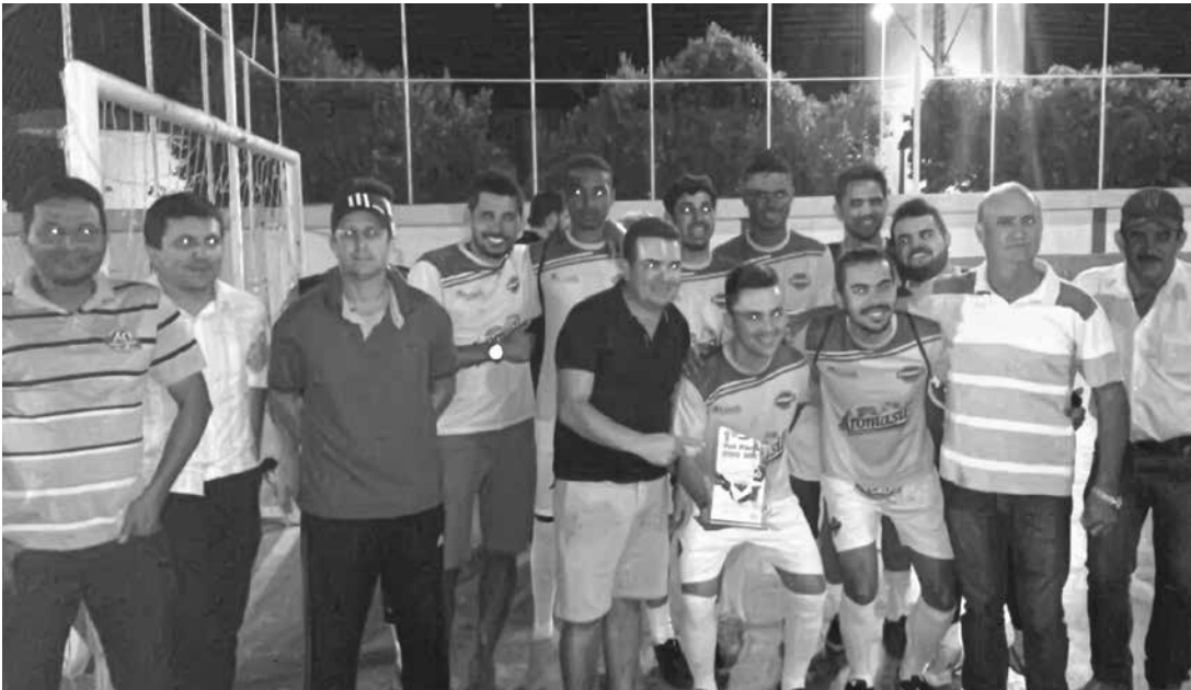
Jogadores que representaram a equipe Aromasil e foram campeões do Fut Férias junto com as autoridades na entrega da premiação

de lazer e confraternização entre os participantes. Segundo a prefeita Dra. Livia, o CCO com o apoio da prefeitura, tem promovido vários campeonatos em diversas modalidades, que além de incentivar o esporte, garante bem estar e saúde.