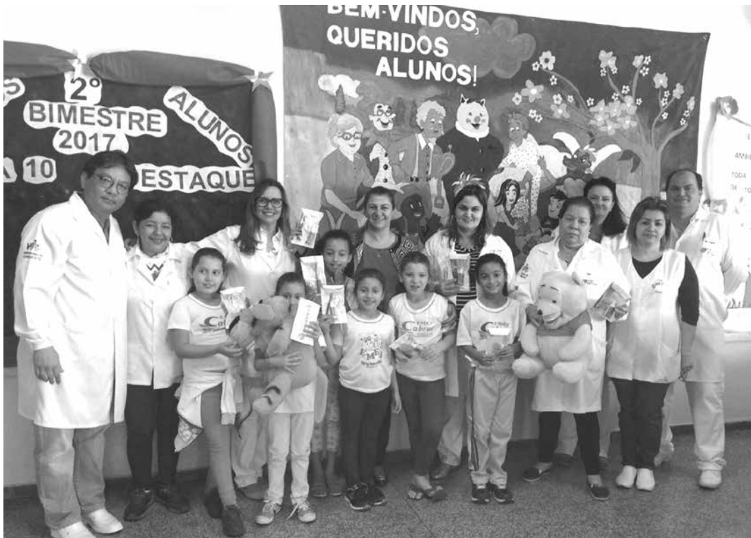
Como parte das atividades educativas, crianças e adolescentes da Rede Municipal e Estadual de ensino estão recebendo kits de Saúde Bucal da Prefeitura de Ouroeste