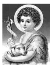
São João Batista