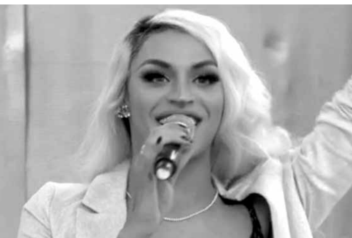
Pablo Vittar cantou no palco e conversou com Fátima Bernardes