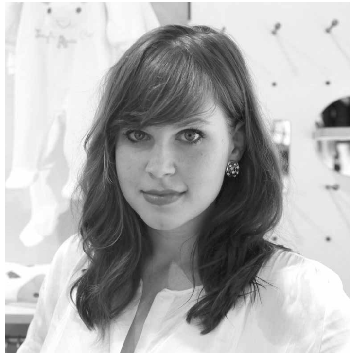
Atriz conta que no passado conquistou o tal “corpo mais maravilhoso”, mas a base de medicamentos nocivos para a sua saúde.