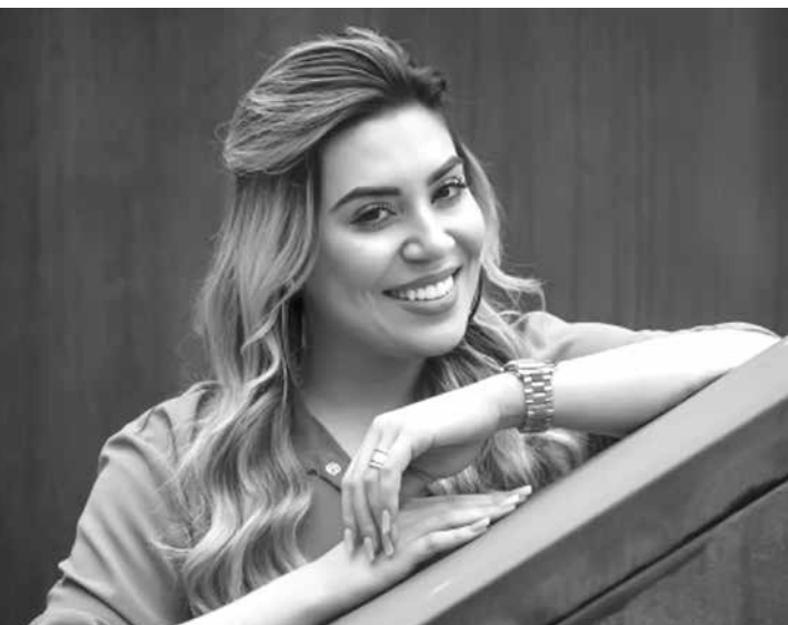
Afirmção da cantora causou polêmica entre os fãs