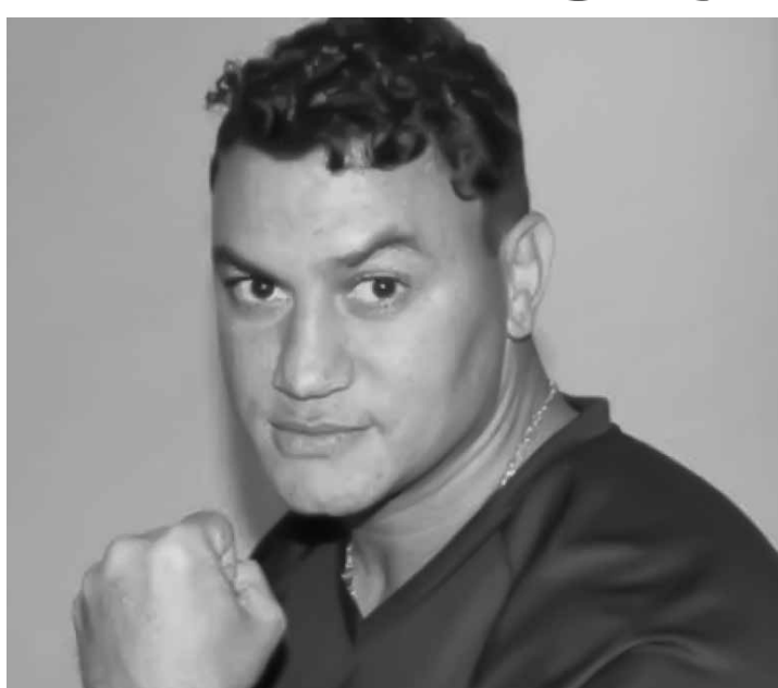
“A gente vê o pessoal na rua batendo, maltratando as pessoas porque elas têm as suas opções. Espero que isso nunca aconteça com ele”, disse o pugilista

Popó também aproveitou para elogiar a coragem do filho: “Eu acho ele mais macho que os outros cinco. Ele tem mais atitude. Tem que