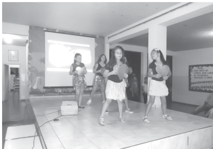
Apresentação dos alunos durante as comemorações