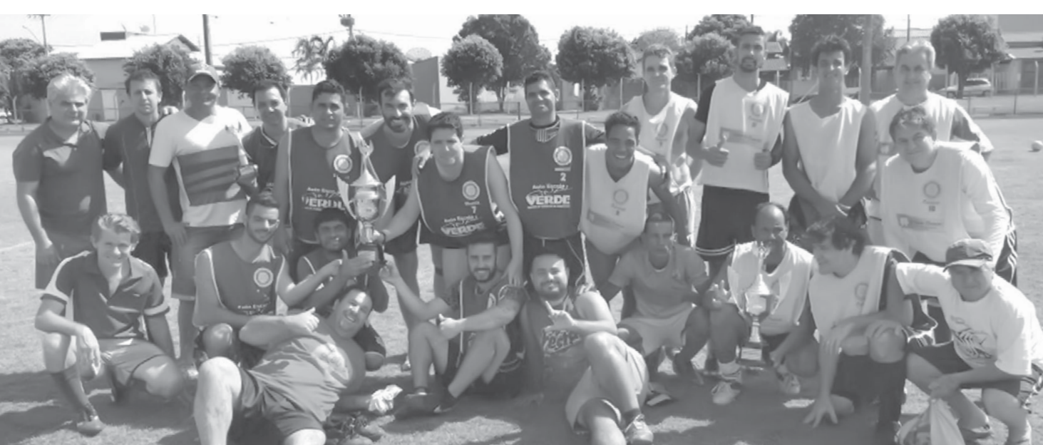
Campeonato manteve a tradição de homenagear os pais e proporcionar momentos de lazer e confraternização