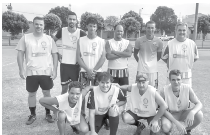
Equipe que participou da final da competição e sagrou-se vice-campeã