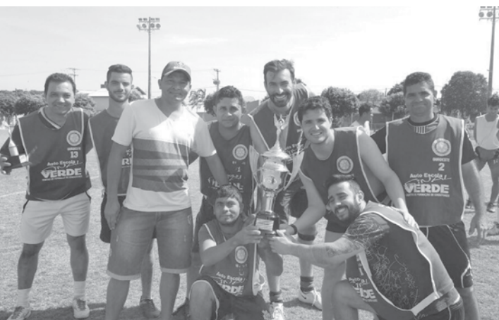
Time que conquistou o troféu de campeão do campeonato em comemoração ao Dia dos Pais

A Prefeitura de Ouroeste, através da Secretaria e Diretoria de Esportes, promoveu no último domingo (13), no Minicampo Municipal, o 1º Campeonato de Futebol Society em comemoração ao Dia dos Pais. A competição contou com a participação de equipes do muni-