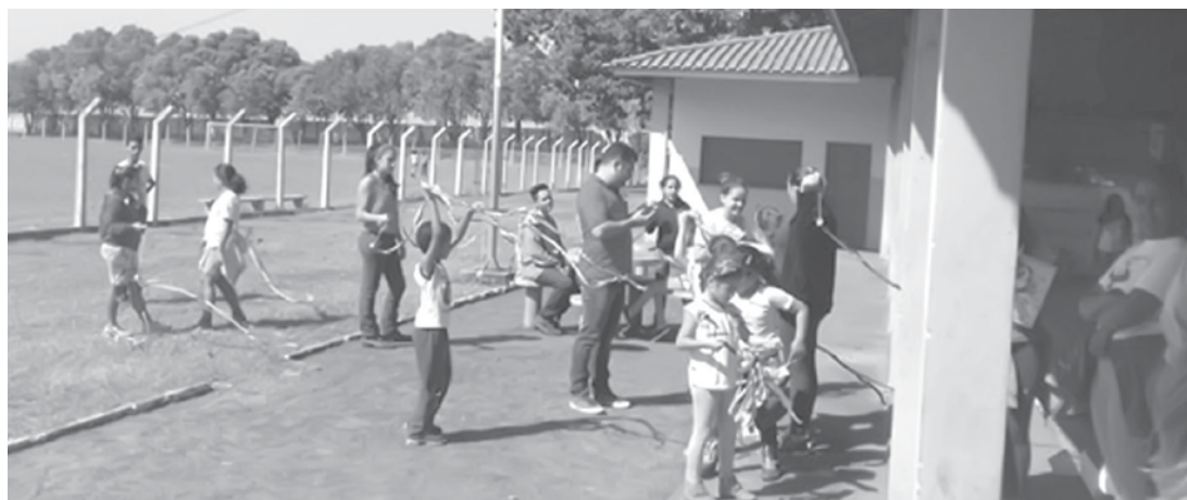
Para comemorar o Dia do Estudante, os alunos saíram da rotina das salas de aula e tiveram um dia de atividades recreativas, como campeonato de pipas, brincadeiras, gincanas etc