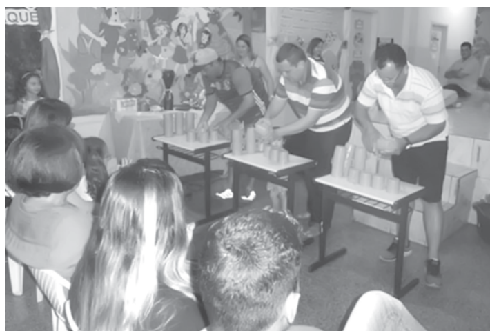
Os pais que marcaram presenças durante as homenagens participaram de gincanas

Campeonato de pipas, brincadeiras, gincanas etc. Foi assim a comemoração do Dia do Estudante, preparada pelos professores e pelo Grêmio Estudantil, com propostas que valorizam as crianças dos dias de hoje, sem deixar esquecer das boas práticas tradicionais.