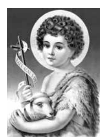
São João Batista

Uma publicação: Sábado, dia 19 de Agosto de 2017. O EXTRA.NET - Edição Nº 3.113.