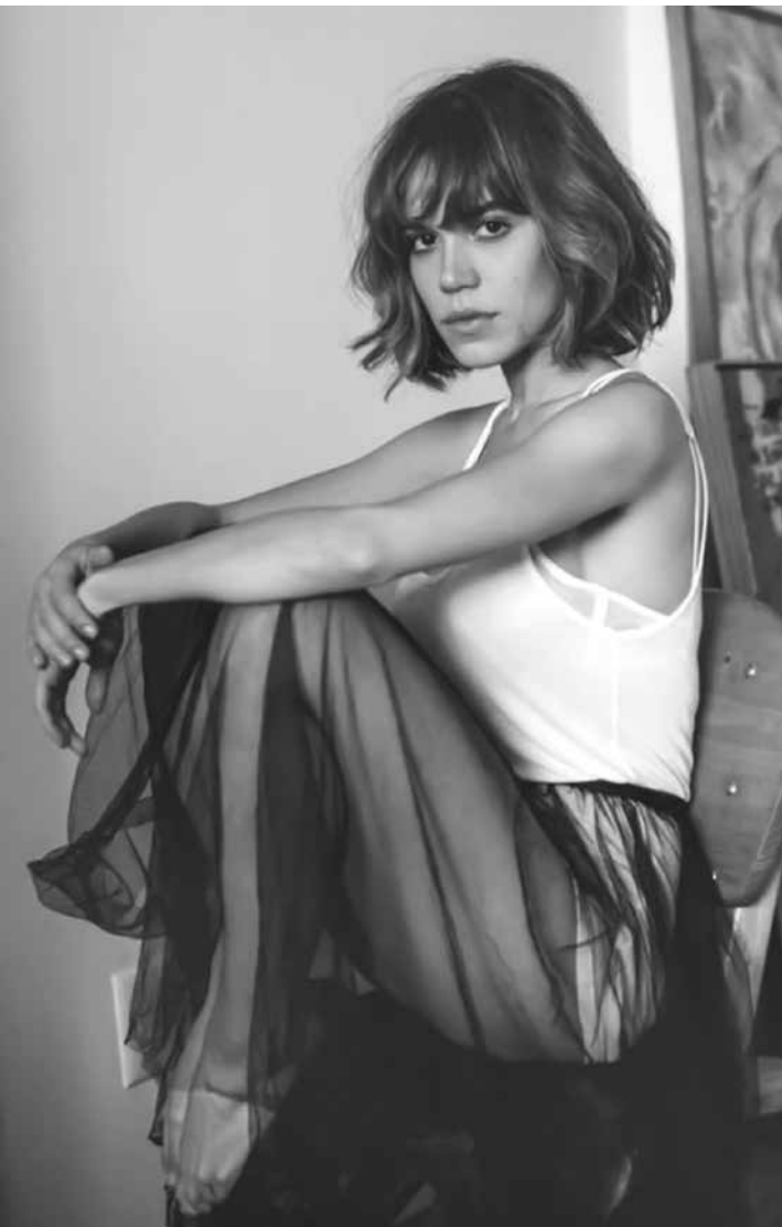
Carla Salle interpreta Maria, em 'Os dias eram assim'