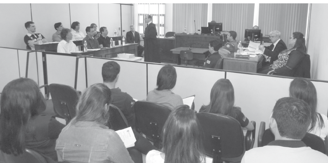
O réu foi julgado pelo Conselho de Sentença e condenado por homicídio duplamente qualificado, com pena de 22 anos de reclusão em regime fechado