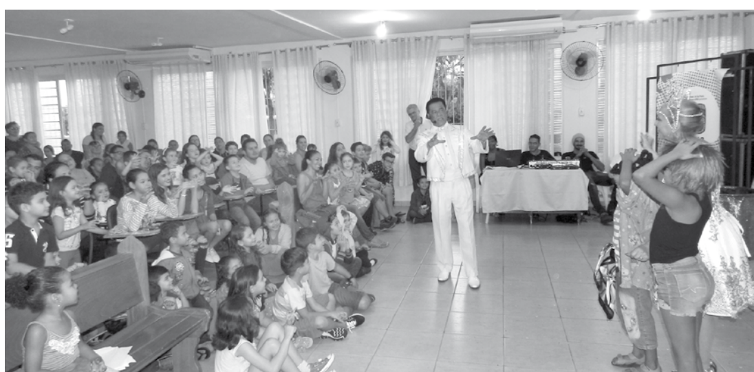
O show de ilusionismo do Circuito Cultural Paulista aconteceu no Salão Paroquial, com público recorde

também números com lenços de seda e bandeiras, cartola, pombas, bengalas e tantos outros instrumentos que ajudam na criação de um universo extraordinário. Bolas, dedais, baralhos e fichas foram objetos íntimos nas mãos do mágico. Rokan integra a AM-SO (Associação de Mágicos de São Paulo), e já foi vencedor no Torneio Interno "Odilon Barbosa de Oliveira", promovido pela entidade. Dentro da Arte Mágica, é especialis-