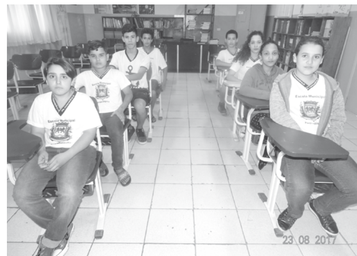
Horas vagas serão utilizadas para preparação à prova

O exame da segunda fase terá seis questões dissertativas, valendo 20 pontos cada, os participantes terão três horas para expor o raciocínio matemático usado para resolver os problemas. A OBMEP integra o calendário de atividades do Biênio da Matemática Gomes de Sousa 2017-2018. Maior olimpíada estudantil do país, tem como metas estimular o estudo da matemática e revelar talentos, promovendo a inclusão social pela difusão do conhecimento.