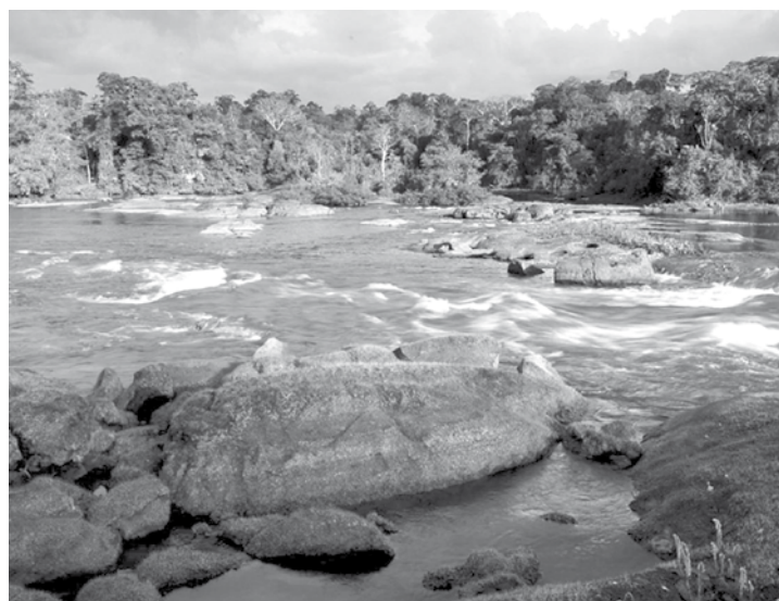
Emendas ao PL 8107 colocam em risco mais três unidades de conservação ambiental, cerca de um milhão de hectares

O texto original do PL pretende reduzir a Flona de Jamaxim em 354 mil hectares, mas as emendas retalham mais três Unidades de Conservação. Na Flona de Jamaxim, dentro da área que se pretende transformar em APA - categoria de Unidade de Conservação que pode abrigar propriedades privadas e atividades agropecuárias – há 125 processos minerários. A parte da Flona de Itaituba II a ser transformada na APA Trairão contém 27 processos minerários, abrangendo mais de 137 mil hectares ou 90% de sua área. A parte do Parque Nacional (Parna) de Jamaxim – a ser transformada na APA Rio Branco (101 mil hectares) – apresenta cobertura florestal extremamente preservada (99%), mas sofre com atividade garimpeira ilegal. Entre os minérios mais procurados, estão o ouro e diamante. No caso do Parque Nacional do Jamaxim a redução da proteção é extremamente grave porque vai estimular o desmatamento na última faixa de floresta remanescente que conecta as bacias do Xingu e Tapajós, uma das regiões com maior biodiversidade na Amazônia. “O desmatamento nessa região vai acelerar a fragmentação da floresta amazônica, comprometendo não apenas a biodiversidade, mas também o papel que a floresta desempenha na regulação climática e na manutenção do regime de chuvas”, diz a nota das ONGs. “Vale lembrar que o Parque Nacional do Jamaxim é uma das UCs apoiadas pelo Programa Arpa, um programa do governo federal, estados e demais parceiros em prol da conservação de 60 milhões de hectares da Amazônia brasi-