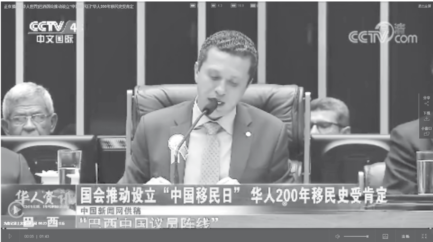
Projeto é inédito e tramita em regime conclusivo na Câmara dos Deputados a data marca a chegada oficial de chineses a São Paulo, em 15 de agosto de 1900. Um grupo formado por 107 pes- soas desembarcou no Rio de Janeiro, vindo de Lisboa, para, mais tarde, chegar à capital paulista em busca de em- pregos e oportunidades. A imigração para o Brasil foi retomada nos anos 1950, quando chineses fugiram da cha- mada "Revolução Comunista de 1949". Vivem atualmente no Brasil cerca de 300 mil chineses.