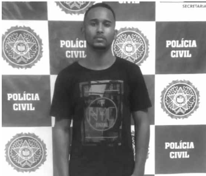
O figurante foi surpreendido pelos policiais durante as gravações da novela