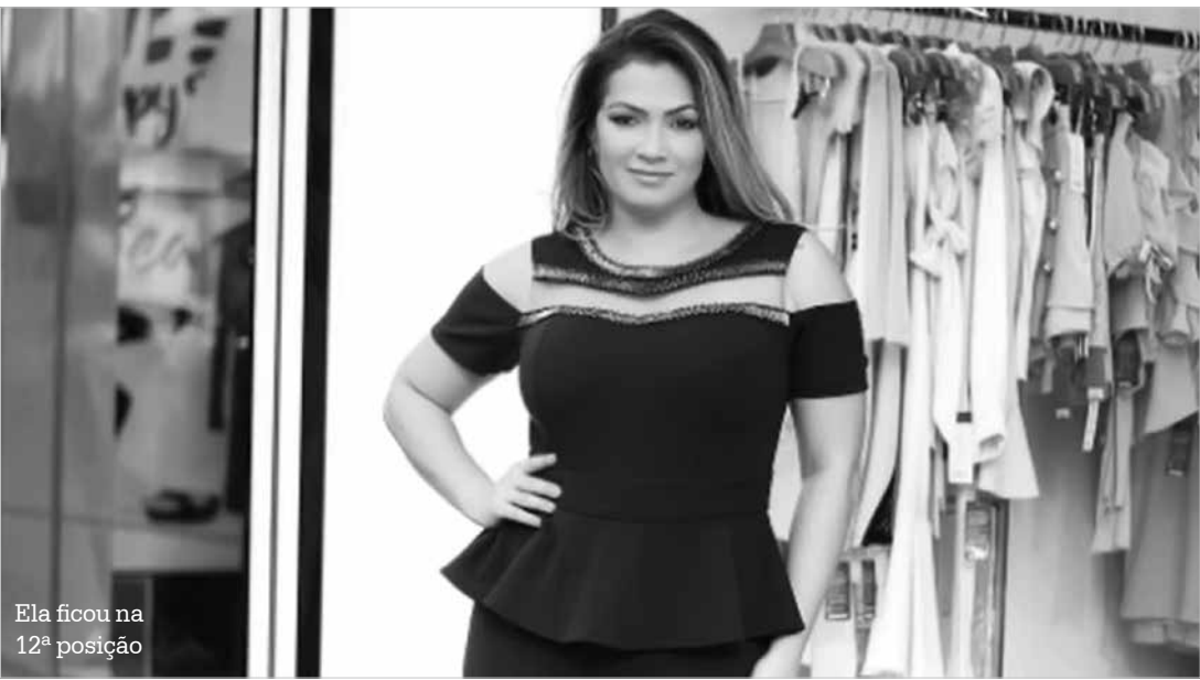
Ela ficou na 12ª posição